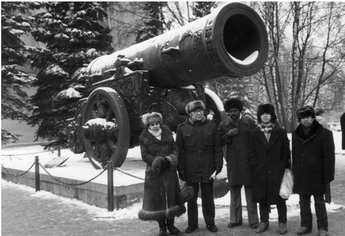
Визначні місця Кремля.