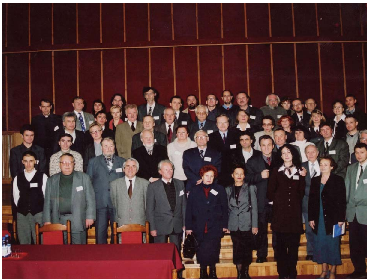
Міжнародна конференція філософів слов'янських країн (2002 р.).

університетах. Заняття будеш проводити з аспірантами, приймати кандидатські і вступні іспити, читати спецкурси. До речі, як у тебе там в Польщі з навантаженням?" Я відповів, що в польських університетах педнавантаження складає 210 год. на рік. Майже все воно у мене в другому семестрі, а в першому семестрі я маю досить часу. Тож подав я заяву на 0,5 ставки (за сумісництвом) і таким чином опинився в ЖДУ імені Івана Франка.