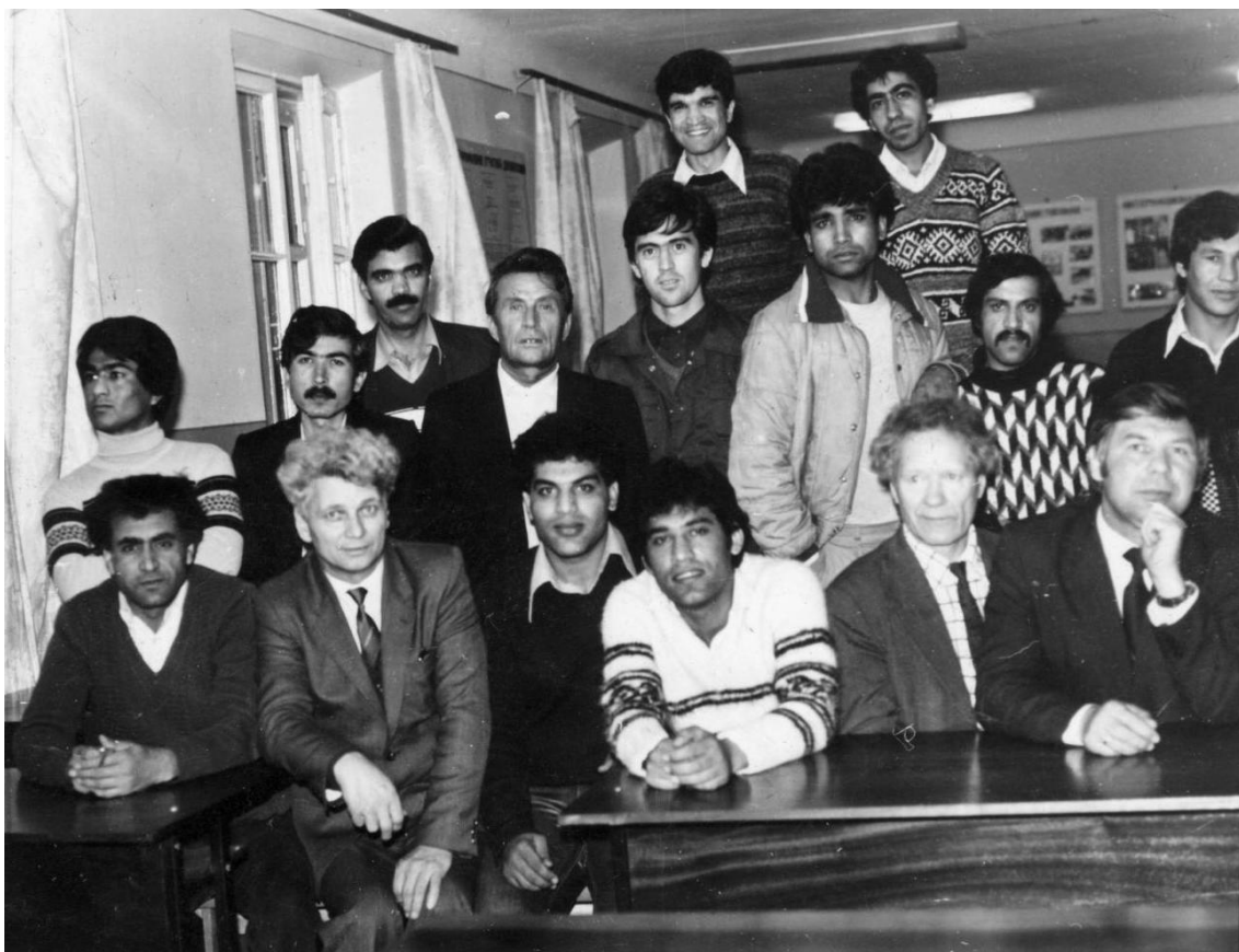
Полтавська аграрна академія (1977 р.) Філософія не знає кордонів.

мене навантаження і коли приступати до роботи. Вона глянула на мене як на дивака і мовила: "Пане доценте, Ви бачите, що робиться на вулицях? Які лекції, адже вже тиждень студенти академії страйкують".