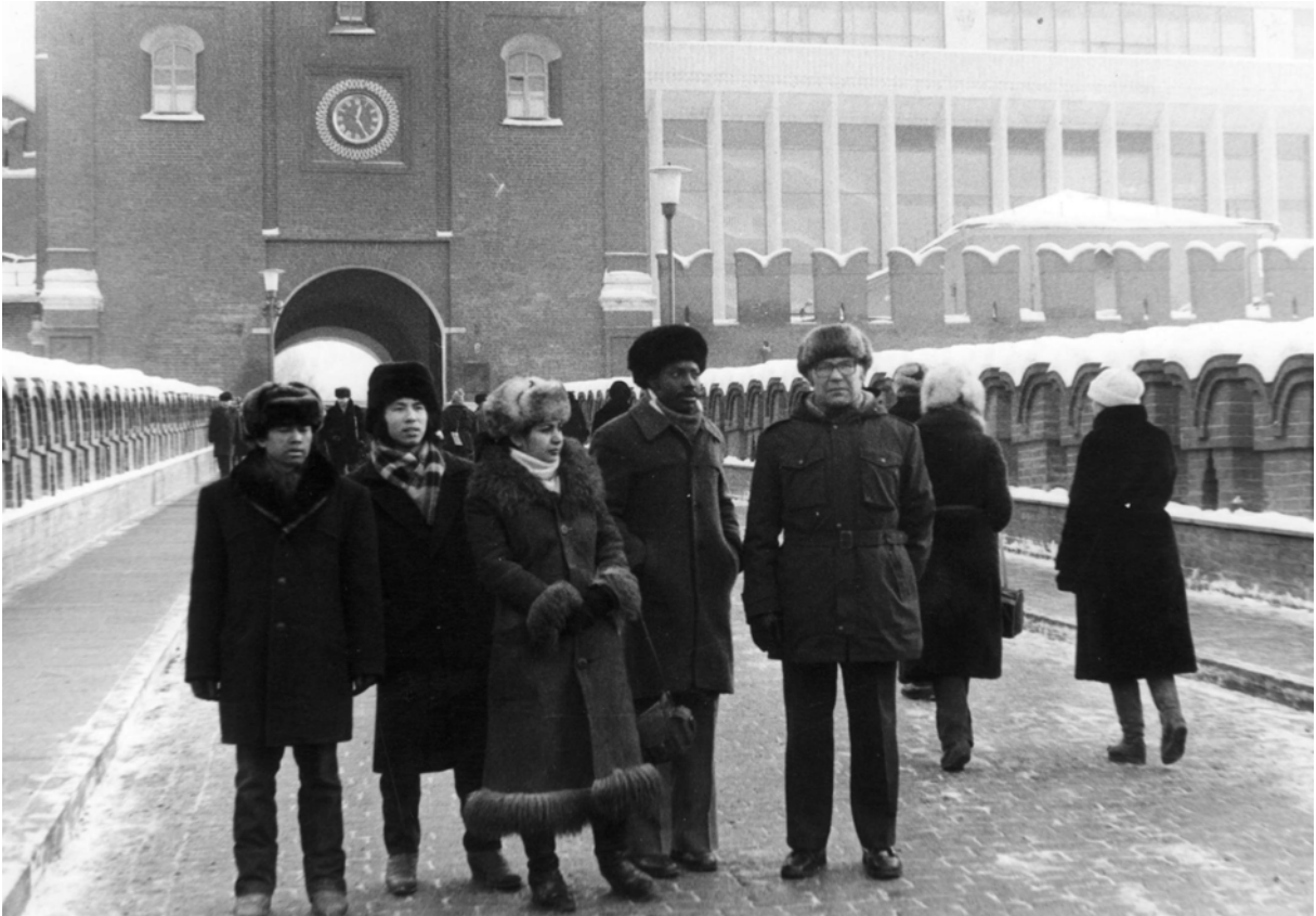
Зі студентами-іноземцями під час екскурсії доКремля.