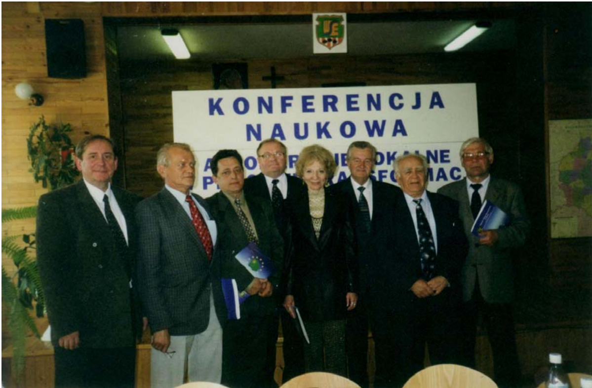
Поляків та українців од'єднують спільні наукові інтереси.

університетських колах. Зникли гарячі дебати, але кожен знав "хто є хто". Часто прийшовши на роботу, викладачі відкривали шухляди столів, а там лежали антиурядові листівки, гасла "Солідарності", вказівки як діяти у підпіллі тощо.