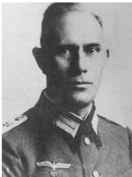
1. Ο Ταγματάρχης Χανς Εμπερσμπέργκερ, υπό τις διαταγές του οποίου καταστράφηκαν τα Καλάβρυτα.

Δυστυχώς, όπως αποκαλύφθηκε μεταπολεμικά, μαζί με τα γερμανικά στρατεύματα στη σφαγή των Καλαβρύτων είχαν συμμετάσχει και Έλληνες των ταγμάτων ασφαλείας, ντυμένοι κυρίως με γερμανικές και ιταλικές στολές και φορώντας «τζόκεϋ εργασίας» και όχι κράνος, όπως τα γερμανικά τμήματα, για να ξεχωρίζουν από αυτά.