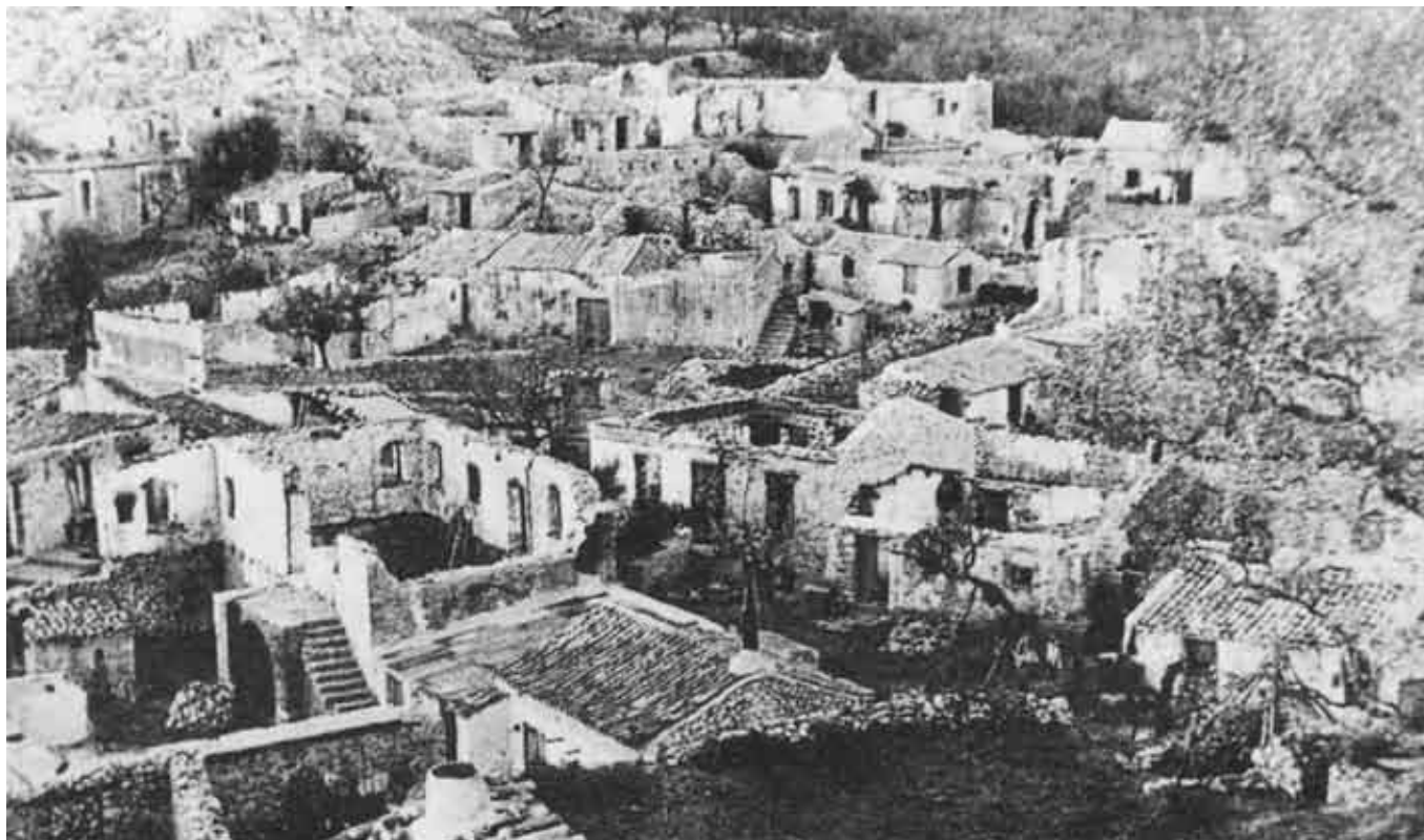
Πανοραμική άποψη των Καλαβρύτων, μετά το ολοκαύτωμα της 13ης Δεκεμβρίου 1943. Οι εκτεταμένες καταστροφές είναι εμφανείς.

για να αποκρούσει τυχόν επίθεση των ανταρτών του ΕΛΑΣ εναντίον τους. Οι φόβοι αυτοί όμως του Εμπερομπέργκερ δεν ευσταθούσαν, γιατί οι αντάρτες είχαν εγκαταλείψει ήδη την ευρύτερη περιοχή της επαρχίας.