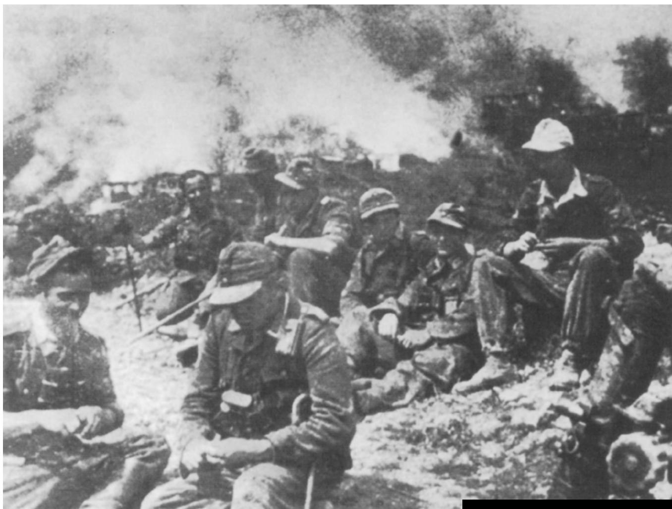
Η φωτογραφία αυτή, ελήχθη ότι παρουσιάζει στρατιώτες της 117ης Μεραρχίας Ορεινών Κυνηγών, να ξεκουράζονται μετά την καταστροφή των Καλαβρύτων.

Β ΑΣΙΚΗ ΑΠΟΣΤΟΛΗ ΤΟΥ 749 Συντάγματος Ορεινών Κυνηγών ήταν «η παρεμπόδιση κάθε προσπάθειας τυχόν διείσδυσης συμμαχικών δυνάμεων προς και επάνω από τον Ισθμό της Κορίνθου», καθώς επίσης και η απόκρουση τυχόν επιθέσεων στο μήκος της παραλιακής οδού Πατρών-Κορίνθου, αυτό που σήμερα αποκαλείται «παλαιά εθνική οδός Αθηνών-Πατρών». Στο πλαίσιο αυτής της γενικότερης αποστολής, η περιφρούρηση της κρίσιμης περιοχής του Αιγίου, κομβικού σημείου με λιμάνι, σιδηροδρομικό σταθμό και οδικό άξονα, αλλά και του τριγώνου Πάτρας-Καλαβρύτων-Τρυπιών, ήταν η βασική αποστολή του 749 Συντάγματος Ορεινών Κυνηγών.