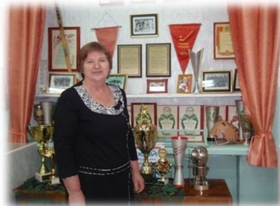
Материал обработала Л. ФЕДОТОВА.

Более тридцати лет Татьяна Лазаревна руководит школьным музеем, хранит, приумножает историю сельсовета, района, области. Мы считаем, что она по праву может стоять в ряду краеведов нашего Каргапольского района. Ее вклад в сохранение исторической памяти трудно переоценить. Многие знают, уважают и ценят Татьяну Лазаревну за ее активную жизненную позицию, любовь к краю светлых полей, ставшим для донской казачки родным.