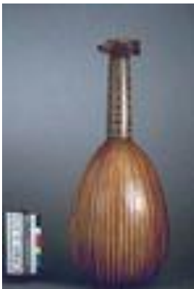
vue de dos