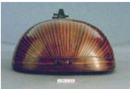
fond de caisse