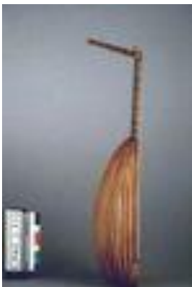
vue de profil