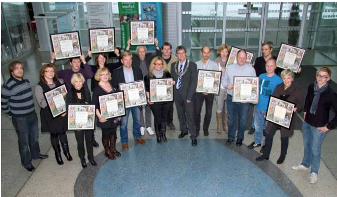
Miljøfyrtårn prisutdeling okt 2010

Torsdag 21. oktober fikk Avskjerming AS, Coop Nord, Ibis IKT, Jupiter Systempartner, Kreftforeningen Seksjon Nord, Kuldeteknisk Tromsø AS, Seminaret Rehabiliterings-tjeneste, Sorgenfri barnehage, Sparebanken Nord-Norge,