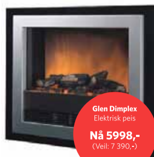
Glen Dimplex Elektrisk peis Nå 5998,- (Veil: 7 390,-)