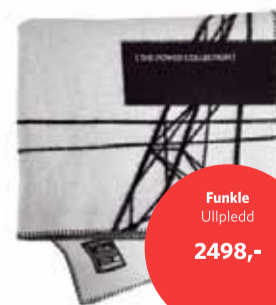
Funkle Ullpledd 2498,-