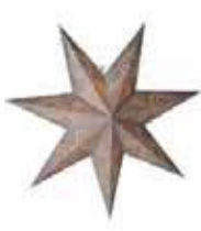
Beatrix fra 248,-