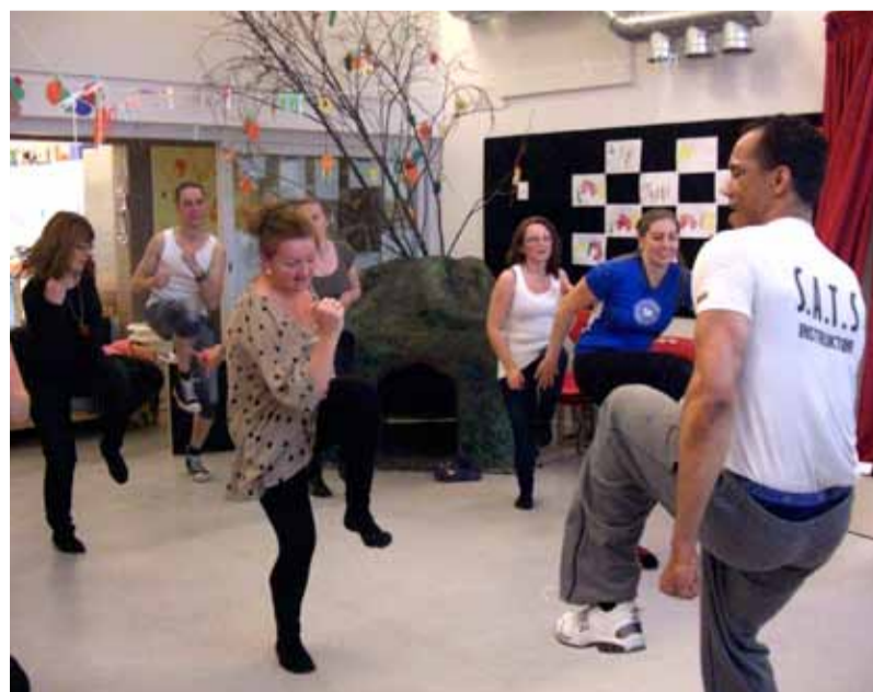
Zumba-trening i Fjellvegen barnehage