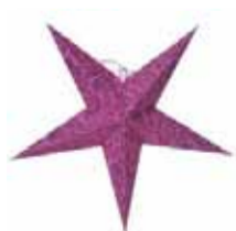
Batik lilla 298,-