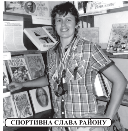
СПОРТИВНА СЛАВА РАЙОНУ

лі фомувати загін самооборони, воно єдина із дівчат вступила в загін захищати своє рідне село та Україну.