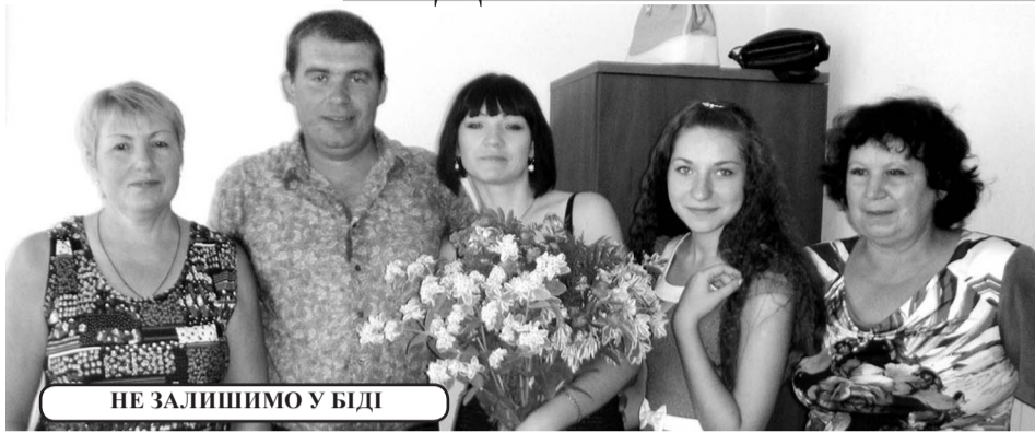
НЕ ЗАЛИШИМО У БІДІ

із Дніпропетровською районною радою, Степовою, Новоолександрівською, Партизанською, Орджонікідзенською та іншими сільськими радами, та редакцією газети «Дніпровська Зоря» зібрани кошти та придбали ковдри, цигарки, шкарпетки для військової частини, яка знаходиться у с. Черкаському Новомосковського району.