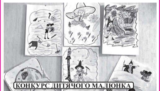
КОНКУРС ДИТЯЧОГО МАЛЮНКА

Лариса ОМЕЛЬЧЕНКО , бібліотекар РДБ, м. Підгородне.