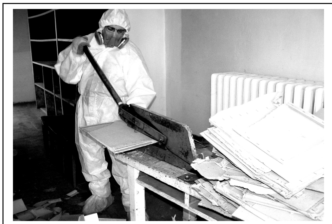
Az azbeszt tartalmú levéltári dobozok darabolása az I. kerületi Hess András téren

sítására 2006. november 21-én a levéltár elvégeztette egy akkreditált céggel a levéltári helyiségekben az azbeszt szálló rost koncentrációjának mérését. Ennek eredményeként megállapítottuk, hogy azokban a helyiségekben, ahol tartósan munka folyik az azbesztes dobozokkal, a levegőben a szálló rost koncentrációja magasabb, mint a jogszabályban — Foglalkozási eredetű rákkeltő anyagok elleni védekezésről és az általuk okozott egészségkárosodások megelőzéséről szóló 26/2000. (IX. 30.) EüM rendelet — megengedett mérték.