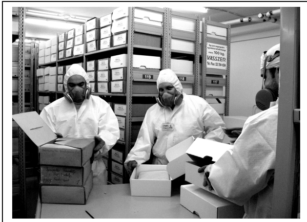
Átdobozolás a VI. osztályon.

Az I. kerületi Hess András téri épületben sem a felvonók, sem pedig a stabil állványzat nem tette lehetővé, hogy a praktikus, akár 320 dobozt is elnyelő úgynevezett Big-Bag zsákokat alkalmazzunk, mint ahogy azt a III. kerületi Lángliliom utcai modern épületben tettük. Ezért a vári épületben a dobozokat aprítani kellett, hogy az azbesztes hulladék tárolására és szállítására alkalmas kisebb méretű zsákokat az épületből ki tudjuk vinni.