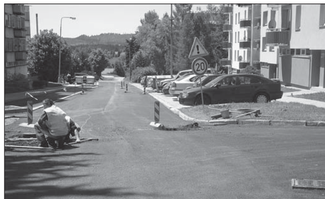
Parkoviště na sídlišti

Chodník na Sídlišti Míru od Esa k mateřské škole je již vybudován a nových devět podélných parkovacích míst bude brzy hotovo.