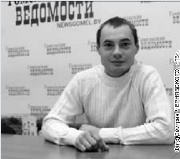
Фото Дмитрия ЧЕРНЯВСКОГО, «ГВ».

— Покупатели обслуживаются в установленное время работы продавца. За 10 минут до окончания работы покупателей должны предупредить о том, что обслуживание прекращается.