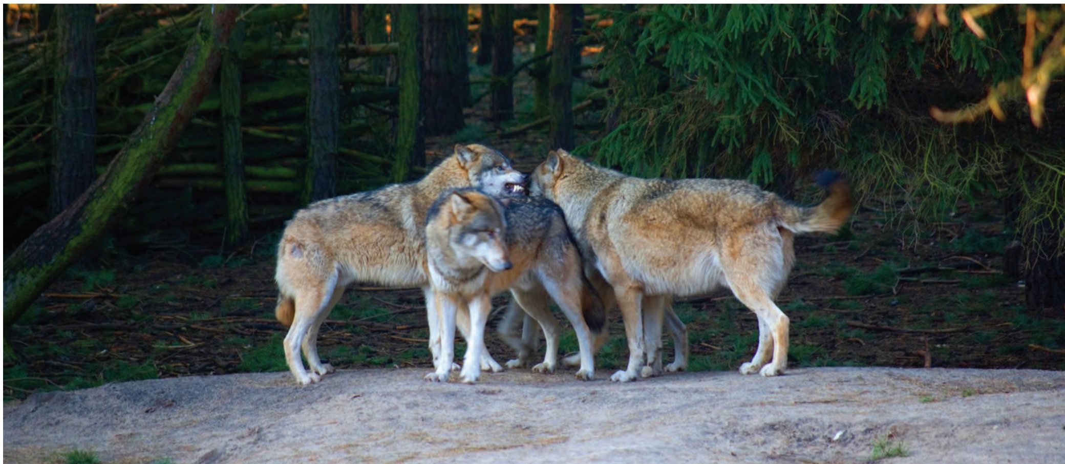
2013. aastal oli kutsikatega hundikarjade hulk Eestis kahanenud 22-le ja huntide koguarv umbes 200 loomani.

Jõulud on aeg, mil inimesed naudivad rahu ning head ja paremat söögipoolist. Jahimehed hoolitsevad aga selle eest, et ka metsloomad saaksid osa sellest pühast.