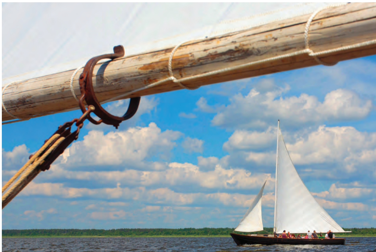
Kalepurjekas Võrtsjärvel.