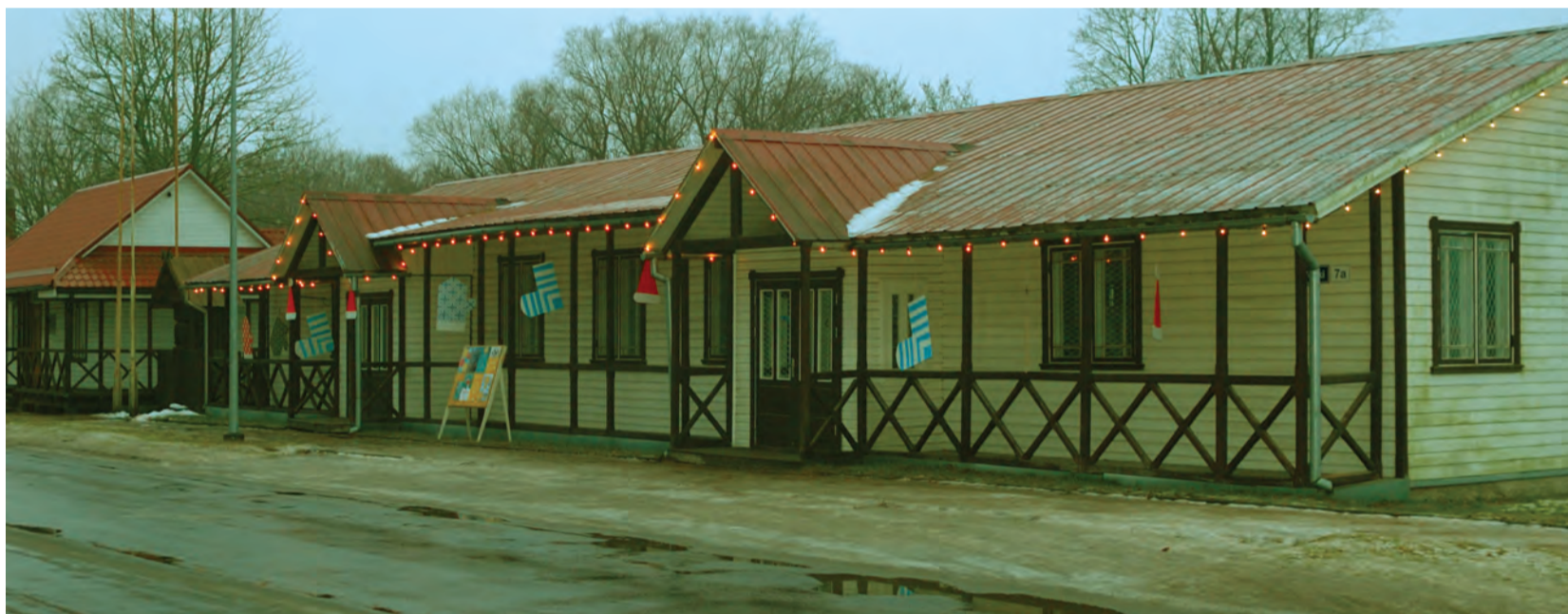
Jõulukohviku tarbeks ehitatud Veski 7a.

Aastavahetusel toimub Veski 7a majas laudadega ja eelbroneerimisega aastavahetuspäev, kus hoiab meeolu üleval ansambel Onupoeg Viljandist. Tantsumuusikat tuleb mängima Tre.ee ja oodata on ka üllatusesinejaid. Laua broneerida saab pille@torva.ee