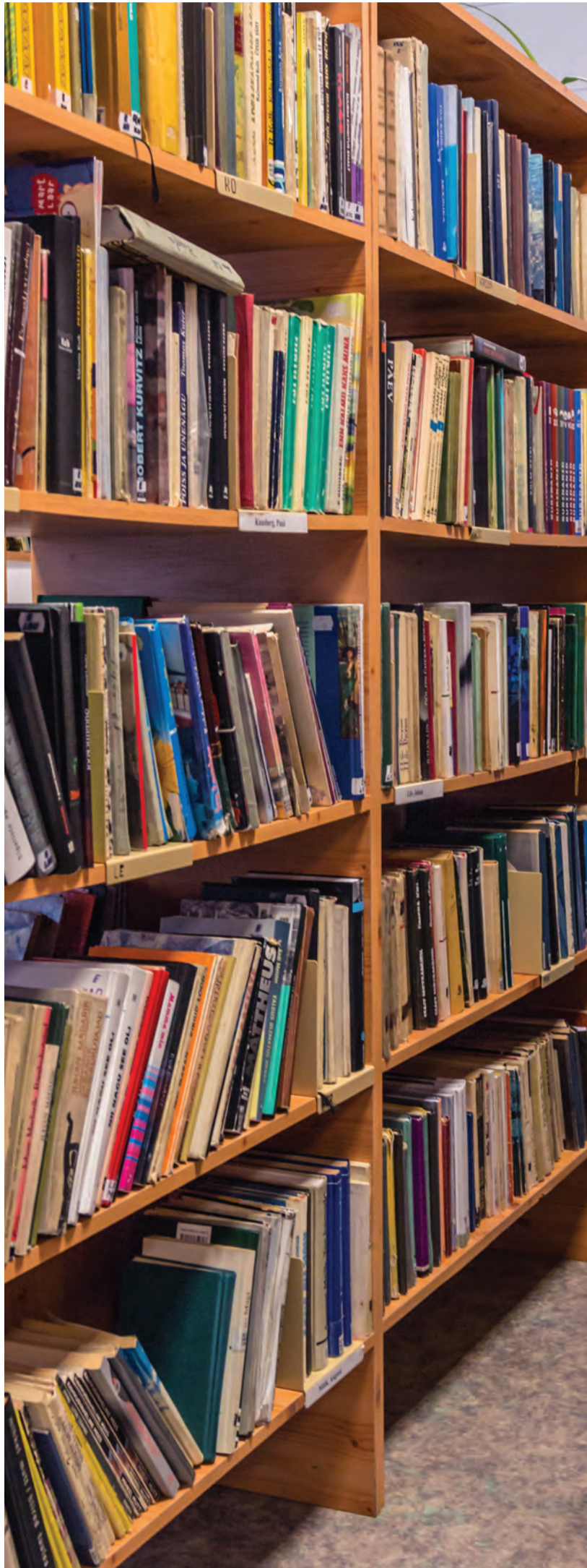
Igal aastal laenutatakse Tõrva raamatukogus ligemale 25 000 raamatut.

Tänavu peab Tõrva Linnaraamatukogu taas väikest juubelit. Pärast suurt teetähist viis aastat tagasi on jätkunud usin tegevus ka edaspidi ja õnneks ei ole sellel lõppu tulemas.