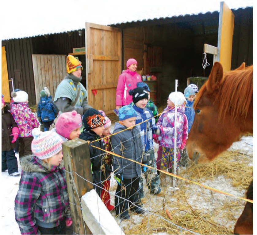
Lapsed Muhkliimaal.

28. novembri pärastlõunal külastasid koolilapsed ja lasteaia vanem rühm Muhkliimaad Lillis. Oli tõeline talvine ilm. Kohapeal ootasid meid Musi-Muhkel ja Öue-Muhkel, kes tutvustasid koduloomi. Igat looma sai paitada ja sööta. Metsa-Muhkel õpetas kirja teel metsa jälgima ja metsas käituma. Mugula-Muhkel pakkus lõkkes küpsetatud kartuleid ja vaarikavarre teed. Maiuse-Muhkliga küpsetati suhkukringleid. Üks Muhkel meisterdas koos lastega külmpakimagneti. Mini-Muhkel