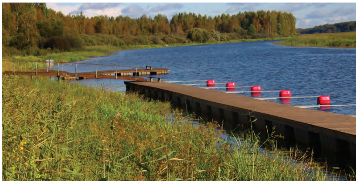
Pikasilla puhkeala - Võrtsjärve lõunavärv.

Soovin kõigile rõõmsat puhadeootust ja võrratuid hetki Võrtsjärve ääres ka algaval aastal!