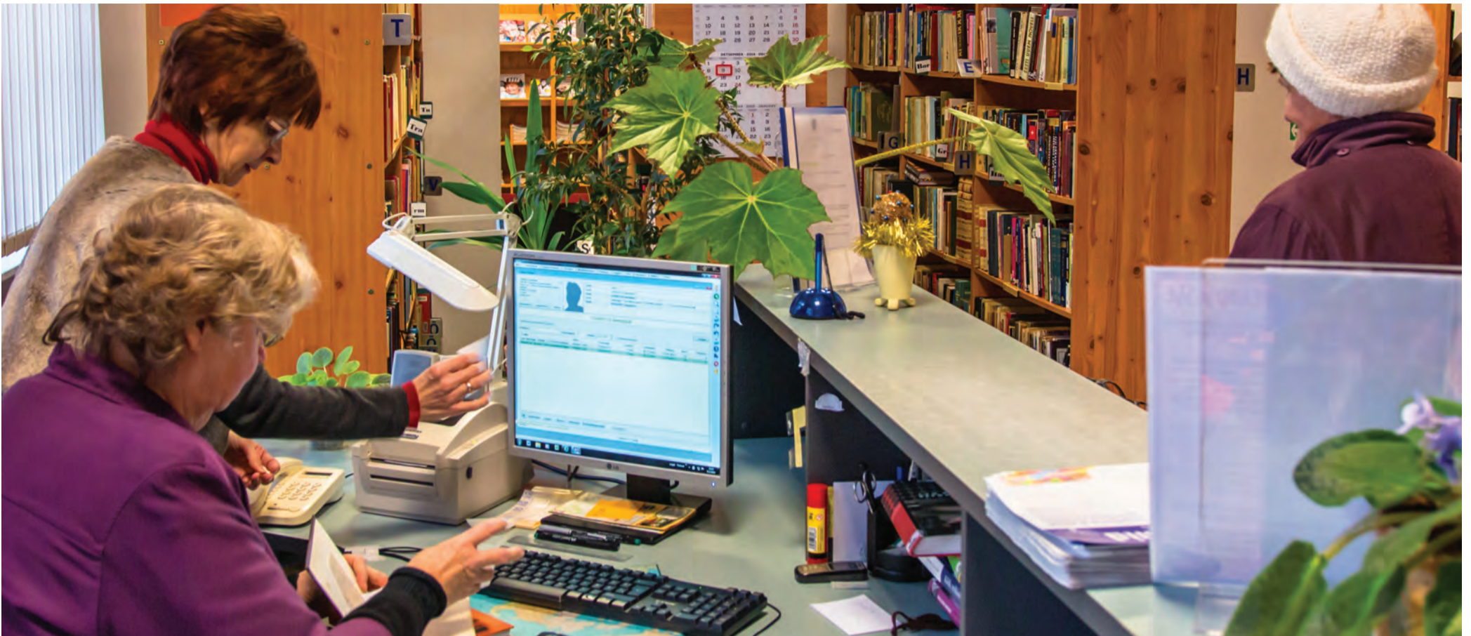
Raamatukogus käib kibe töö viiel päeval nädalas.