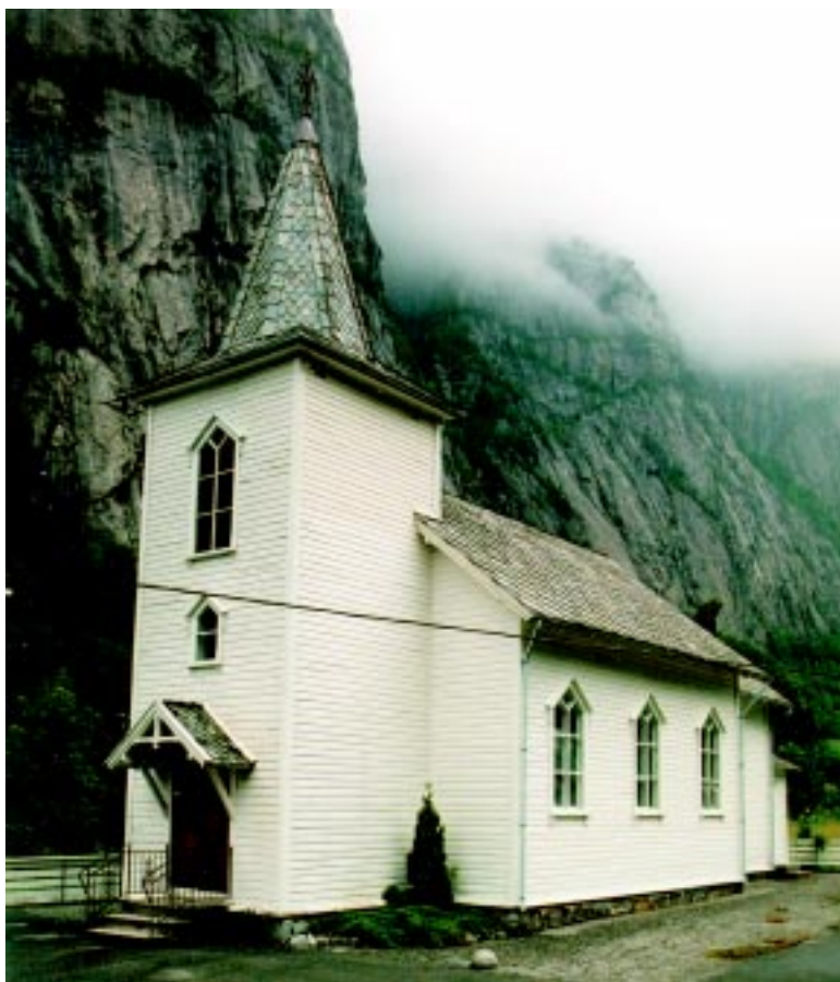
Fjæra kapell inst i Åkra- fjorden.