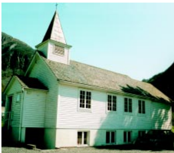
Frette kapell inst i Stordalen.

Det har vore bedehus på Frette sidan 1910, men i 1959 bygde ein ut bedehuset som då også vart vigsla som kapell. Altertavla er eit krusifiks som tidlegare stod i Stødle. Frette kapell høyrde til 1997 inn under Grindheim sokn. Kyrkjegarden for dei som soknar til Frette, ligg ved Grindheim kyrkje.