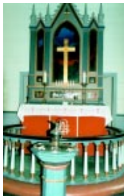
Altertavla i Fjæra kapell.

Dette kapellet vart bygt i 1913 med 150 sitjeplassar. Altertavla viser den opne grava. Kyrkjeklokka er også frå 1913. Før kapellet vart bygt, høyrde «fjorden» til Åkra sokn med båt som kyrkjeskys. Det er gravplass ved kapellet.