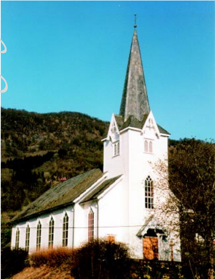
Skånevik kyrkje, bygt i 1900. Gamlekyrkja stod like ovanfor den nye.

Me veit ikkje sikkert når det første kyrkjebygget vart reist i Skånevik. Men kyrkja er nemnt allereie i 1340, altså før Svartedauden. Ein må gå ut frå at ho då allereie har stått der ei tid, kanskje i hundre år? I ein synfaringsrapport