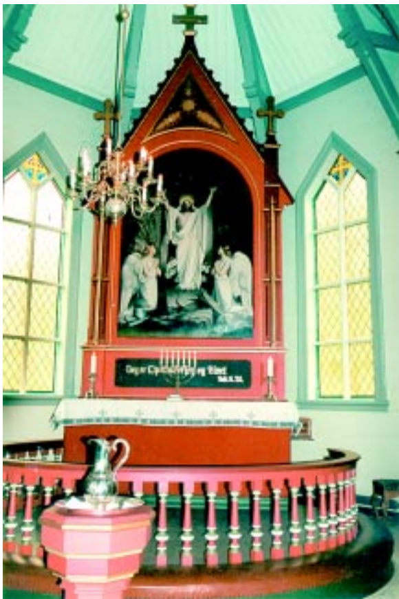
Altertavla og koret i Skånevik kyrkje. Nymåla til jubileet hausten 2000.

Orgelet i den nye kyrkja , Jämlich, er frå 1975 og vert nytta ved konsertar. Altertavla viser Kristi oppstode. Ei gamal altertavle frå 1704 finst inne i kyrkja. Etter å ha vore eige prestegjeld i fleire hundre år, vart Skånevik eige sokn i Etne prestegjeld i 1984. K o m m u n e - samanslåinga hadde då allereide eksistert i omlag 20 år.