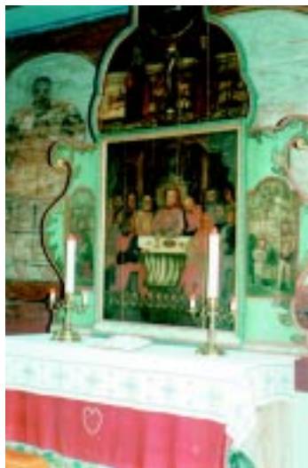
Altertavle i Gjerde frå 1738. Antependiet er frå 1716.