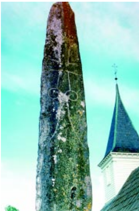
Krossbautastein ved Gjerde kyrkje. Truleg det eldste teiknet på overgangen til kristen tru i Etne.

I 1163 vart Magnus, son til Kristin og Erling Skakke, vigsla til konge i Bergen. Samstundes vart det bygt kyrkje på Stødle. Dette kyrkjebygget er no den eldste delen av Stødle-kyrkja. Men det har truleg vore kyrkje på Gjerde, og kanskje på Grindheim, før dette. Når ei ætt gjekk over til den nye trua, måtte dei ha eit hus til utøving av trua. Allereie i 1320 er Etne oppført med 3 sokn og tilsvarande mange prestar. Etter Svartedauden (1347-50) var det berre ein prest for desse sokna, slik det har vore seinare.