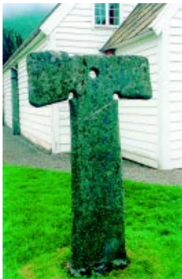
Den keltiske krossen med runesteinen ved kyrkjeveggen.