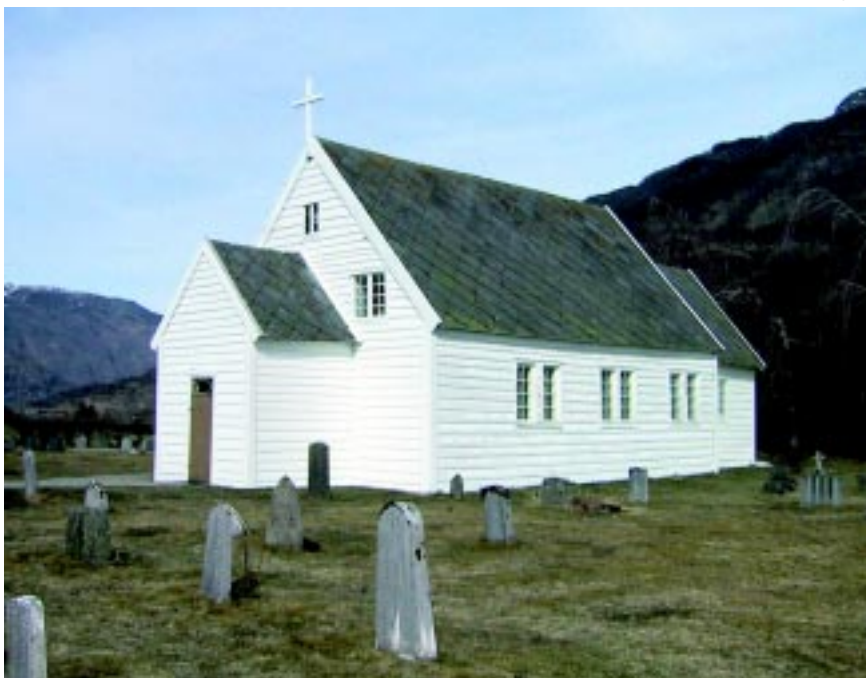
Grindheim kyrkje sett frå sør-vest.