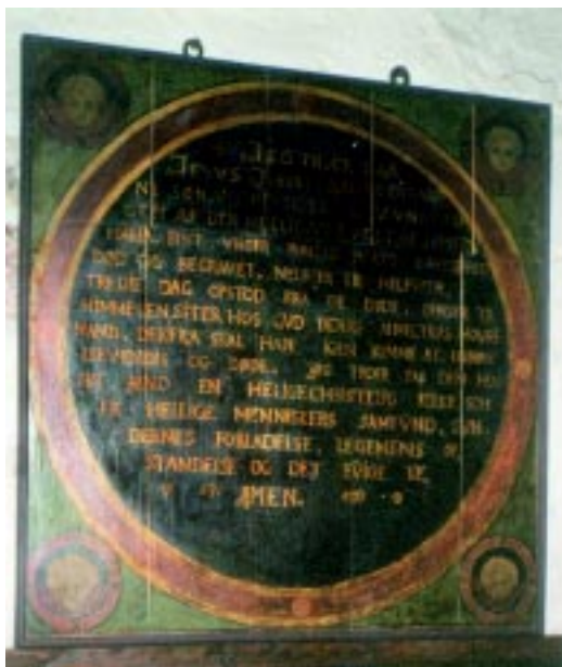
Katekismetavle frå reformasjonstida.

Studla der Orms-hallen var. Ho har hatt namnet «Christ Hovedkirke», og er i dag hovudkyrkja i prestegjeldet. Etter reformasjonen vart ho utvida (ca 1650). Den gamle kyrkja utgjer no koret. Kyrkjekipet fekk ei storvøla i 1698 etter ein storm som herja i 1673. Kyrkja vart pryda med bilete i barokk stil. Den gamle lysekruna er frå 1704. Katekisme-altertavla som no heng på nordveggen, er truleg frå 1600. I einevaldstida, frå 1660-1720, åtte kongen alle kyrkjene. Seinare kom dei på private hender, til dess kommunane kjøpte dei midt på 1800-talet. Slik var det også med denne kyrkja. Hausten 1878 fekk kyrkja nytt tårn etter at dette hadde falle ned i ein storm i 1722.