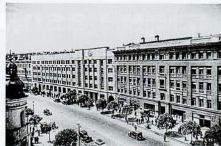
Здание справа — «Гранд Отель», в котором находилась миссия, левее — старый почтамт