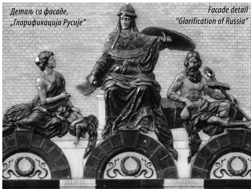
Детаљ са фасаде, „Глорификација Русије“

наглашена високим стрмим кровом са фијалама. Јединствени корпус добио је призматичне тростране еркере који уместо подеоних венаца разуђују фасаде. Зидна платна ослобођена су хоризонталних подеоних венаца, архитектонске пластике око отвора, лизена и пиластера. Употреба мермера, керамичких плочица и фајанса за оплату фасаде означили су прихватање сецесијских поставки о употреби нових племенитих и трајних материјала. Цокл хотела „Москва“ израђен је од најбољег српског рипањског гранита, приземље је обложено полираним плочама од црвеног шведског гранита, а већи део слободне површине фасада од првог спрата па до крова обложени су фино израђеним жућкастим плочицама. Зелене керамичке плочице којима је остварена изузетна декоративна, колоритна оплата фасаде, израђене су у чувеној фабрици мајолике и керамичких украса „Жолнај“ из Печуја. Украсни мотиви на фасади израђени су према Илкићевим нацртима. Употребом нових материјала зграда хотела „Москва“ спадала је међу ретке у Београду с хроматском фасадом, до тада присутна само на згради Управе фондова (данашњем Народном музеју). Значајне детаље фасаде хотела и његовог орнаменталног корпуса чине скулптура „Жена са три детета“,