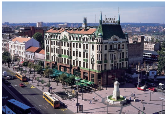
Изглед теразија, 2005. Appearance of Terazije Square, 2005.