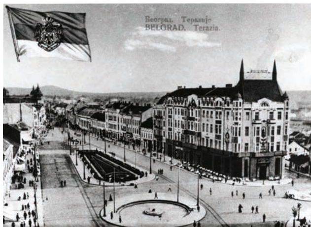
Теразије почетком друге деценије прошлог века Terazije Square at the beginning of the second decade of the last century