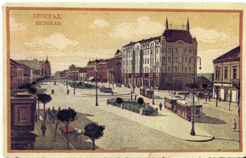
Изглед Терезија са хотелом "Москва", 1921/22.

Appearance of Terazije Square with Moskva Hotel, 1921/22.