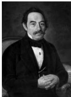
Јован Хаџић (Милош Светић)

Сомборац са којим је Вук имао највише неспоразума и полемика био је Јован Хаџић (1799-1869), у тадашњој српској књижевности познатији као Милош Светић , иначе један од покретача и први председник Матице српске. Хаџић је испочетка са Вуком имао коректне и пријатељске односе, али се њихова вишегодишња међусобна нетрпељивост развила током десетогодишње оштре полемике по питању српског језика, азбуке и правописа. Како су обојица била жустра у одбрани својих начела, полемика је повремено обилвала неодмереним речима, па и увредама. Хаџић је бранио своје конзервативне ставове честим „утуцима“, на које је самоуки, али виспренији Вук одговарао кратко и оштро. У тој полемици Хаџић је био нешто одмеренији и трпељивији од Вука, који је умео да претера у оштрини и да научну препирку пребаца на лични обрачун. Чetrдесетих година XIX столећа Вук је добио снажну подршку српске књижевне омладине (Ђуре Даничића, Бранка Радичевића, Јована Суботића, Јована Ђорђевића, па и црногорског владике П. П. Његоша), чији врхунац је представљало објављивање знамените Даничићеве филолошке студије „Рат за српски језик и правопис“ (Будим, 1847), која је пресудно допринела коначном поразу Хаџићевих језичких назора и победи