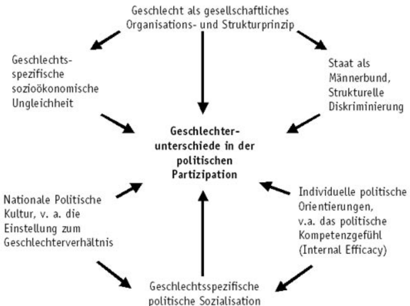
Abb. 3: Erklärungsansätze

Die in der folgenden Graphik abgebildeten zentralen politikwissenschaftlichen Erklärungsansätze der Mainstream- wie der genderorientierten Forschung zur politischen Partizipation werden anschließend vorgestellt.