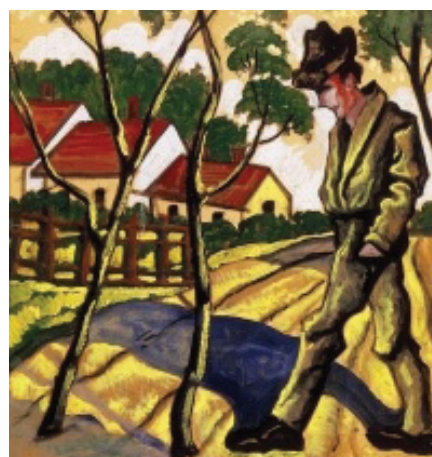
Scheiber Hugó: Csavargó