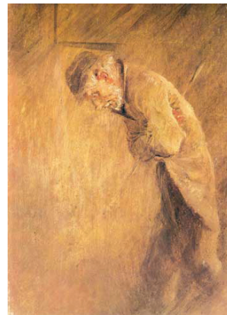
Mednyánszky László: Öreg csavargó