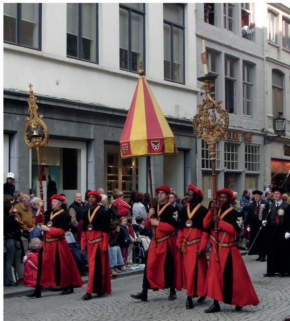
Procesión de la Preciosísima Sangre en Brujas, en el centro el conopeo (del latín, conopeum), y a la izquierda el tintinábulo.