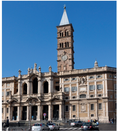
Basílica de Santa María la Mayor. Roma.

Estamos convencidos que el Santuario y Ceuta se merece por muchas circunstancias y motivos históricos, que nuestro Santuario tenga el título basilical y por ello, así lo expresamos, así lo sentimos, y así lo deseamos .