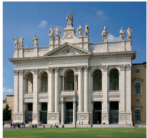
Basílica de San Juan de Letrán. Roma.

Con independencia de su trazado arquitectónico, una Iglesia puede titularse “Basílica”, por prerrogativa del Romano Pontífice. Así en sentido litúrgico, son basílicas todas aquellas Iglesias que, por su impor-