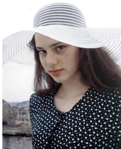
„Első római utam során, 1998-ban”

– Valójában minden költőt meghatároz a nyelvhez való viszonya. A nyelv alatt pedig természetesen az anyanyelvet értem: azt a közeget, amin kívül a költő nem tud létezni. Ezt, ha korábban nem is éreztem ilyen tisztán, a Padovában töltött idő során (a Pázmány Péter Katolikus Egyetem olasz szakos hallgatójaként tölthettem egy évet az itáliai városban mint ösztöndíjas) a bőrömön tapasztaltam. Amikor hazajöttem, mindenki azt kérte tőlem, meséljek Padováról. Furcsa, de alig-alig tudtam ilyenkor megszólalni, csak nagy nehezen sikerült valamit elmondanom abból, amit ott átéltem. Mintha túl sok, túl sűrű lett volna ez az egy év, nem véletlen, hogy a később, már itthon írt verseim is, melyek legutóbbi kötetemben jelentek, tele voltak Padovával, az ott töltött időszakkal, és benne saját magammal. Minden élményen túl,