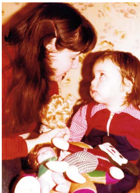
„Édesanyámmal, másfél évesen”

író sem olvas? Ráadásul az olvasást nem lehet elég korán kezdeni, hiszen hozzá is épp úgy, mint az íráshoz, évről évre, lassanként nő fel az ember. Az én költői fejlődésemet is leginkább egy olyan úthoz hasonlítanám, amely minden buktatójával, nehézségével, és persze napsütéses tisztásaival együtt, nemcsak átlépett, elhagyott ösvényként nyúlik a távoli múltba: részemmé is vált maga az utazás. Utólag tudom: minden lépés én voltam, én vagyok, még akkor is, ha jobbra csak utólag ismertem fel, az akadályok nagy részét saját magam gördítettem magam elé.