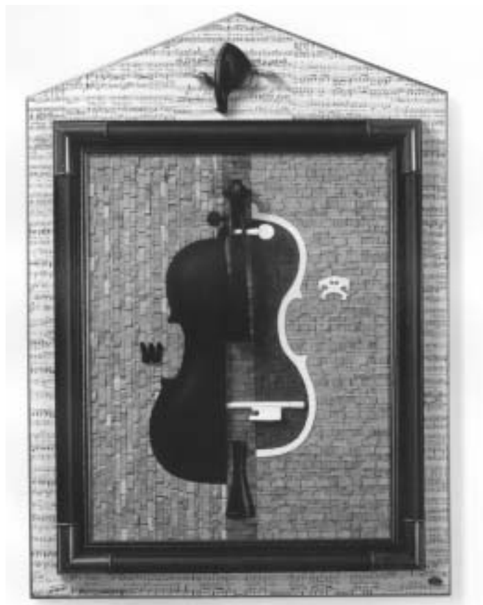
Sylvia hegedűje (hegedű alkatrészek, kottapapír, fakeret)

Hallgat, és meggyűlöl. Magamra hagy. Néhány órát alszom, mielőtt újra nekivágok; mint tolvaj cipelem hátamra szíjazva az identitást.