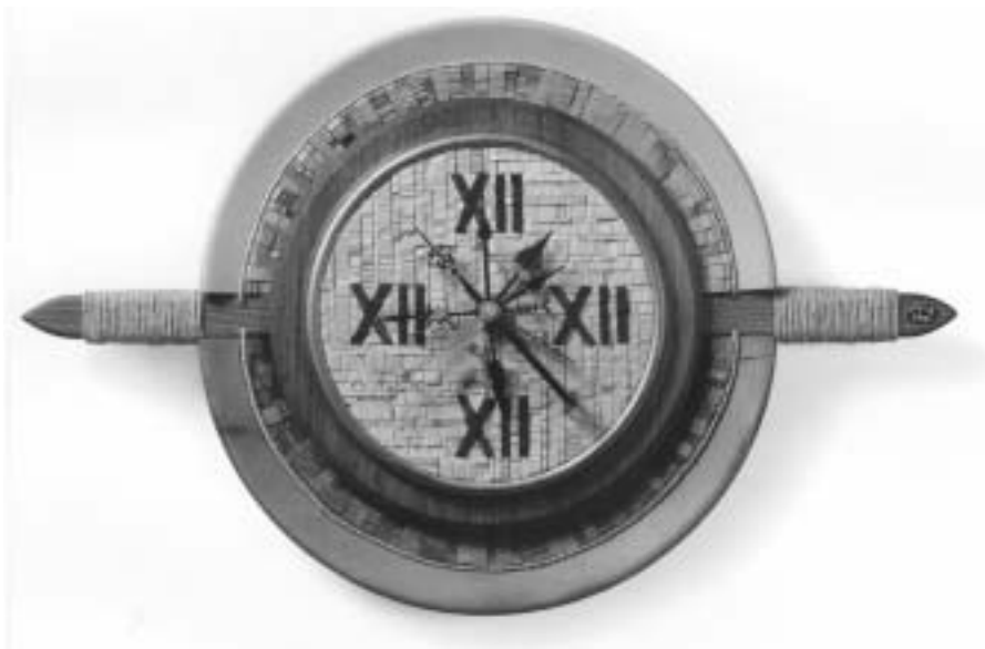
Az idő mérhetetlen (famozaik, óramutatók, esztergályozott korongtál, sprága)

Ha Hilmar Pabel által fényképeztetni le magát az ember, az annyi, mintha meghalni tanulna, tanára pedig az a férfi, aki 1938-ban kamerájával a csimpánzketrec rácsához nyomakodott, és fényképezni annyi, mint a halálraítélteket megmosolyogtatni. Fénykép rögzíti, ahogyan az alighanem első fényképező majom egy Leicával felvételeket készít a berlini Állatkert látogatóiról. Egy Leicával, amelyik rövidesen a lublini gettóban egy megrendezett razziát örökít meg, gondolom, és egy szót se szólok. És miközben még egyszer szemügyre veszem a Titine nevű csimpánzhölgyet, amint sötét majomkeze a fényképezőgépet tartja, megértem, miért tudom magamnak egyrészt könnyen, másrészt sehogyssem megmagyarázni, hogy hogyan nevette, meg ríkat meg bennünket egyazon Leica.