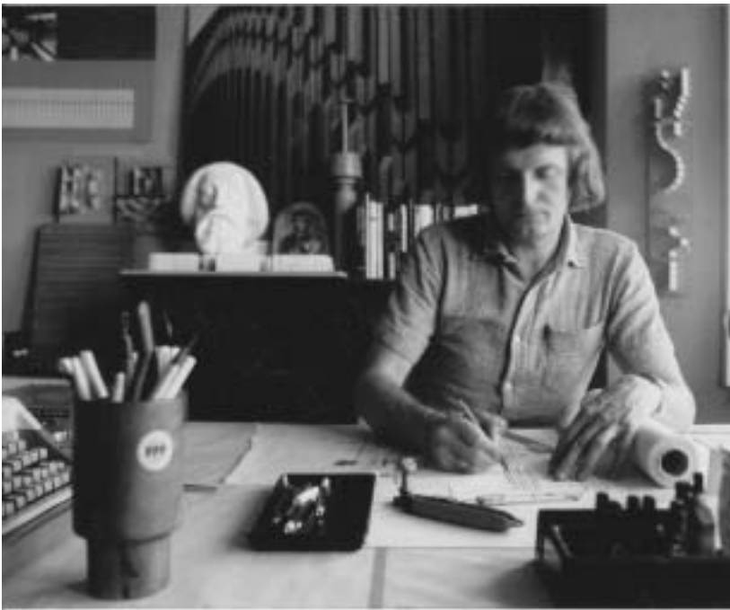
Műtermi munka közben (1980–1990)