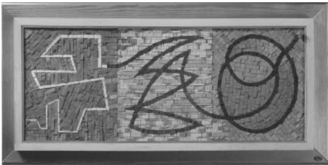
Gyermekkor – felnőttkor – öregség (famozaik, gyöngy, fafaragás, fakeret)