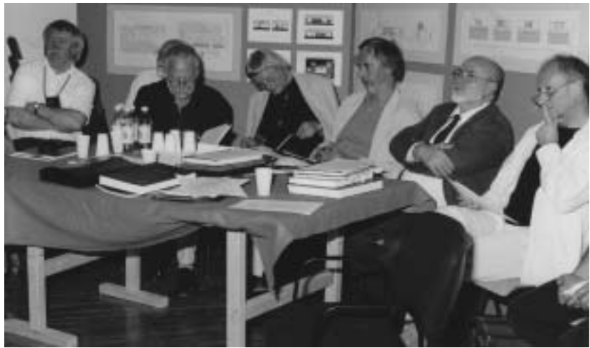
Soproni Alkalmazott Művészeti Intézet, Diplomabizottság

– Olyan tömegű szószátyárságra, semmitmondásra, a nullák felmagasztalására, a semmi ömlésére van a mai sekélyes, felszínes élet berendezkedve, hogy az ember óhatatlanul azokat a formákat keresi, ahol szükíteni tud, s megpróbálhat csakis a lényegről szólni. Úgy hiszem, a költők nagy része is eleve azért nyúlt a versformához,