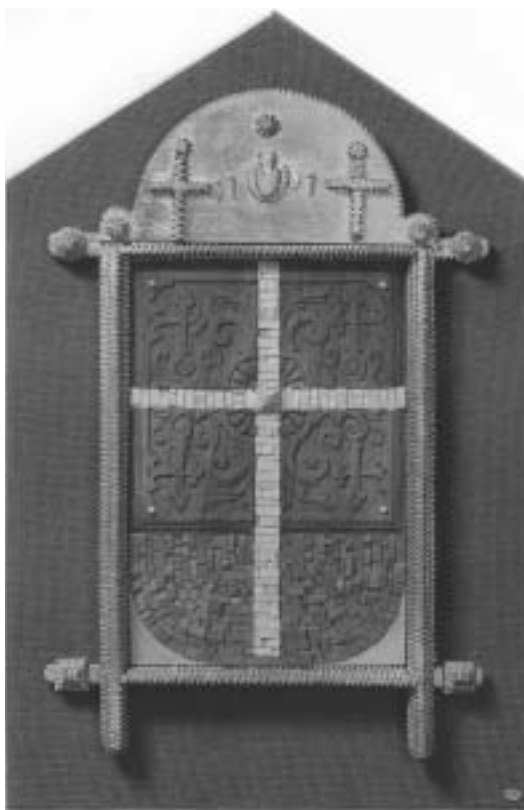
Címer is lehetne... (famozaik, fafaragás, 1907-es keltezésű népművészeti fakeret, keretezett textil háttér)