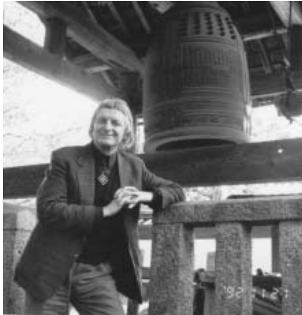
Államtitkárként Japánban (1992)

– Talán igen. Ha volt is kultúrharc, nem kormányzati szinten. Gazdasági és politikai támogatás nélkül nem lehet belescapni a kultúrlecsóba. Ugyanakkor egy el-