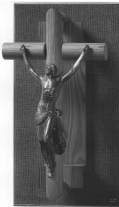
Korpusz (barokk, bronz öntvény, fainstalláció, keretezett textil háttér)

Ez az érme vezérelte a művészet felé, elhatározta, ha addig él is, ilyeneket készít majd, hogy az ő keze nyomán érintse meg mindenki a pénzt, és általa becsülje meg a vagyonát. A nyakában hordta mindig egy vékony bőrön a tallért, amit az apjától kapott, és valóban örökre megjegyezte a látványt: semmi sem lehet szebb a földön, mint az, ami magának a kisugárzásnak a fénye, a tűz. Ezért minden test közül a tűz az, amely önmagában szép, mert a legkönnyebb, és a legközelebb áll a testnélküliséghez, és egyedül ez nem foglal magába más