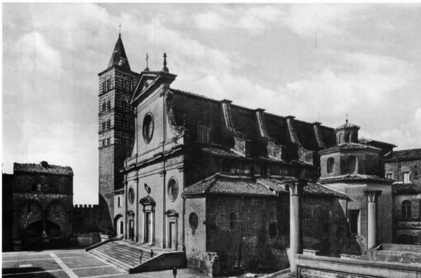
S. Lorenzo, Cattedrale di Viterbo.