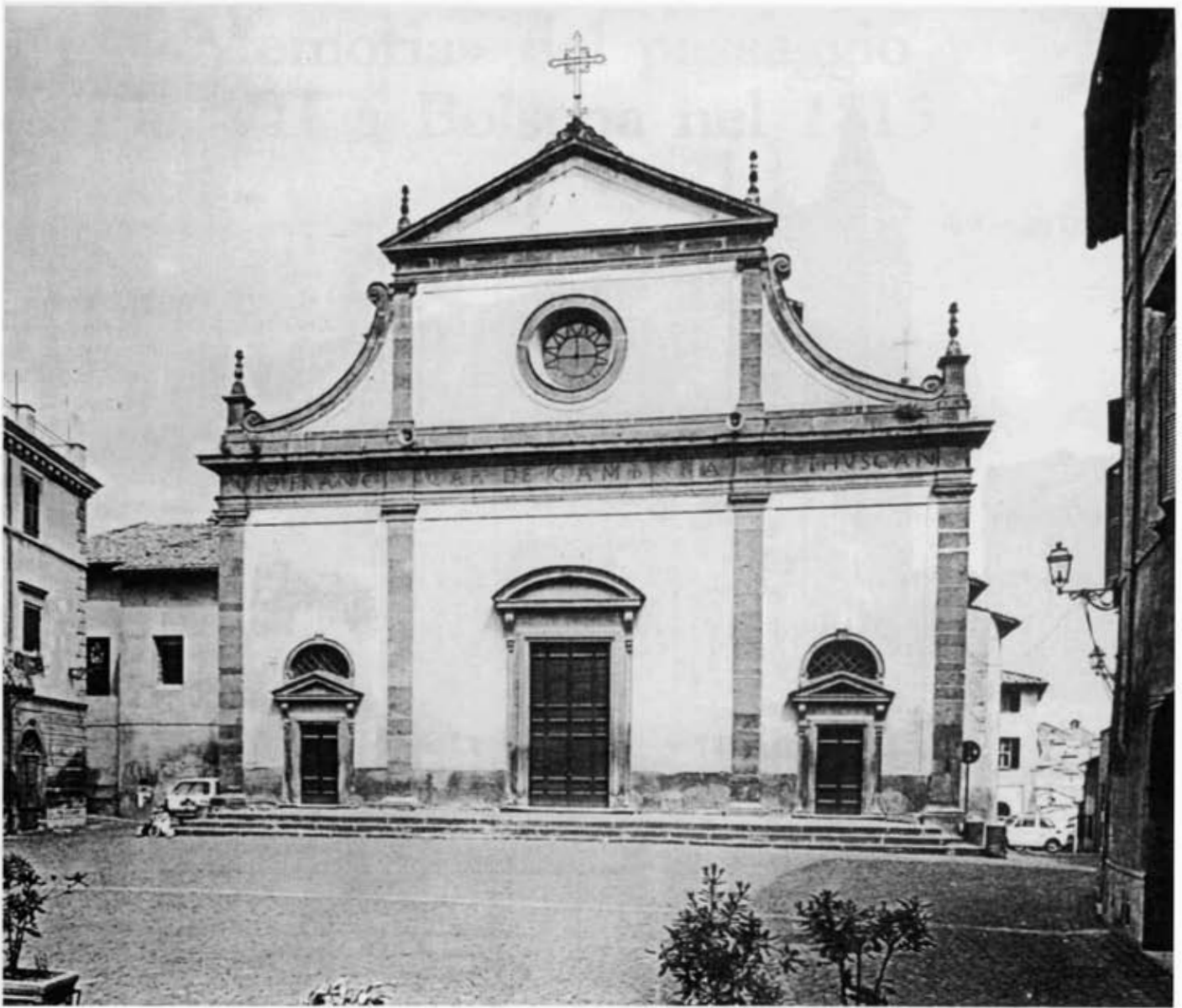
San Giacomo (duomo) - Facciata.

I vescovi titolari delle altre diocesi soppresse sono: Acquapendente (dal 22 giugno 1991) mons. Jan Styrna, ausiliare di Tarnòw (Polonia).