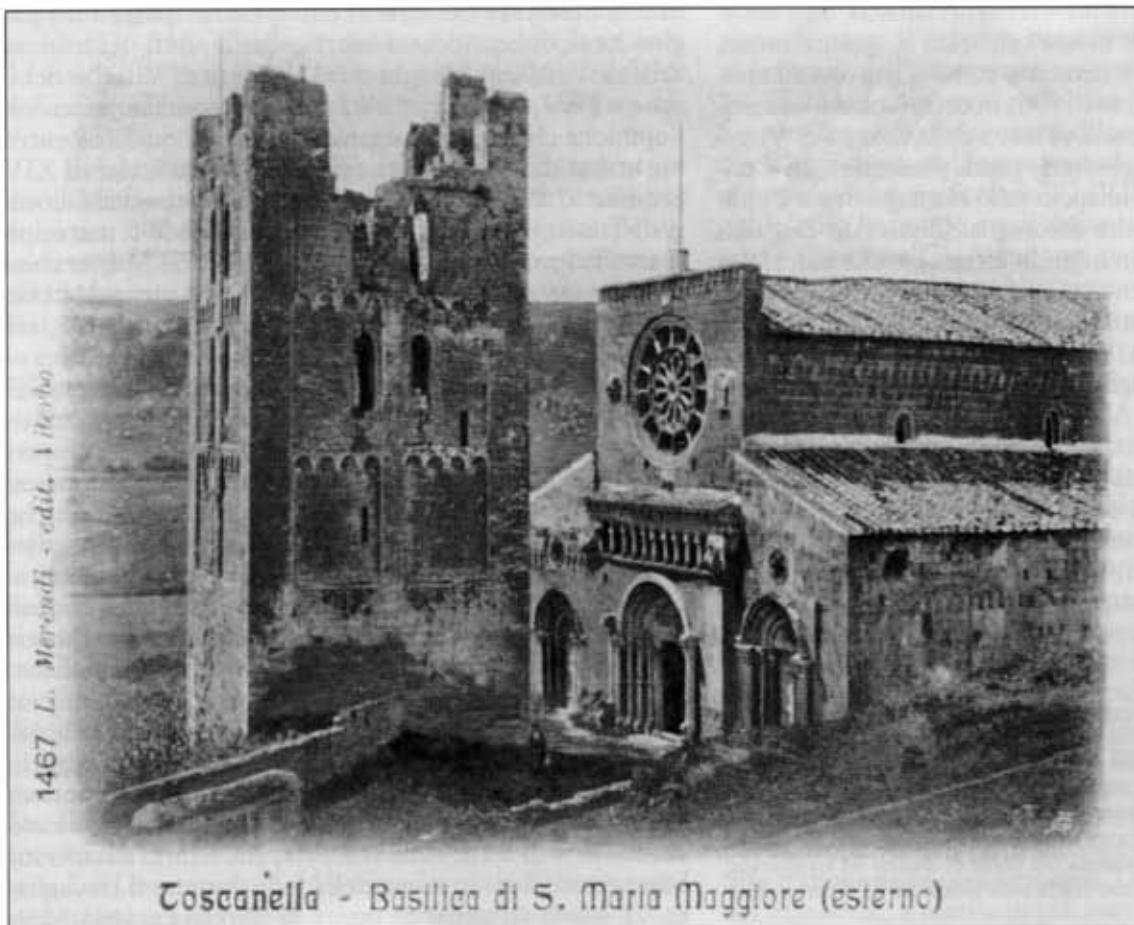
Basilica di S. Maria Maggiore, prima Cattedrale di Tuscania

Se l'VIII centenario riguarda soltanto un centro abitato, nella fattispecie la città di Viterbo, va benissimo: i Viterbesi (o meglio, alcuni Viterbesi) sentono la necessità di commemorare l'VIII centenario della elevazione del loro centro da semplice castrum al rango di civitas e, successivamente, a sede vescovile unita ( specialiter unita , dice la bolla di Innocenzo III del 1207) a quella già esistente di