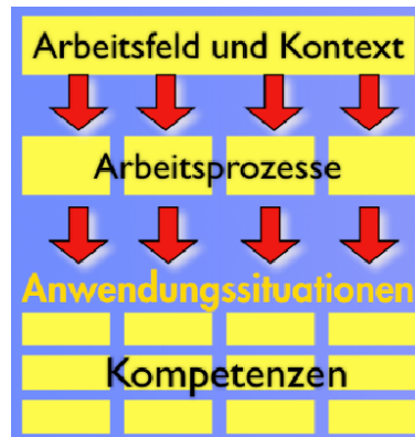
Abbildung: Aufbau Berufsprofil

Dem vorliegenden Rahmenlehrplan liegt der in der nachfolgenden Abbildung dargestellte Aufbau zu Grunde: