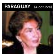
S. E. Blanca Zuccolillo Rodriguez Alcala