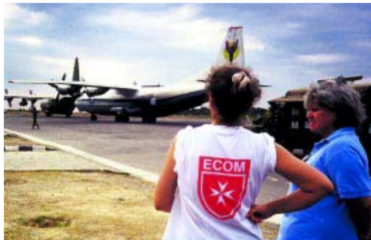
Aeropuerto de Dili, Timor Oriental. Llegada de la ayuda alimentaria urgente para los 300.000 refugiados que huyen de la guerra civil, bajo el control de un voluntario del Cuerpo de Emergencia de la Orden de Malta - ECOM.

La misión de los embajadores se centra en temas estrictamente humanitarios. Ahora bien, en los países donde no hay una Asociación Nacional, el embajador también se encarga de coordinar las actividades hospitalarias.