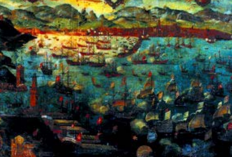
< Palma de Mallorca