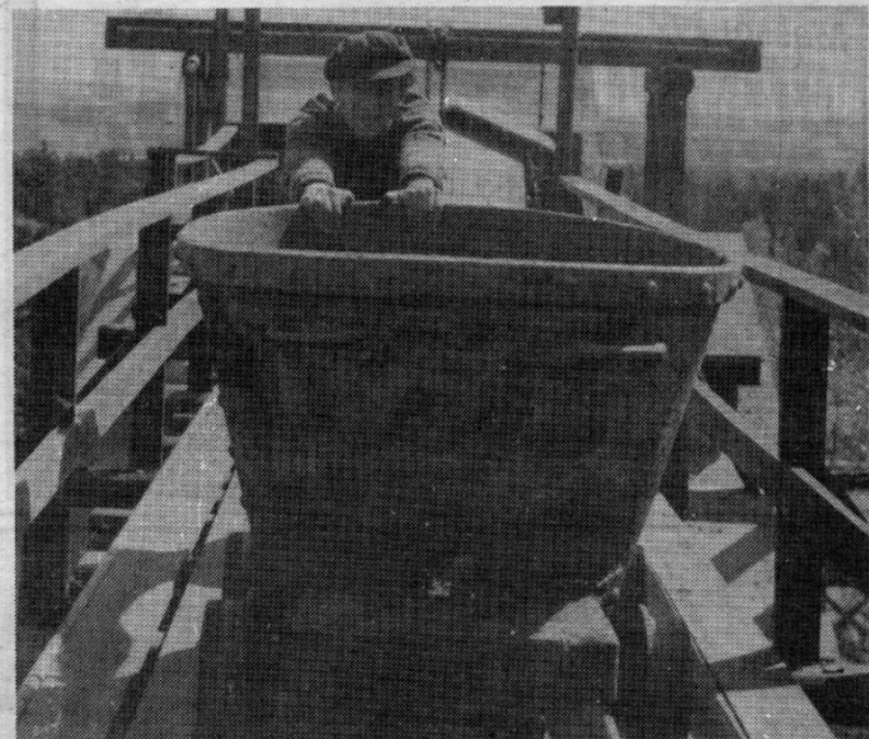
Även vid smågruvorna förekom uppföring under hela 1940-talet och en bra bit in på 1950-talet.