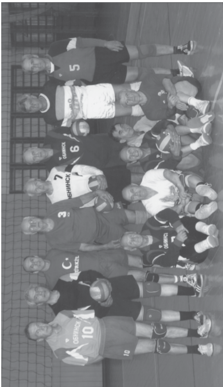
Обнинская команда ветеранов волейбола старшего возраста. Июнь 2004 г.