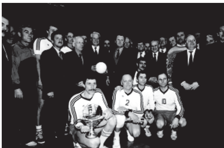
Победитель турнира ветеранов на кубок Первого Президента России сборная команда г. Москвы с Президентом Б.Н. Ельциным и ветеранами волейбола страны. 19 января 1992 г.