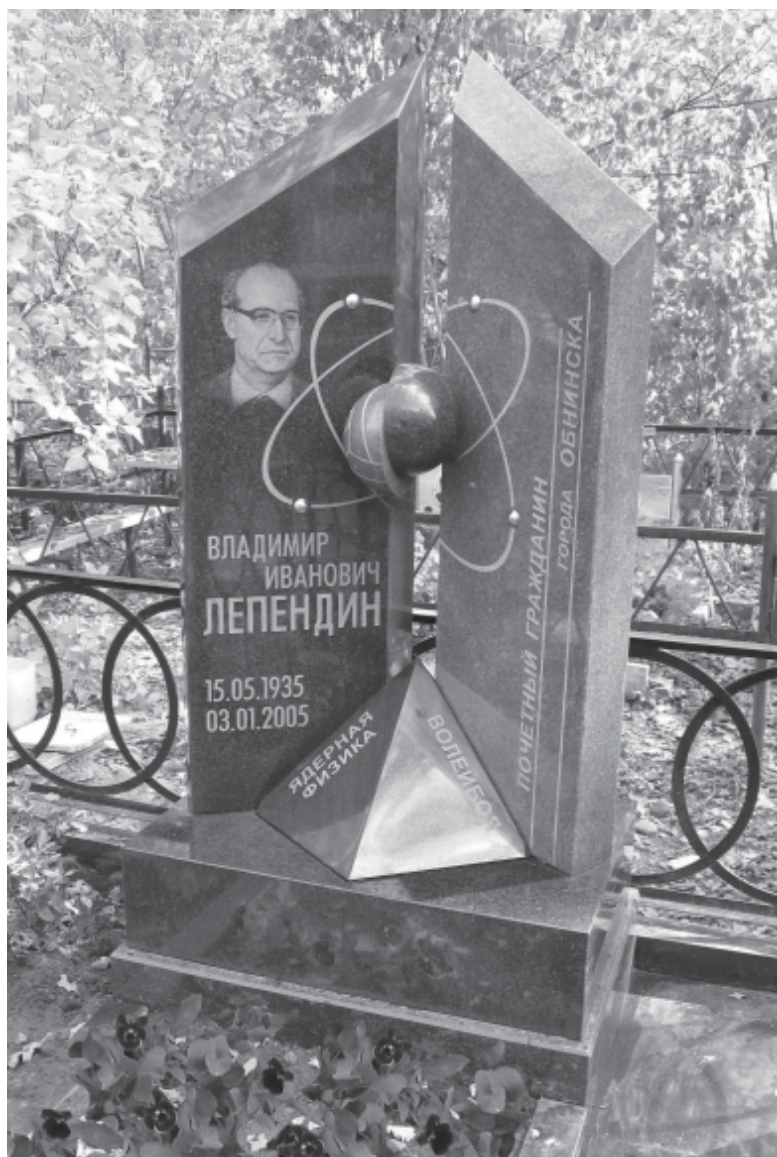
Памятник Владимиру Ивановичу Лепендину, установленный в г.Обнинске. Дизайнер: И.Б.Данилюк, исполнитель: ООО «Кварцит»