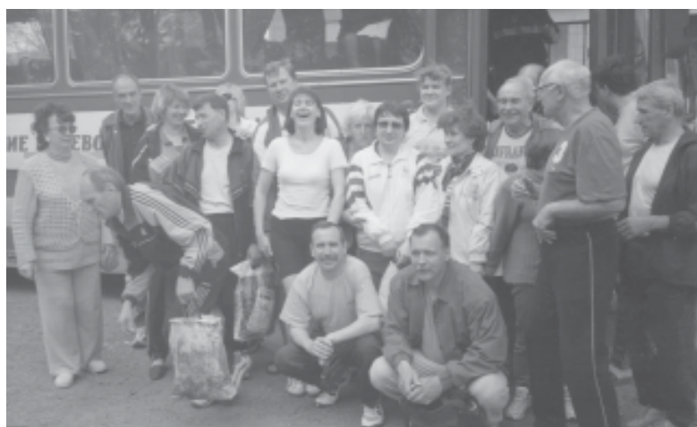
VIII турнир в Великих Хуторах. Команда Обнинска после банкета перед отъездом домой. Май 2002 г.