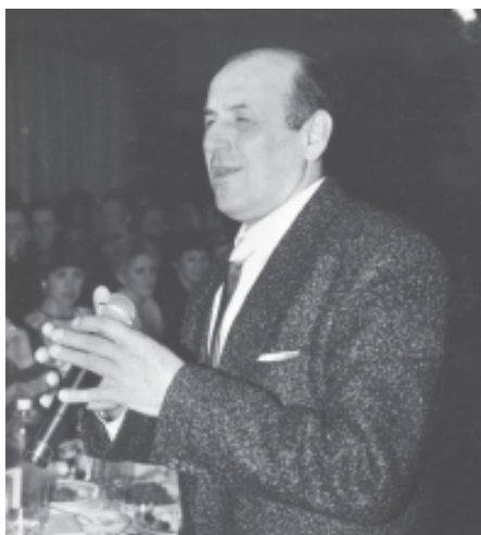
Народный артист Украины Николай Коваль на литературном вечере. Игрок волейбольной команды, г. Харьков.