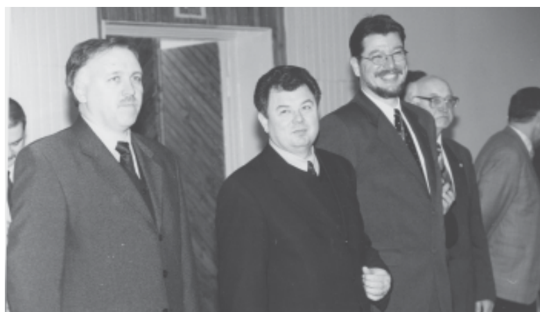
Парад XXIV турнира принимают мэр Обнинска Игорь Миронов, губернатор Калужской области Анатолий Артамонов, председатель Городского собрания Геннадий Артемьев. Обнинск, 2001 г.