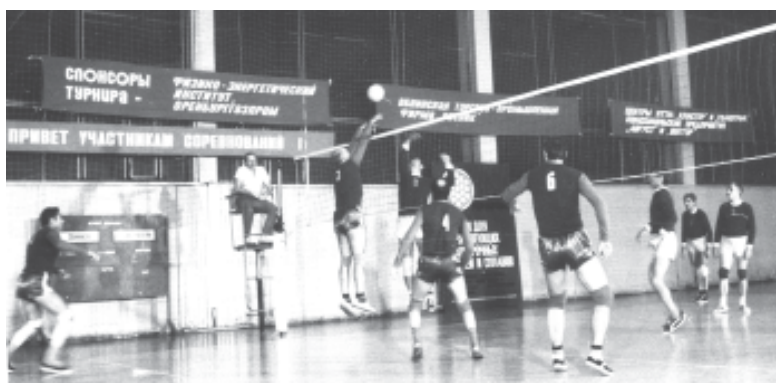
VI турнир. Играют команды Обнинска (слева) и Зеленограда (справа)