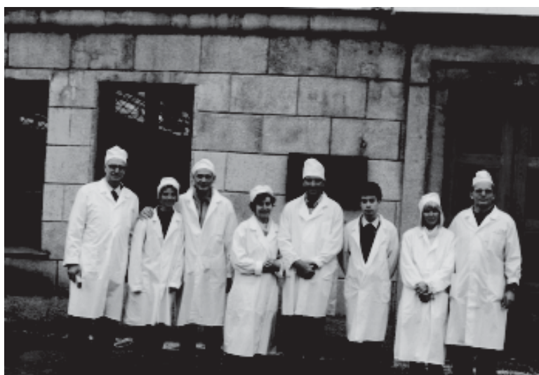
Немецкие волейболисты на Первой в мире АЭС