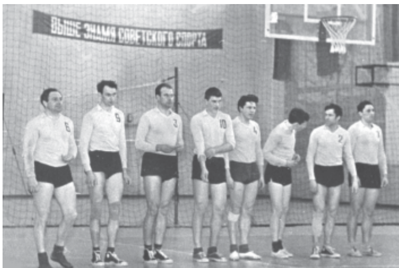
Сборная ФЭИ образца 60-х годов