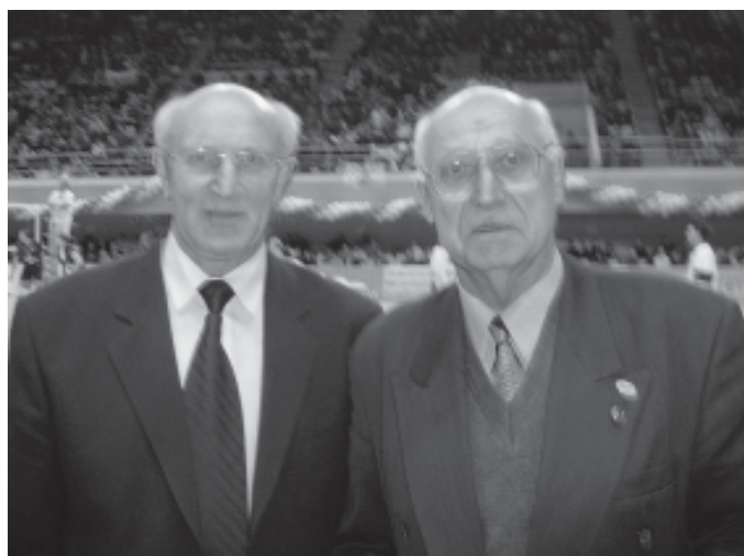
Два «брата» – президент ВФВ Валентин Жуков и президент СВВР Владимир Лепендин на Кубке России-2003