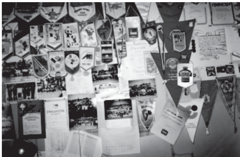
История ветеранского волейбола в выпелах (кабинет В.И.. Лепендина)