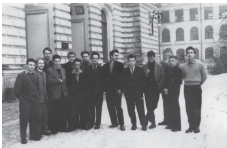
Выпускники ЛПИ, группа 557-б, 1958 г.