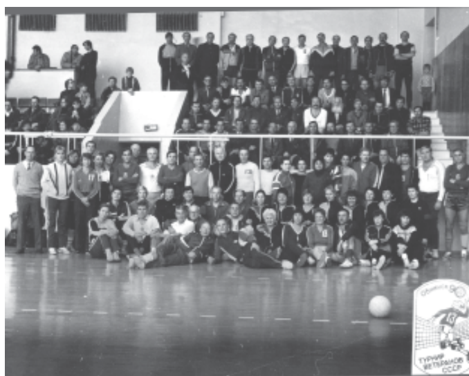
После парада открытия