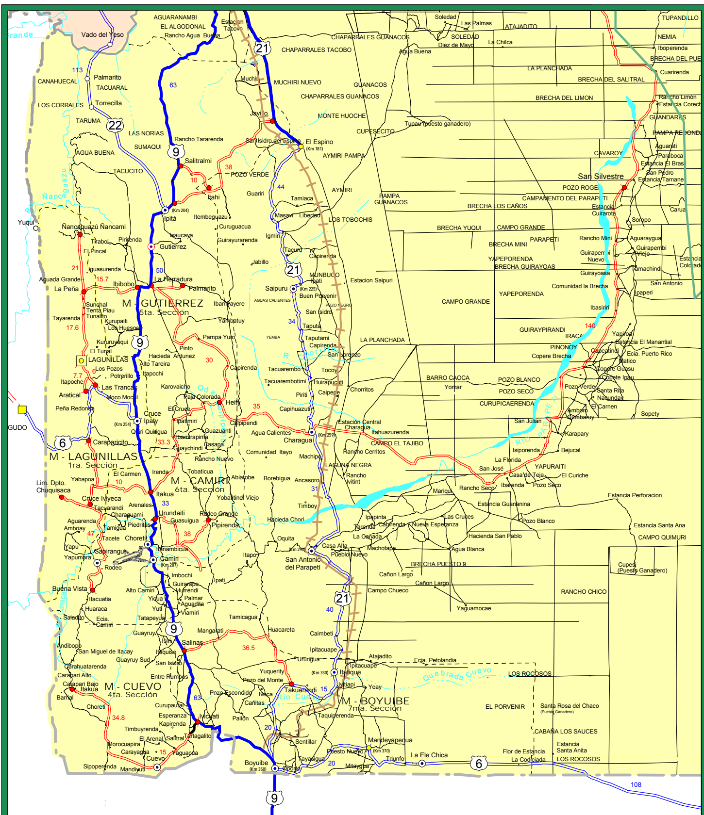
Mapa Vial Departamental : P(15) Provincia : Cordillera Sur (3/4)