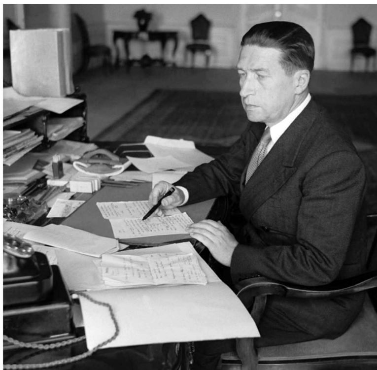
Prokop Drtina ve své pracovně

„Pane doktore Drtino, já vám říkám, vy skončíte jako van der Lubbe...“ vmetl koncem listopadu 1947 po objevení krčmářské stopy zářijový pokus o atentát na tři ministry rozčilený Klement Gottwald do tváře tehdejšího ministra spravedlnosti, Judr. Prokopa Drtiny. Komunistický premiér tak chtěl zastavit další vyšetřování. Vyhrůžka byla pronesena v přítomnosti Drtinova resortního předchůdce, prof. Jusr Jaroslav Stránského. A právě ten Gottwalda pohotově překvapil: „Pane ministerský předsedo, co to říkáte!? Kdopak by potom byl tím Göringem? Nosek?! Ano?!“