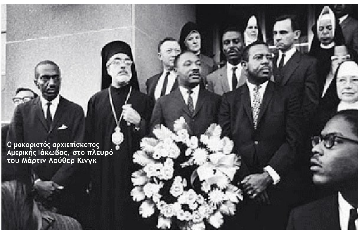
Ο μακαριστός αρχιεπίσκοπος Αμερικής Ιάκωβος, στο πλευρό του Μάρτιν Λούθερ Κινγκ

20 Ιανουαρίου 2014: "Εθνική ημέρα", αργία στις ΗΠΑ... Μνήμη Μάρτιν Λούθερ Κινγκ (αφιέρωμα, σελ. 10-11)