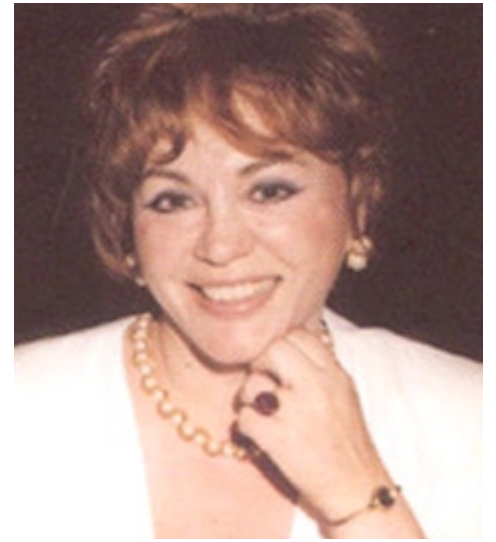
Σημ. συντ.: 'Αρθρο της, σχετικό με τις κακουχίες των πρώτων Ελλήνων μεταναστών στις ΗΠΑ (1900-1920), δημοσιεύουμε στην σελίδα 8.