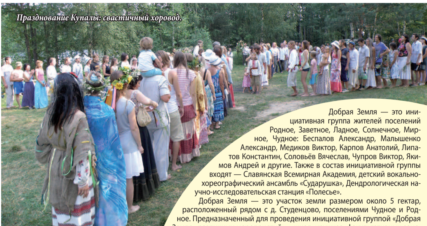
Празднование Купалы: свастичный хоровод.

строения, как сердце ликует и радуется от звуков песен любимых светлых бардов. И было очень хорошо, по словам многих, что музыка ненавязчиво окружает тебя повсюду, не отвлекая от общения или других дел. Лично мне душевные, проникновенные песни очень помогли в работе с людьми.