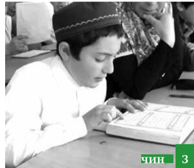
Чешне къачудайбур жеда