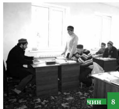
Хъсан муаллим жагъурай къайда!