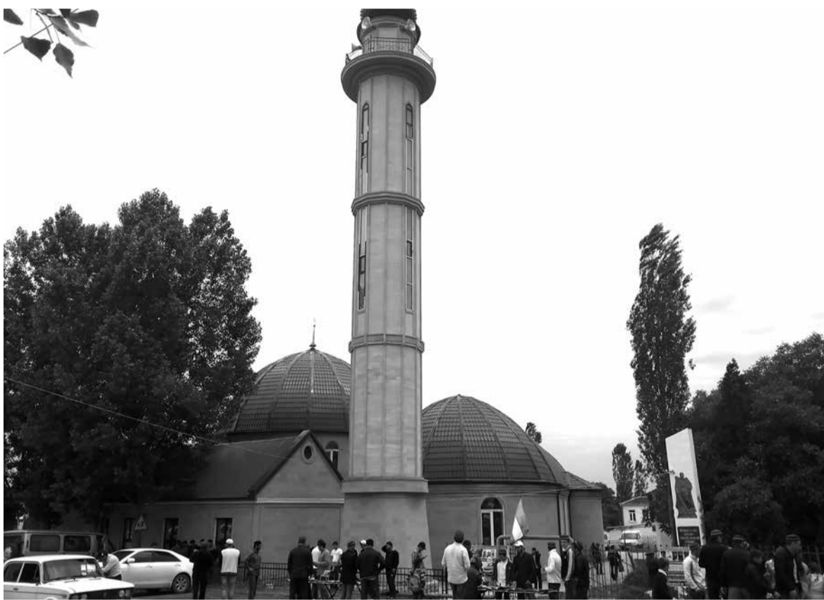
Ярагъ-Къазмайрал ачухнавай цІийи мискІин