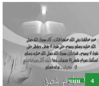
Пайгъамбардин ﷺ варз