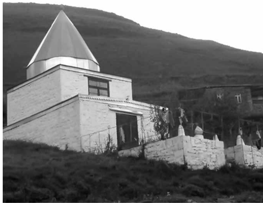
Куьрагъ райондин Усарин хуьре авай шейх Мугъаммадан зиярат

Мугъаммад 1838-йисуз регъметдиз фена, ам Согратлда кучудна. Еке гуьмбет алай адан сур гилани къуд патай мусурманар зияратдиз къведай чка я. Вичиз Аллагьди рагъмет гурай. Шейх Жамалудиназни гъаф муьридар хъана. Куьрагъ райондин Усарин хуьрйай тир Куьре патал машгъур, дерин чирвилер авай, Шамилан наиб, бажарагълу алим Мугъаммадни. Абурукай сад хъана. Ам Жамалудин шейхдин лап бажарагълу муьрид тир. Шейхди Тарикъатдай адан дережа хкажна ва изин гана. 1861-йисуз Жамалудин шейх Туьркиядиз куьч жедайла, Мугъаммад-эфендидиз изин гана. И къайдада Усар тир Мугъаммад-эфенди жезва Дагъустандин пуд лагъай муршид. И кар тастикъарзава Жамалудин шейхди кхьенвай чарчи. Дяве куьтыгъ хъана, шейх Мугъаммад гъаждал физ гъазур жезва. А чар шейх Мугъаммада вич гъаждал