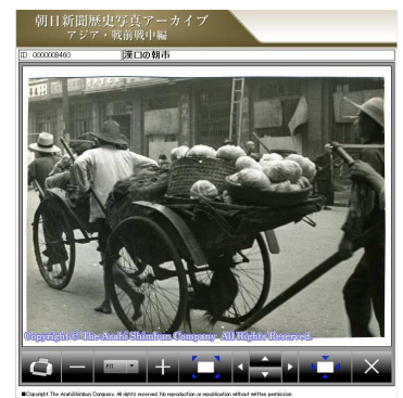
(拡大画像例:漢口の朝市)

http://www.asahi.com/information/db/history_photo/