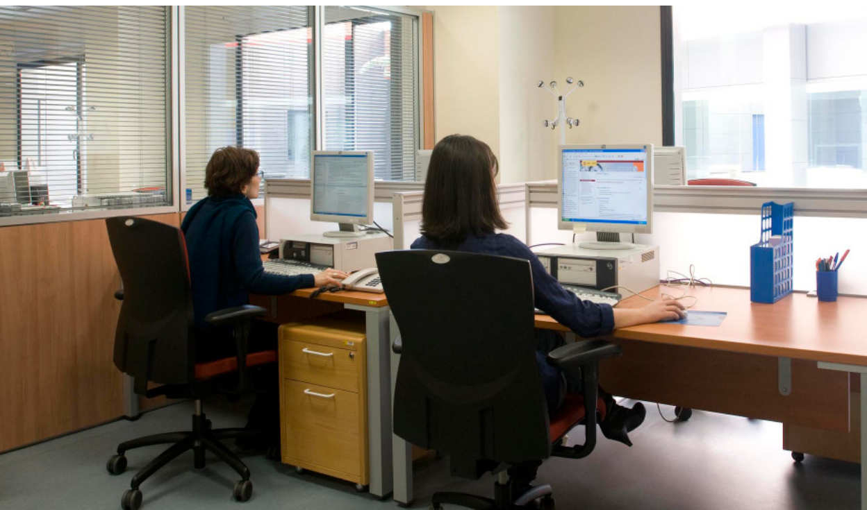
Fig. 13 Sala de trabajo del personal técnico.