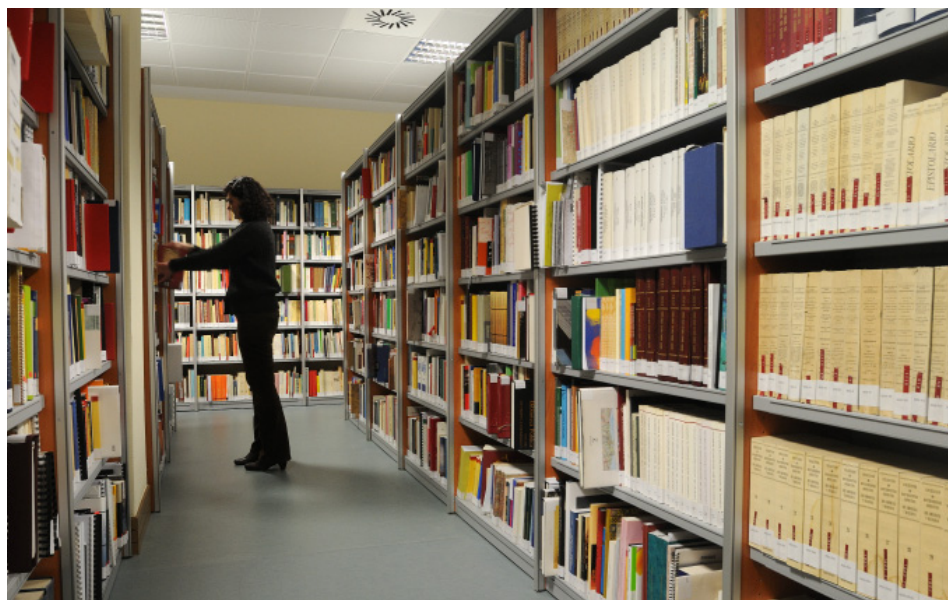
Fig. 8 Depósito de la colección bibliográfica.