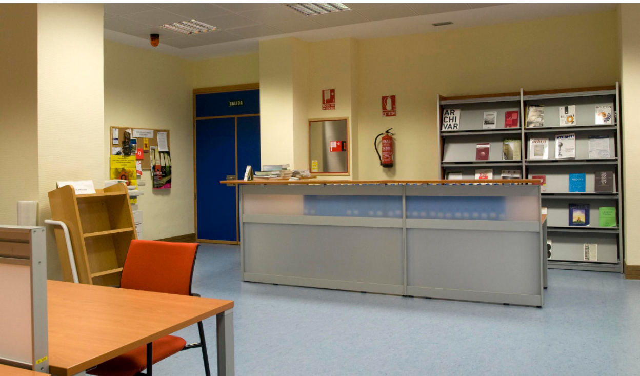
Fig. 7 Mostrador de recepción de la biblioteca.