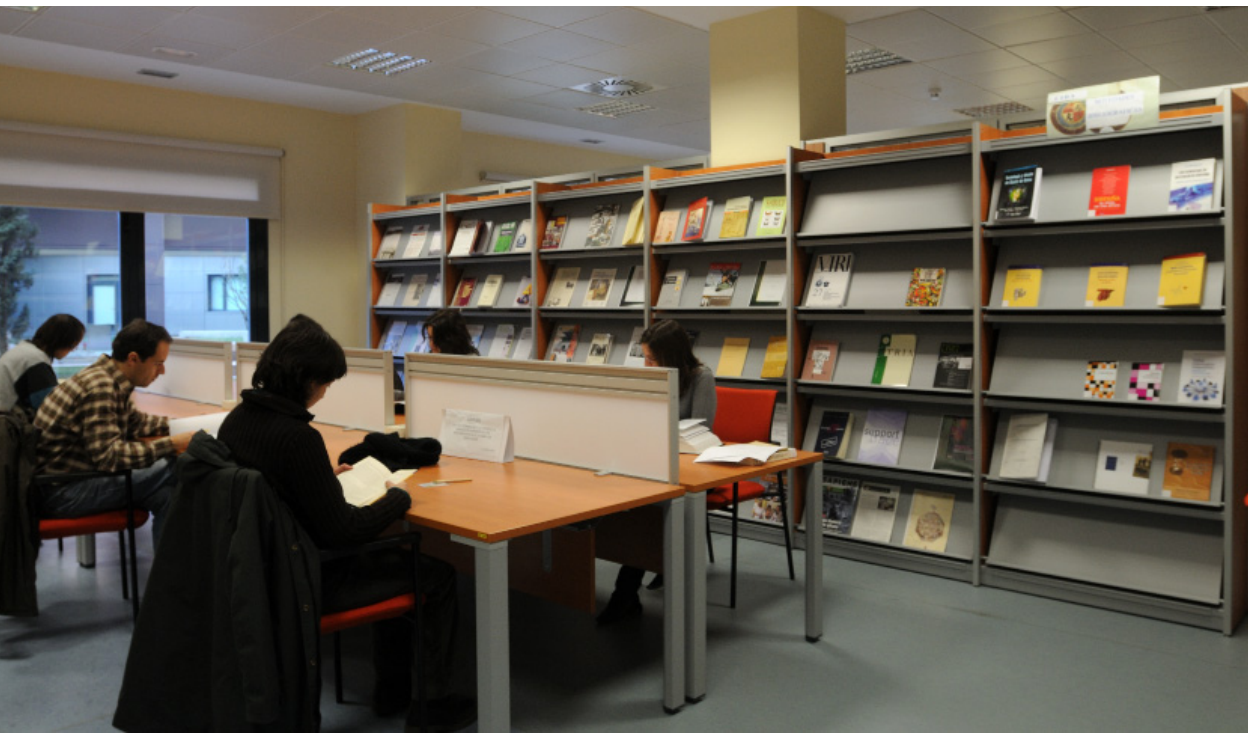
Fig. 1 Sala de atención al público del Centro.