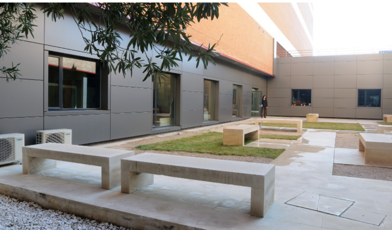
Fig. 2 Vista exterior del Centro.