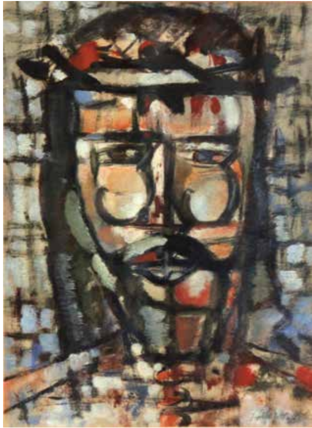
Crist . Oli sobre paper. 33 x 24 cm. 1958