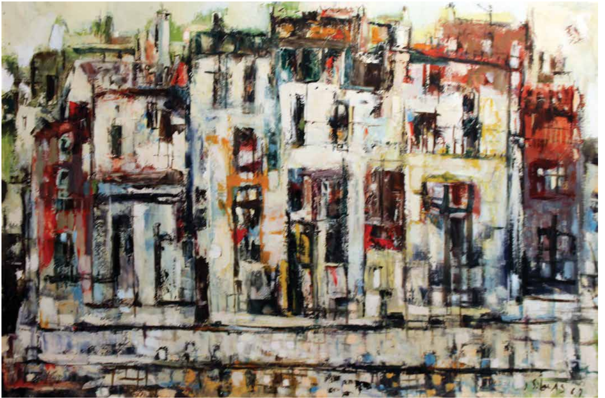
Façana . Oli sobre tela. 53 x 80 cm. 1967