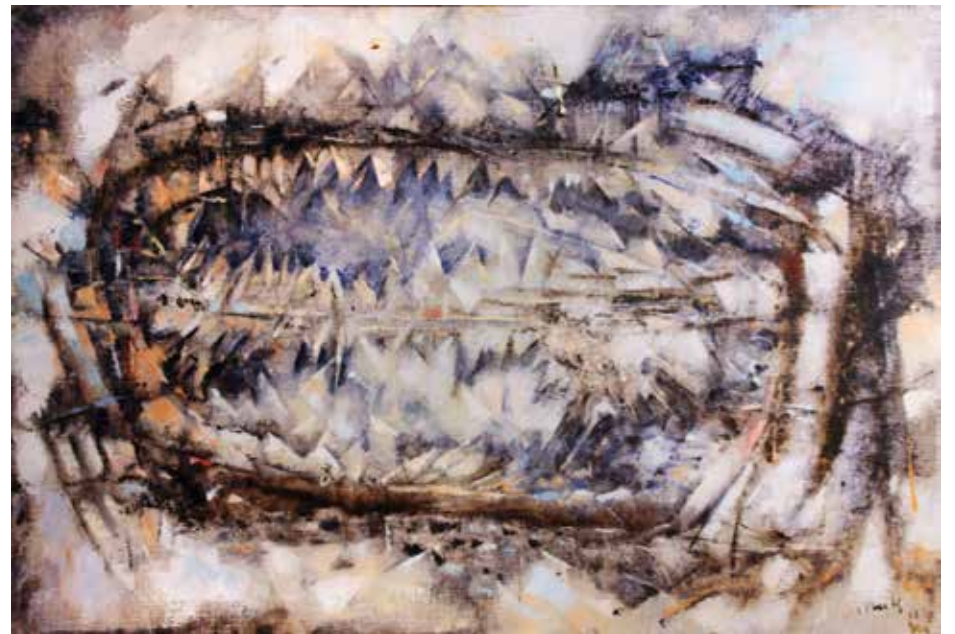
Abstracció. Oli sobre tela. 50 x 73 cm. 1968