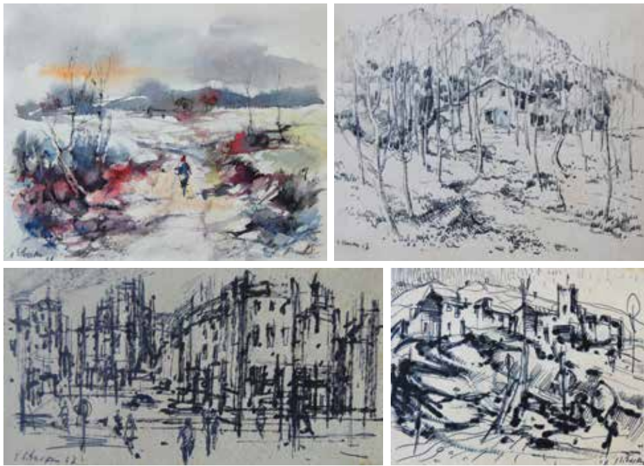
Bloc d'apunts de camp. 12 x 18 cm. 1967