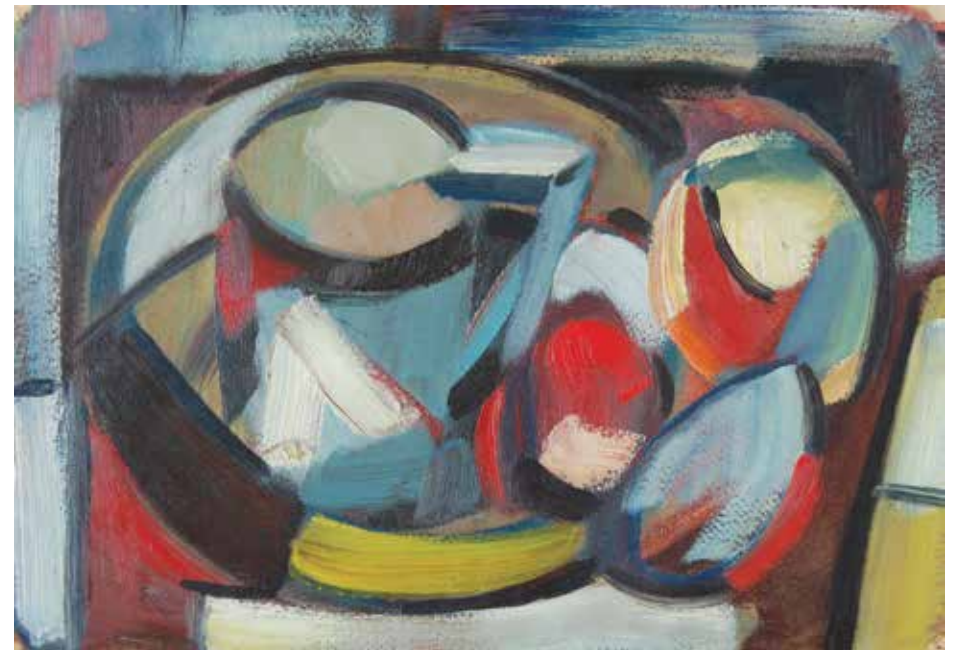
Esbòs. Oli sobre cartró. 22 x 32 cm.

La seva vida ve marcada d'un bon principi per dos fets primordials: ser l'hereu d'una nissaga de pagesos benestants del Mas Sibecas, i un accident fortuït als 10 anys que li fa perdre un ull. L'artista ha de vèncer ambdues dificultats per seguir els dictats del seu cor.