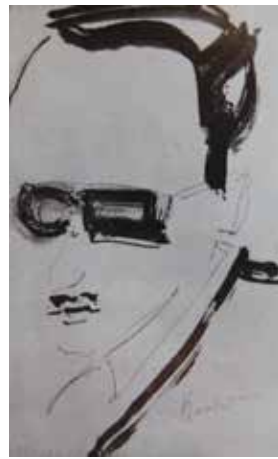
Sibecas per Kurakin. Tinta sobre paper.