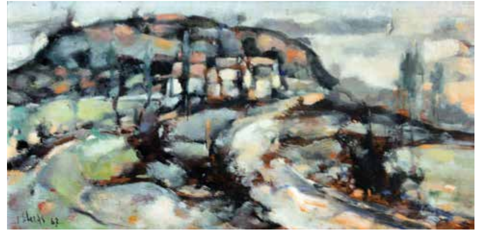
Camí cubista . Oli sobre fusta. 23,5 x 47,5 cm. 1967

l'àmbit de la representació (el de l'art) imatge real o acadèmica. Però no debades L'Empordà és una terra, aleshores, federal (que té altres conceptes possibles d'organització i d'ordenació del territori) i com que la realitat és que Vilanant i/o Avinyonet estan prop de Figueres i aquesta vila prop de França, una altra possibilitat no només de parlar lliurement sinó també d'endegar la realitat-entorn; el noi que se sent pintor decideix, per inquietud, pel que sent dir i per necessitat de cultura amb deus pròpies, informar-se del que fan els inquiets com ell a altres indrets. I sap que hi ha pleinairistes , impressionistes, surrealistes i, més prop d'ell en intenció, sensibilitat i afinitats, cézannistes. Especialment aquests els troba molt d'acord amb la seva de sensibilitat i visió personal de l'entorn; Cézanne ha dit que pintar és construir la realitat amb els colors i conseqüents formes que notes enfront teu, que sents per i des de les pròpies sensacions.