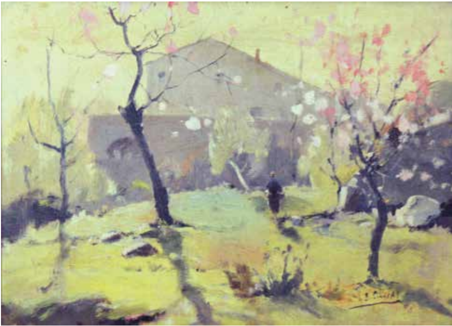
Ametllers. Oli sobre fusta. 22 x 30 cm. 1953