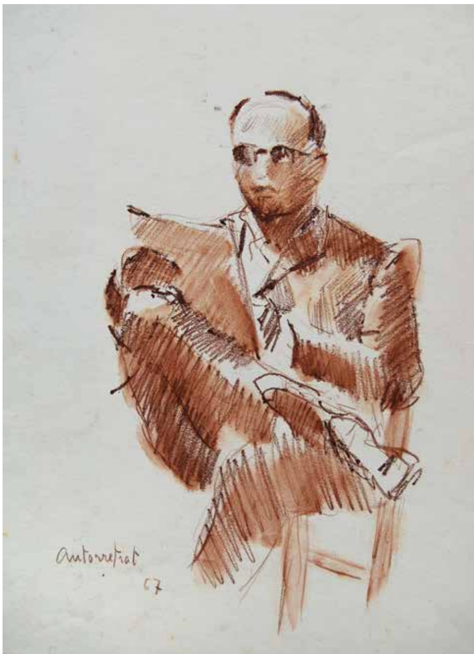
Autorretrat. Sanguina. 1967