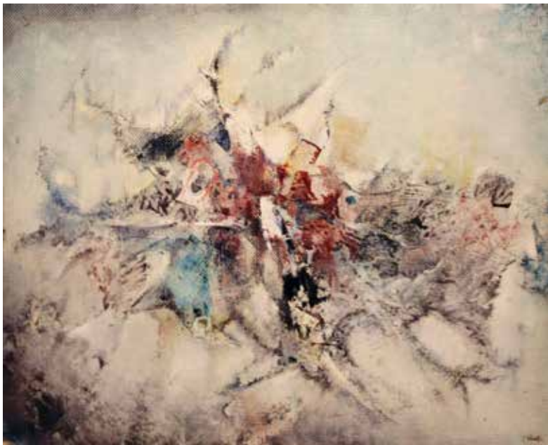
Abstracció. Oli sobre fusta. 42 x 51 cm. 1963