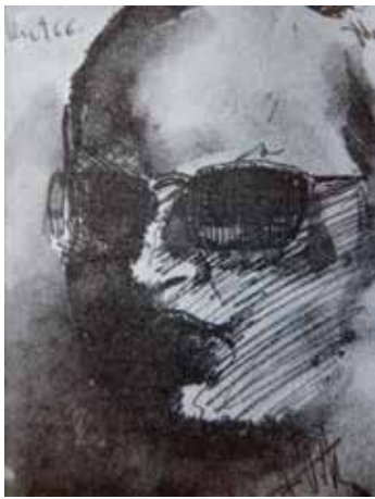
Sibecas per Felip Vilà. Tinta sobre paper.