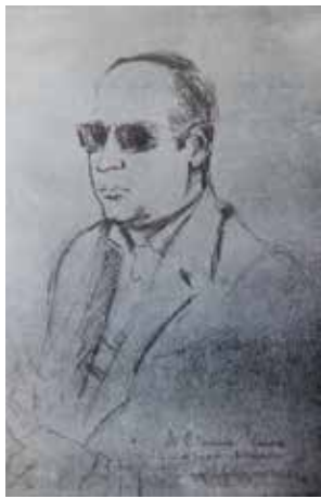
Sibecas per Santos Torroella. Tinta sobre paper.