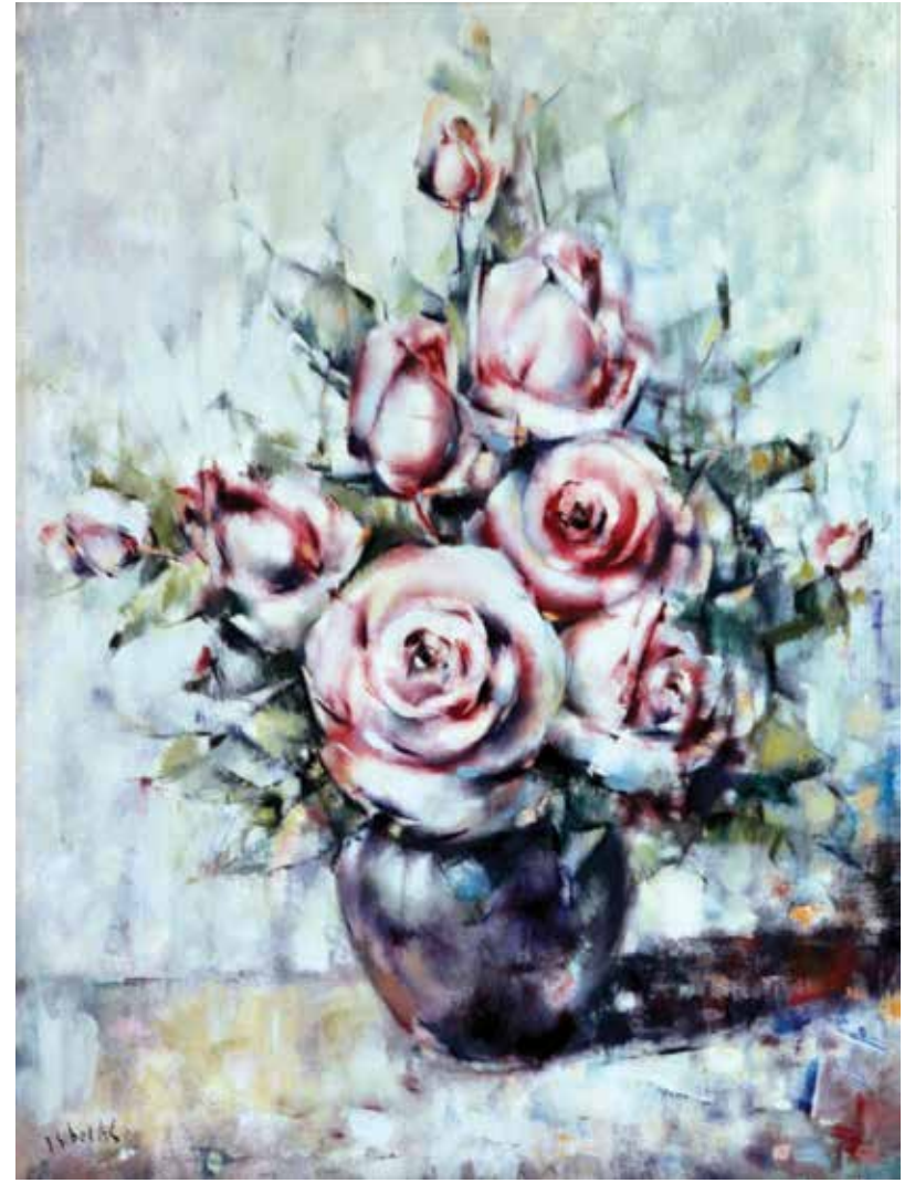
Roses. Oli sobre tela. 60,5 x 45,5 cm. 1968

posteriorment, al gravat, tots els elements estructurals i estructurants de l'entorn natural que la seva sensualitat sensible i el seu raonar – des de la sensibilitat, també – li indiquen ofereix aquella realitat que ell té necessitat de construir i mostrar. Els seus amics li'n donaran la raó en observar el que en Sibecas plasma.