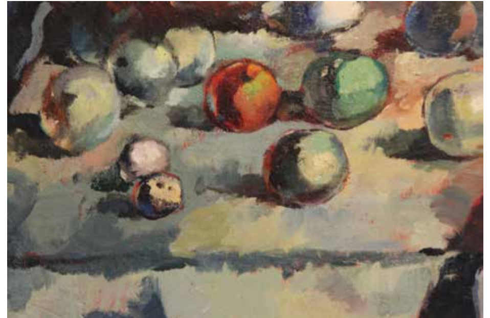
Natura morta (detall). Oli sobre fusta. 82 x 95 cm. 1964