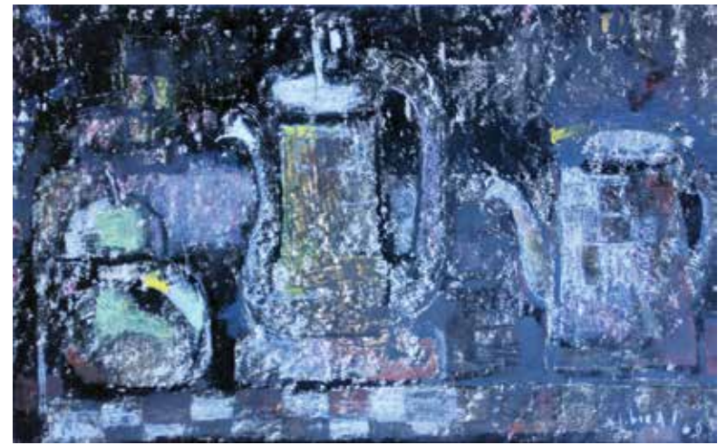
Natura morta. Cera sobre paper o cartolina. 29 x 46 cm. 1963