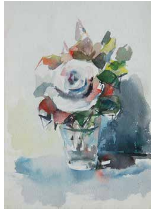
Vas i rosa. Aquarel·la. 25 x 16 cm. 1956