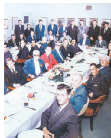
►► La reunión de invitados del Masters 1964.