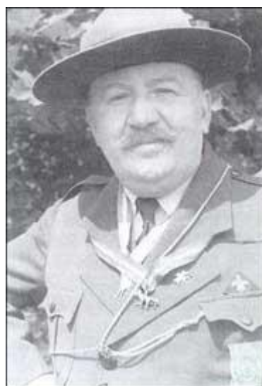
(Papa) Emmerich Teuber, zakladatel rakouského skautingu