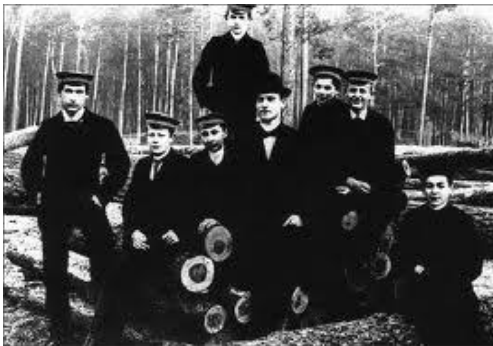
Předchůdci Wandervogelů – stenografický kroužek H. Hoffmanna gymnázia ve Steglitzu r. 1896/97