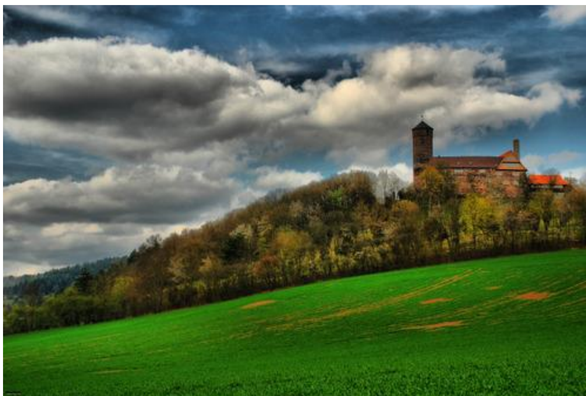
Hrad Ludwigstein v Hessensku – památník a archiv německého „Hnutí mládeže“