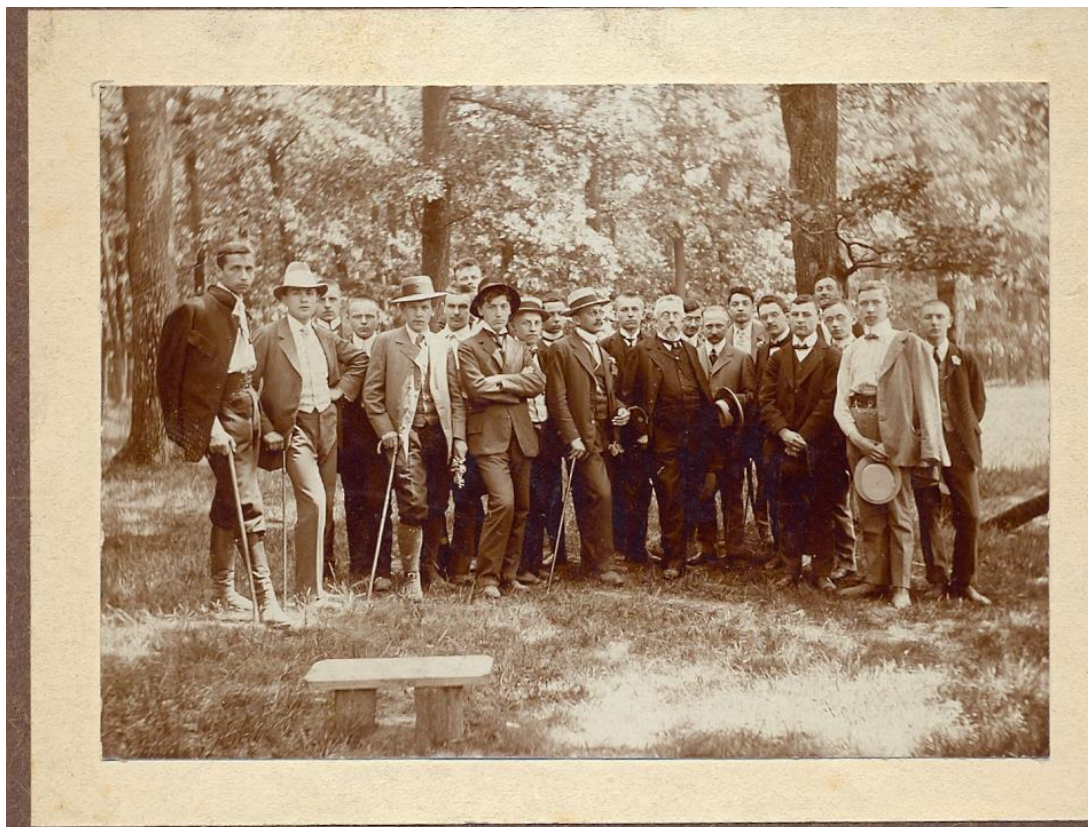
Výlet septimy C. k. reálného gymnasia na Smíchově do Poděbrad r. 1909