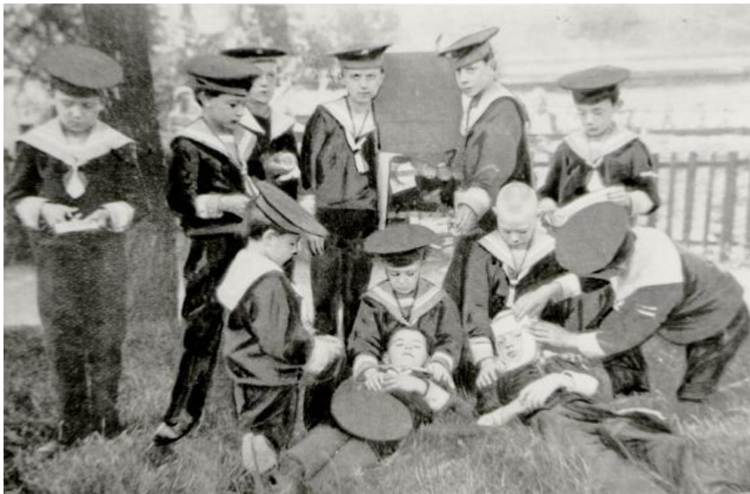
Skupina vídeňských Knabenhorte při zdravotním cvičení