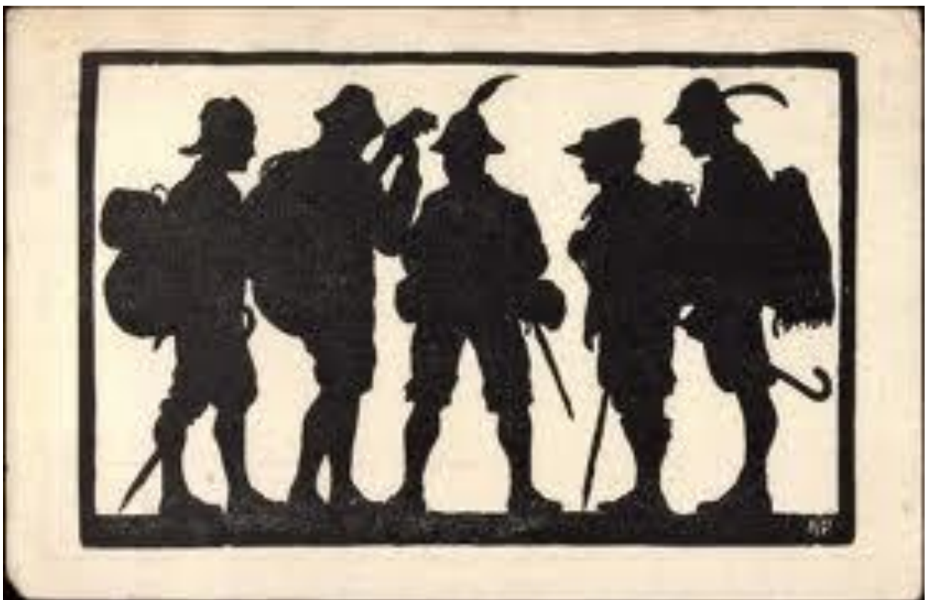
Obrázek 5 Wandervogelů ak. malíře H. Pfeiffera v kronice jihlavských Wandervogelů