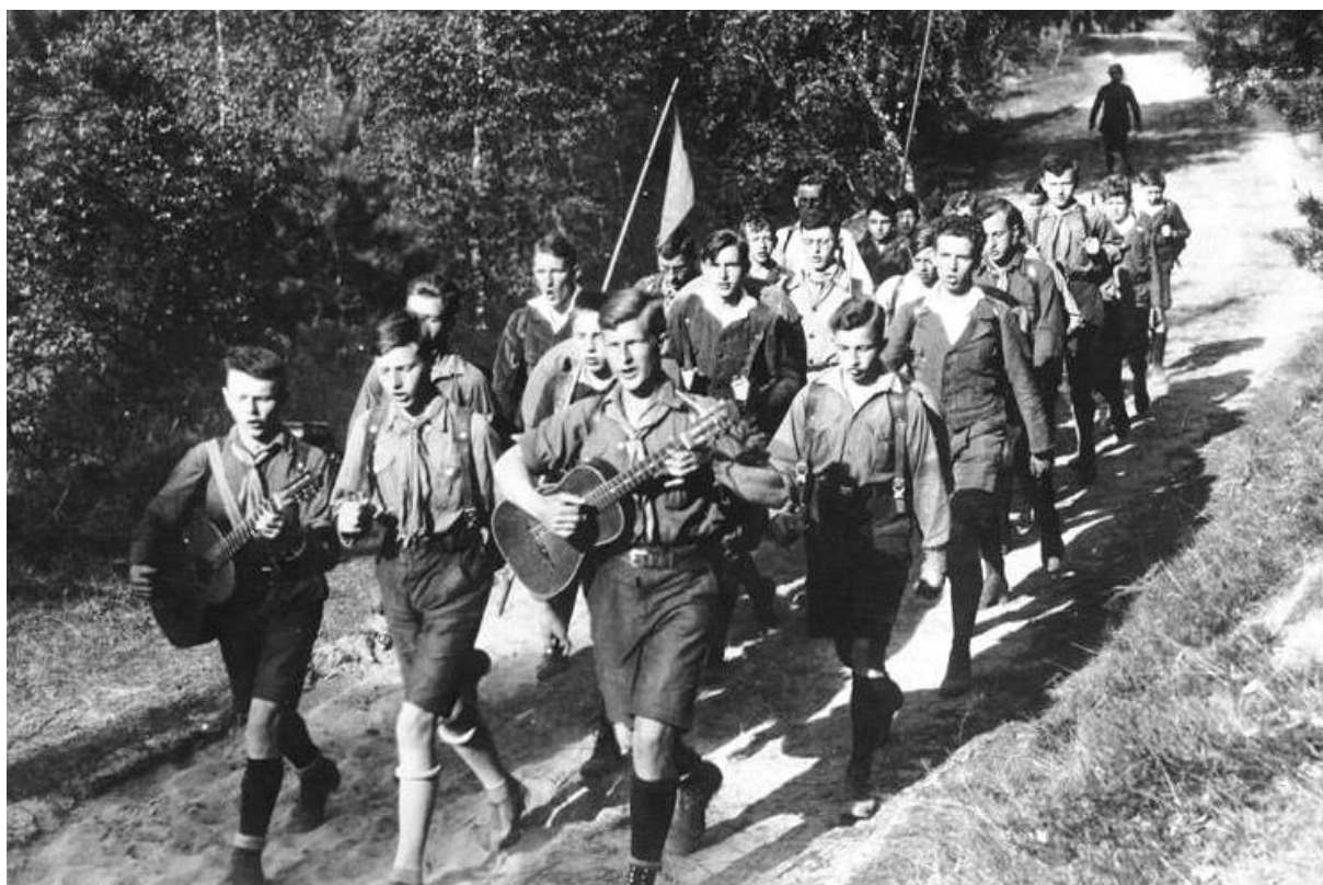
Skupina Wandervogelů z Berlína r. 1930