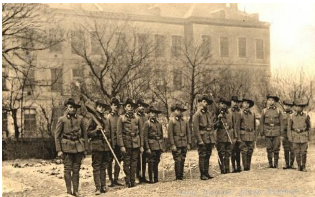
Vídeňský skautský oddíl na zahradě prvního skautského domu ve Vídni, Apostelgasse 9