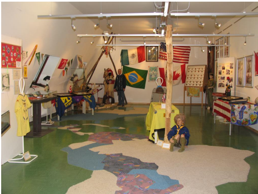
Expozice skautského muzea ve Vídni