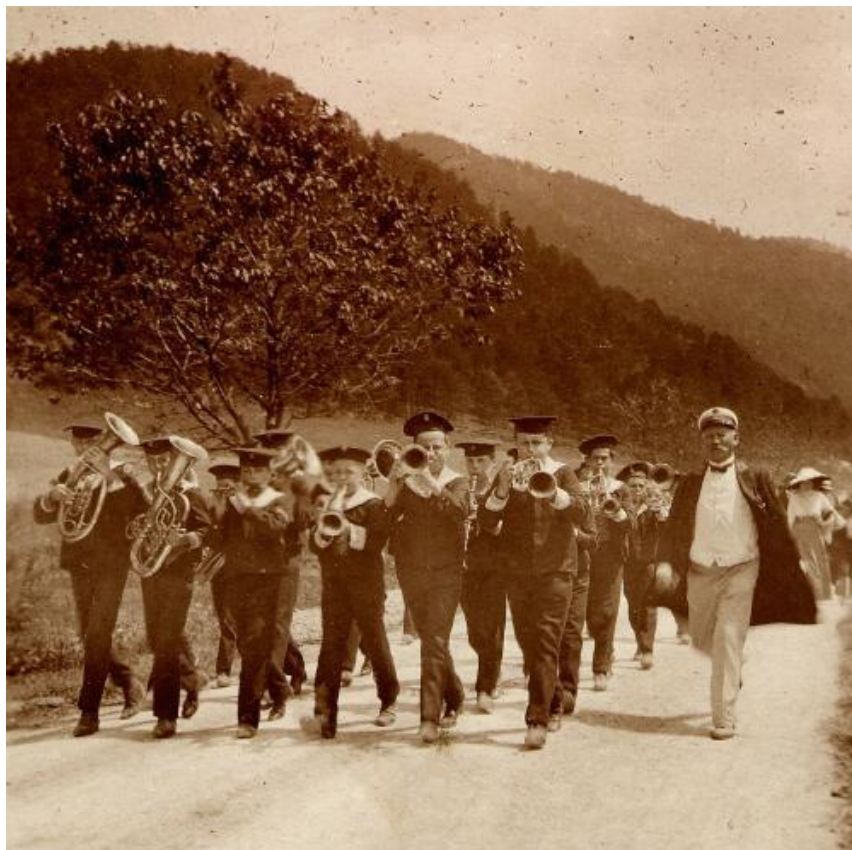
Skupina Knabenhorte na pochodu