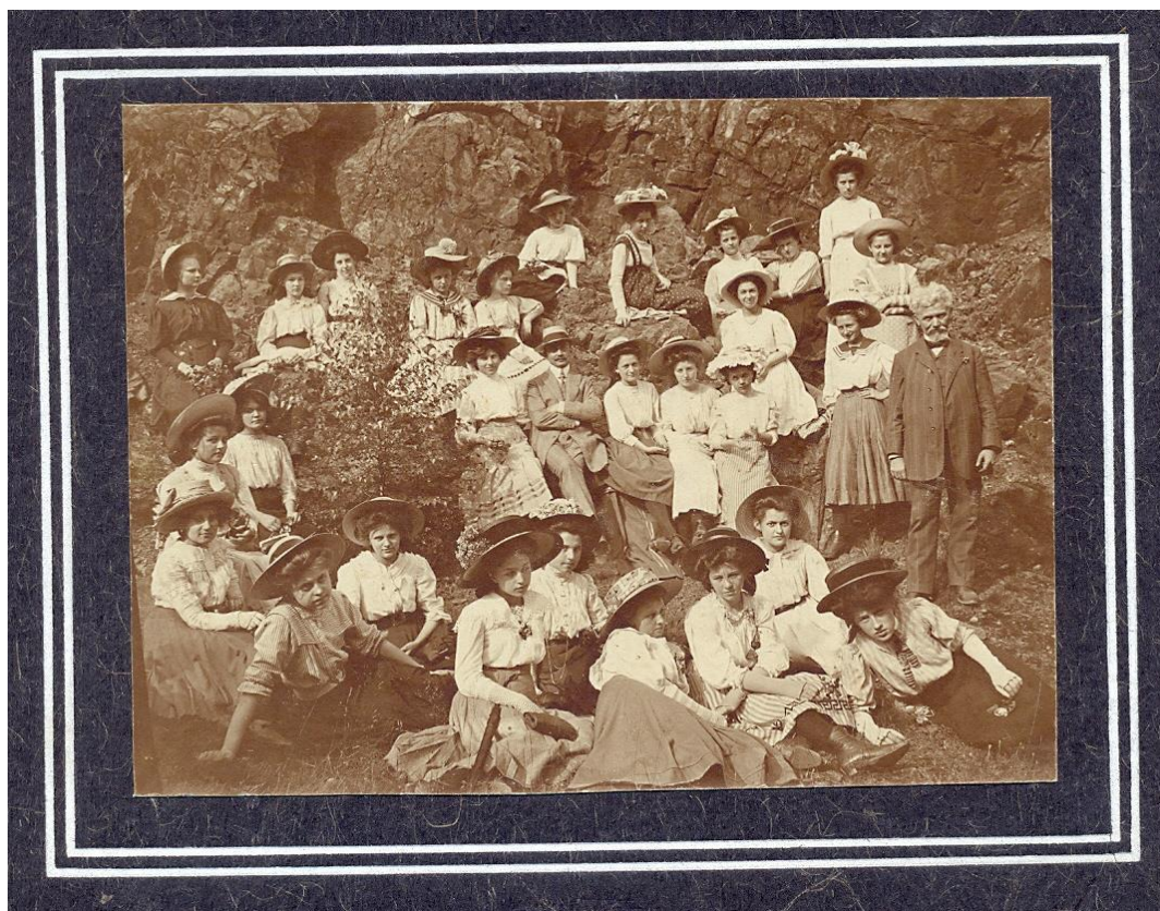
Výlet dívčí třídy do přírody r. 1909 (zřejmě třída měšťanské školy na Smíchově)