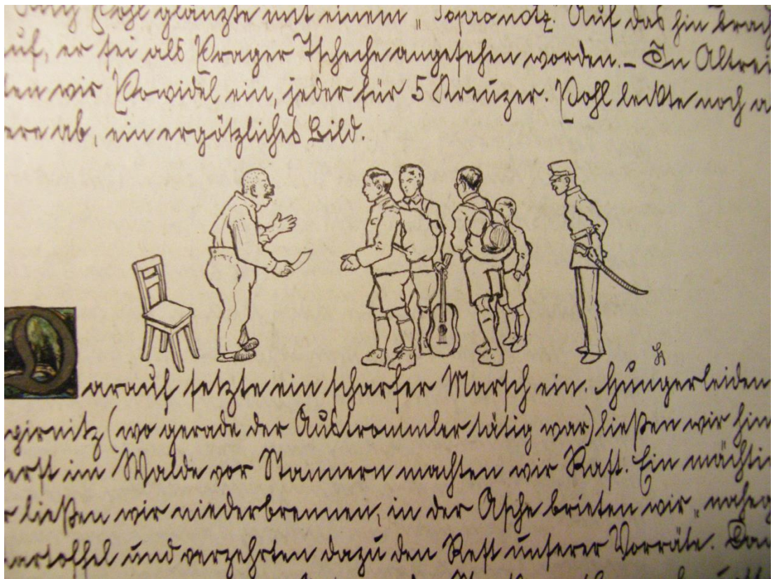
Ilustrace z kroniky jihlavských Wandervogelů