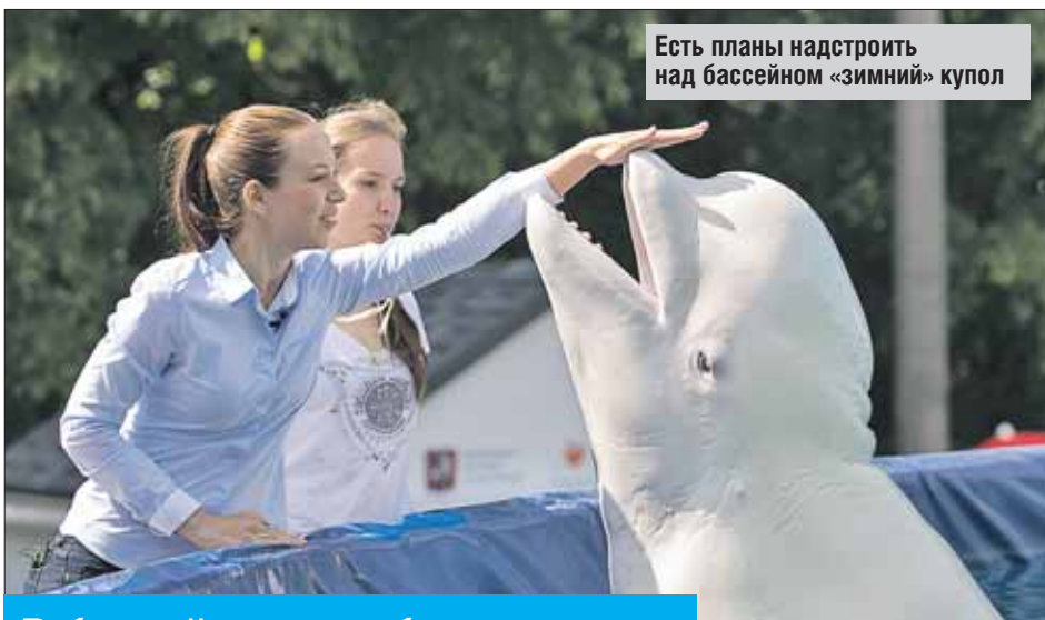
Есть планы надстроить над бассейном «зимний» купол