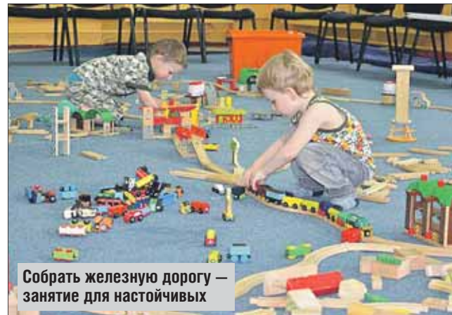
Собрать железную дорогу — занятие для настойчивых

Большая часть секций в центре бесплатные, стоимость же платных кружков в месяц составляет в сред-