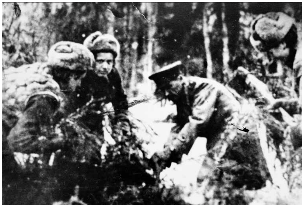
На строительстве того самого «лесного» госпиталя под Вязьмой

быстро освоили двуручные пилы и топоры, сами таскали брёвна. Конечно, мы ничего бы не сумели сделать без мужчин. Нам разрешили использовать бригаду выздоравливающих; к счастью, там оказались ребята — мастера на все руки. Жили мы в больших палатках: внутри трёхъярусные нары и печка из простой железной бочки, которую топили всю ночь. После работы скидывали сапоги и мыли затёкшие ноги в ручье, а потом босиком прямо по снегу бежали в палатку. И ведь никаких простуд не было!