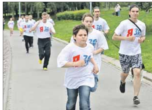
Бежали не за призы, а ради идеи

Профсоюзы округа хотят помочь развитию донорского движения