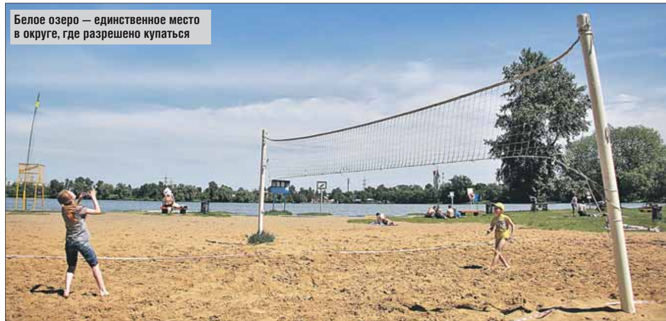
Белое озеро — единственное место в округе, где разрешено купаться