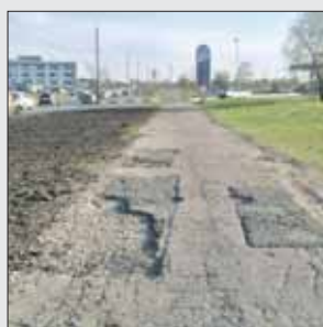
Так выглядел проезд между АЗС и перекрёстком с улицей Николая Старостина