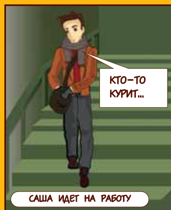
САША ИДЕТ НА РАБОТУ