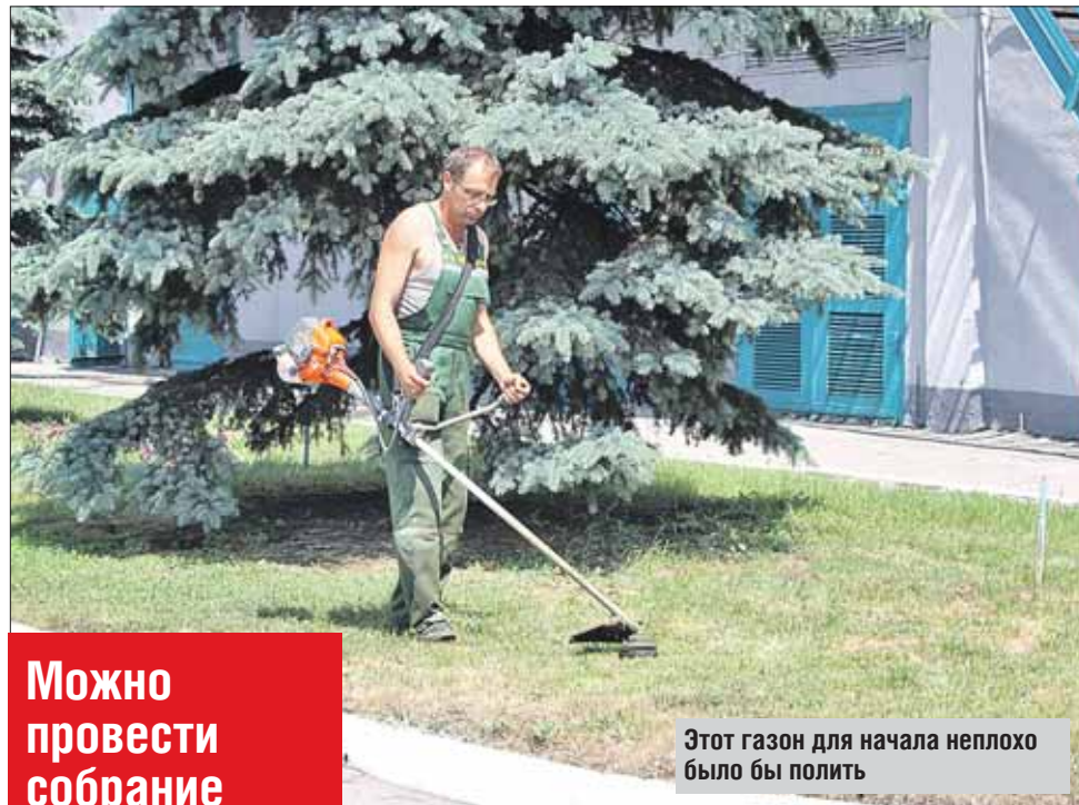
Этот газон для начала неплохо было бы полить

Во дворах, вокруг спортивных и детских площадок, под окнами домов, в межквартальных скверах осоковые травы (основной сорт газонной травы) растут не в одиночестве, а вместе с одуванчиком, подорожником, щавелем,