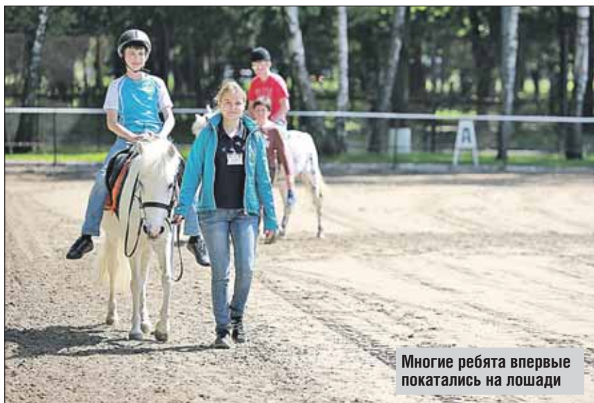
Многие ребята впервые покатались на лошади