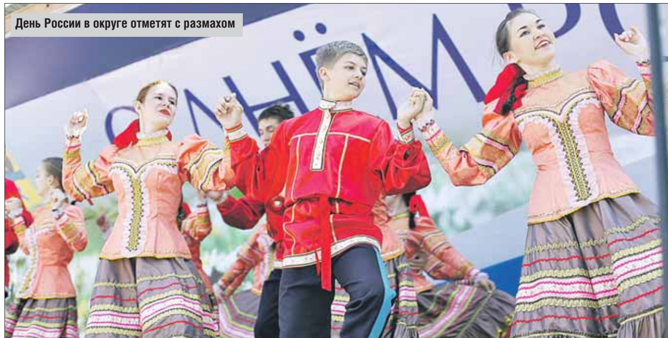
День России в округе отметят с размахом