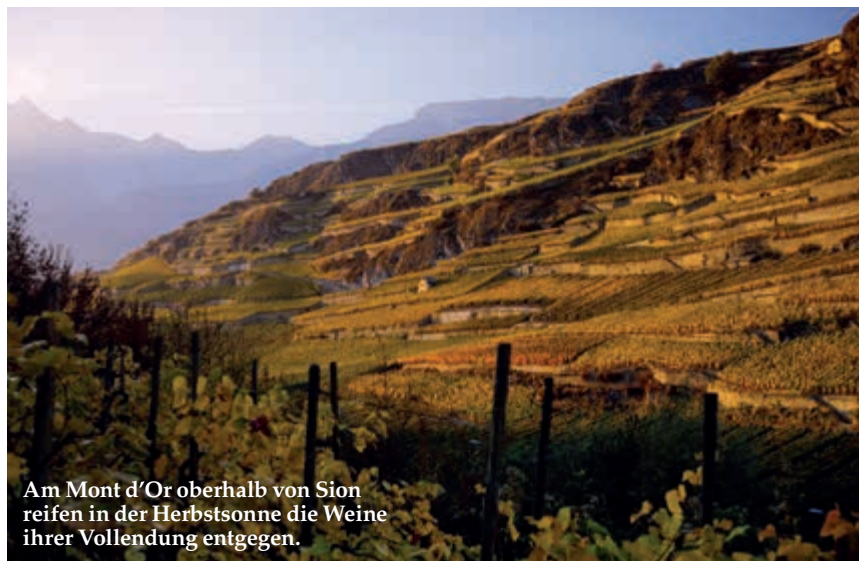
Am Mont d'Or oberhalb von Sion reifen in der Herbstsonne die Weine ihrer Vollendung entgegen.