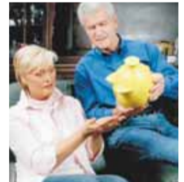
Rechtzeitig umdenken, damit auch etwas übrig bleibt.