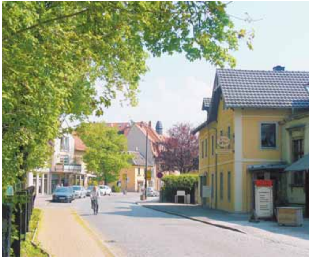
Kleinzschachwitz liegt idyllisch im Osten Dresdens.

Am 13. Mai wird in Zschachwitz auf der Dorfmeile gefeiert