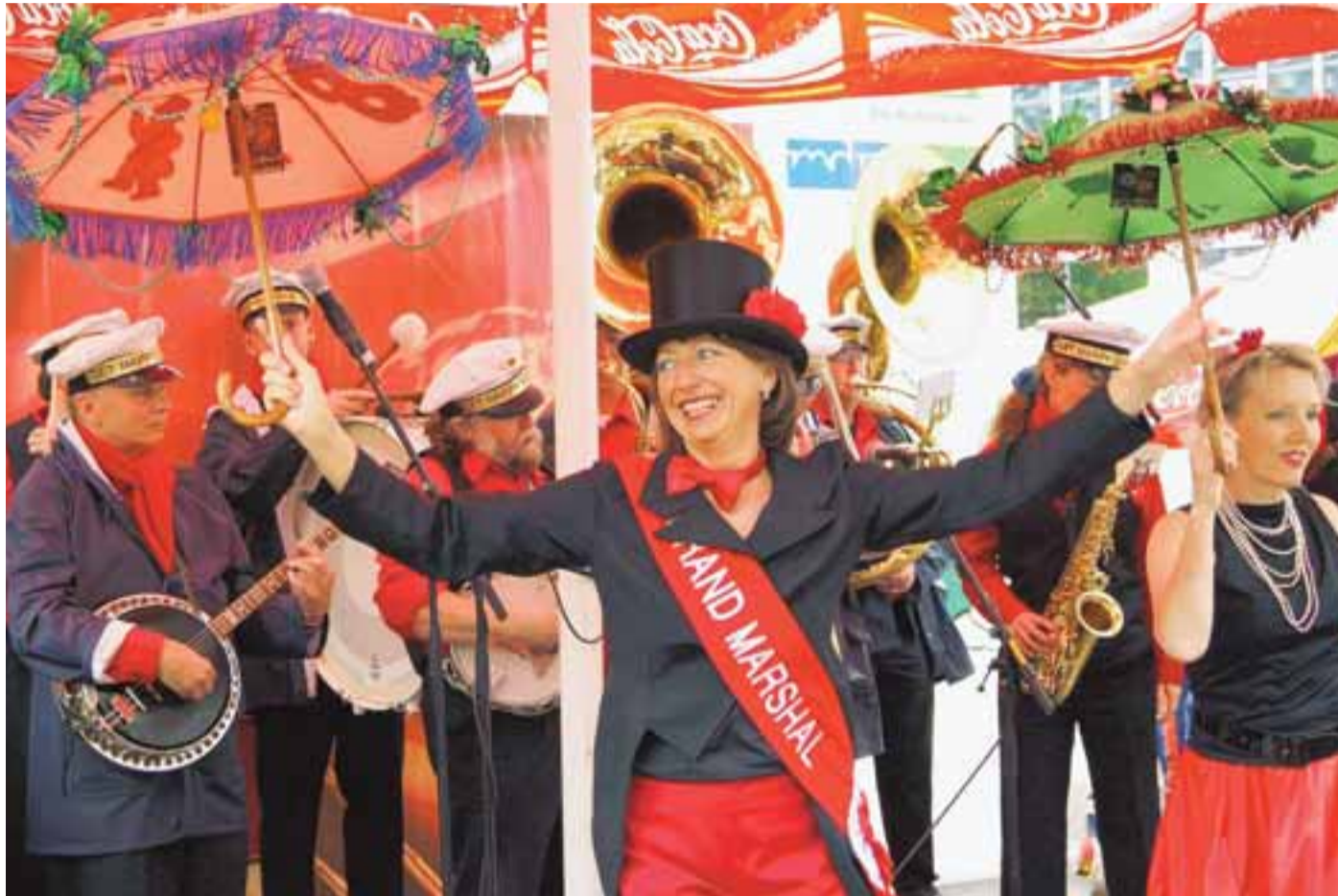
Jahr für Jahr: Internationale Gäste und Mitwirkende verwöhnen musikalisch knapp eine halbe Million Besucher.