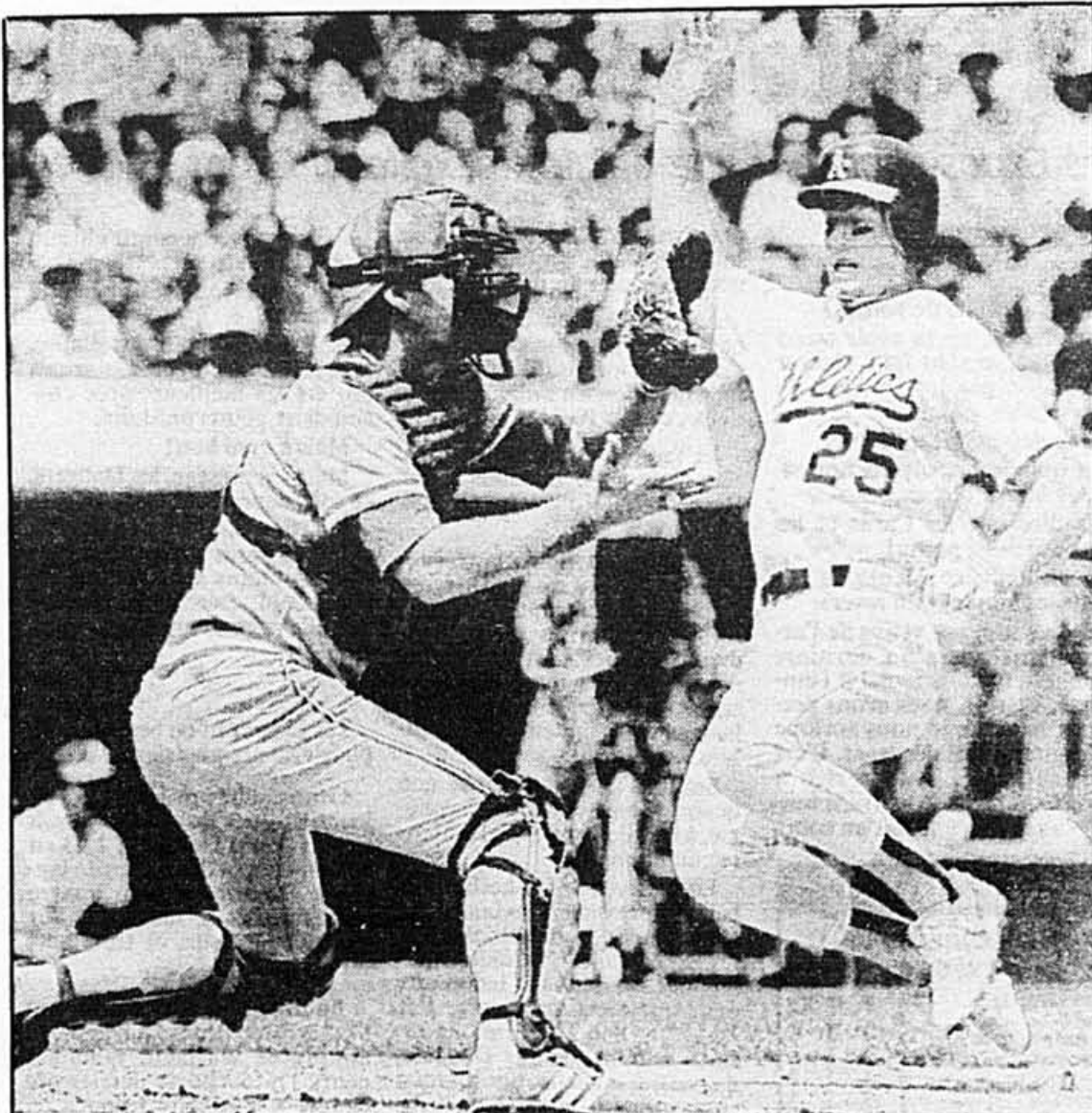
Mark McGwire n'avait que quelques pieds à faire avant de toucher le marbre. Le receveur Ernie Whitt, des Blue Jays, attendait la balle qui est venue après la fin de la glissade du joueur des Athletics.

Les Mets avaient créé l'égalité, 6-6, en huitième, quand Johnson a frappé un simple, pour ensuite croiser le marbre sur un double du frappeur suppléant Dave Magadan.