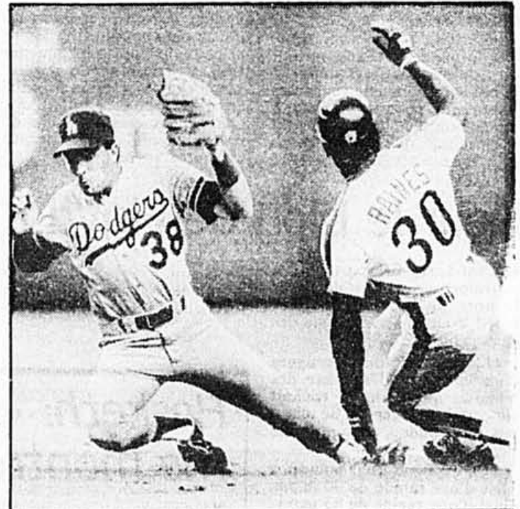
Tim Raines a facilement volé le deuxième but en première manche, hier. Il a pu se rendre jusqu'au troisième sur le mauvais relais du receveur Mike Scioscia à Craig Shipley.