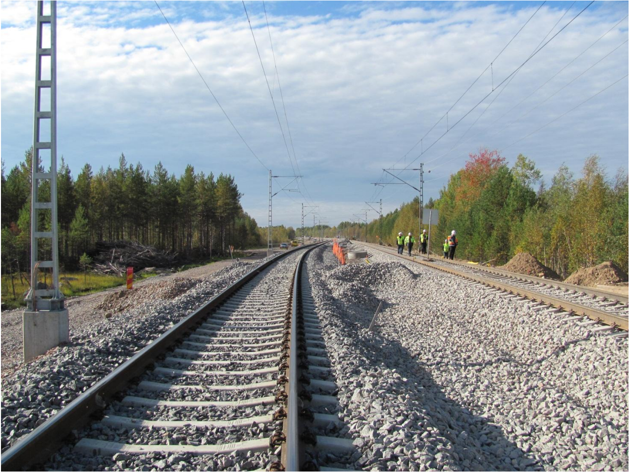
Kuva. Tikkaperän liikennepaikan rakennustyöt