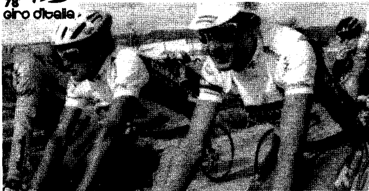
Pantani e Chiappucci nel luglio scorso al Tour de France

Ciclismo, tra 5 giorni parte la grande corsa a tappe Percorso adatto a Pantani, reduce da un incidente