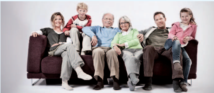
Vielfalt für jeden Anspruch

Die GGZ mbH hat mit dem Kabelnetzbetreiber Tele Columbus einen neuen Gestattungsvertrag abgeschlossen und zum 1. Juli 2013 den Digitalen Kabelanschluss (DKA) für alle Mieter vereinbart. Versorgungsverträge kann nunmehr jeder Mieter / Wohnungseigentümer individuell mit Telecolumbus abschließen.