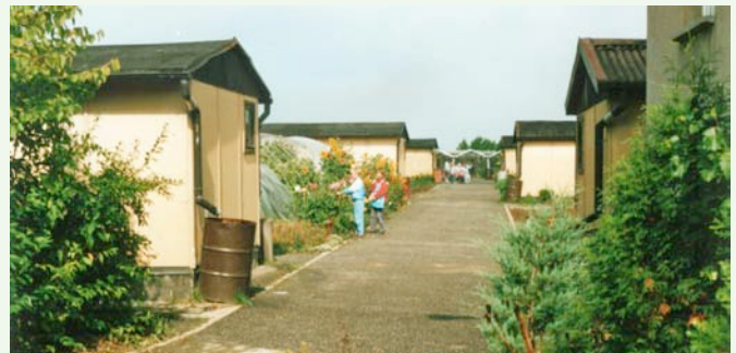
Der Zentralschulgarten Planitz im Jahr 1993

Mit tausenden Stunden ehrenamtlicher Arbeit mehrerer Generationen von Vereinsmitgliedern und freiwilligen Helfern wurde die Einrichtung zu dem, was sie heute ist: grüner Anziehungspunkt im Stadtteil Planitz, Bestandteil von Erziehung und Bildung unserer Kinder sowie Freizeitbetätigungsfeld für Alt und Jung. Durch den persönlichen Einsatz der Vereinsmitglieder und Helfer konnte in den vergangenen Jahren vieles geschaffen werden. So entstanden unter anderem ein Kinderspielplatz, das Ziegengehege, ein Teichbiotop, zwei Bungalows wurden