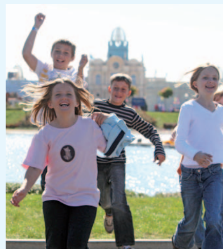
Viel zu entdecken: Da ist Spaß garantiert

BELANTIS ist nur eine Stunde von Zwickau entfernt und schnell über die Autobahn (A38 mit eigener Ausfahrt „Neue Harth/BELANTIS“) erreichbar.