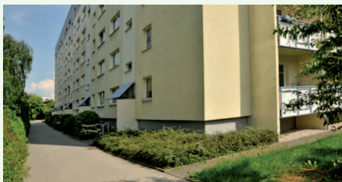
Gelegen in Randlage und umgeben von vielen Grünflächen

Moderner Grundriss mit funktionalen Details!