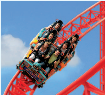
Die Mega-Achterbahn HURACAN

BELANTIS ist ein Muss für aktive Familien: Mutige erleben ein angenehmes Bauchkribbeln auf der Familienattraktion „Buddel-Tanz“ oder der