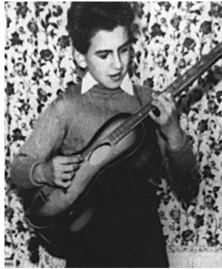
George Harrison met zijn Egmond Toledo 105/0

Het is een vertederend kiekje uit 1956: George Harrison voor een bloemetjesgordijn, poserend met zijn eerste gitaar. Op zijn dertiende verjaardag gekregen van zijn vader, die daar eigenlijk geen geld voor had, en dus het goedkoopste instrument kocht dat hij kon vinden. „Een rotting”, zou Harrison later zeggen.