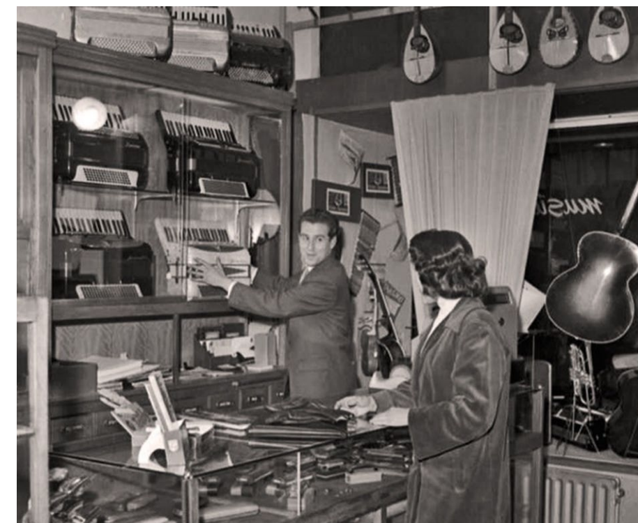
Musica, de instrumentenwinkel die na de oorlog verhuisde naar de Hooghuisstraat.