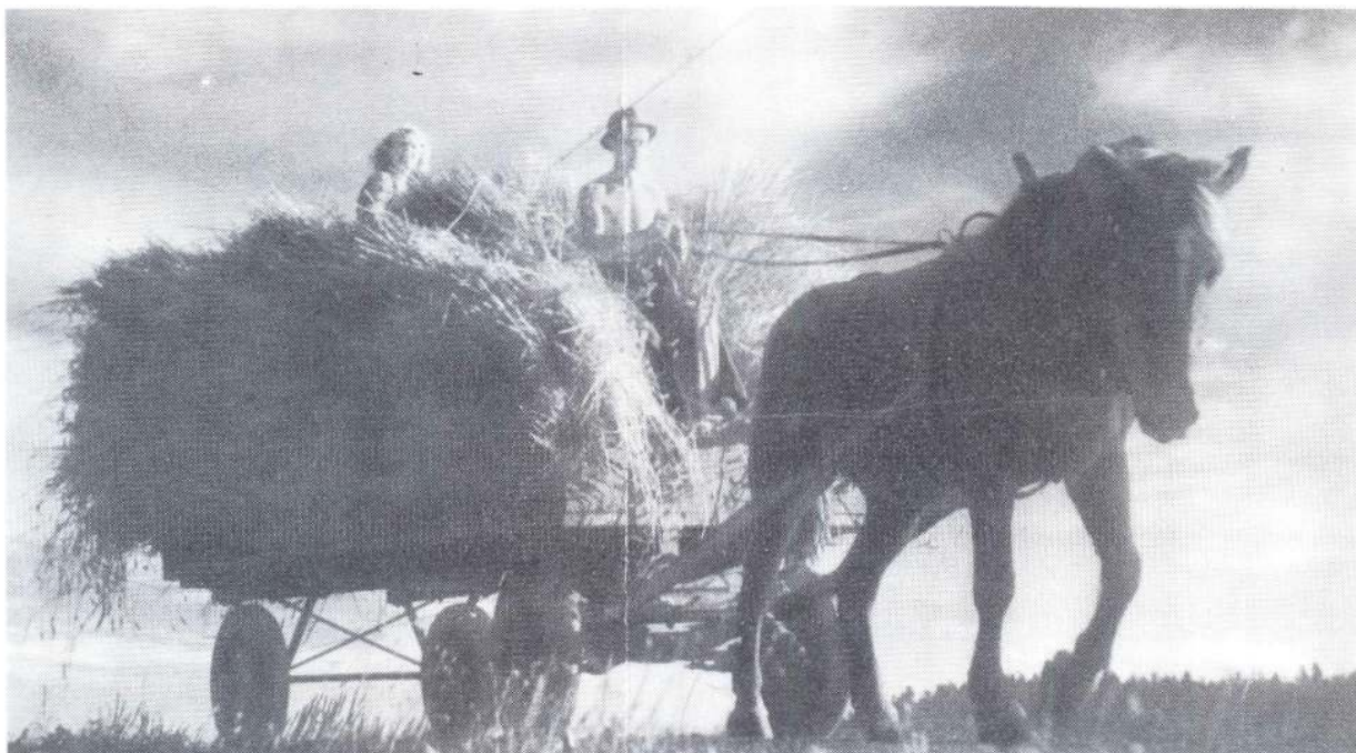
Skörden köres hem.