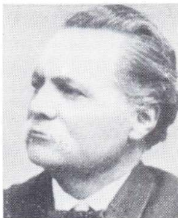
Arthur Hazelius, skapade Nordiska museet och Skansen. Skansen öppnade 1891, som en underavdelning till Nordiska museet.

Skansen skapades som ett uttryck för den starkt nationella strömning, som präglade tidens svenska konst och kulturliv. Skansens grundare Artur Hazelius, en man som förenade