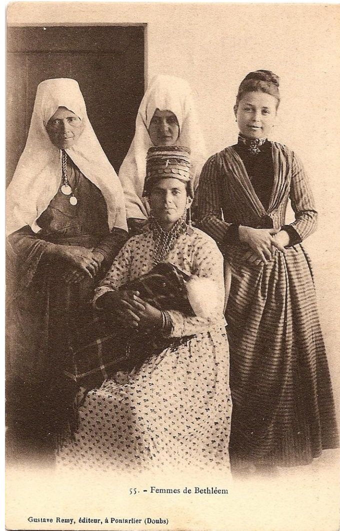
Cuatro mujeres cristianas de Belén, Palestina en 1911 5