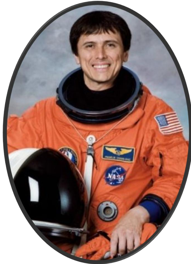
Franklin Chang Diaz 11