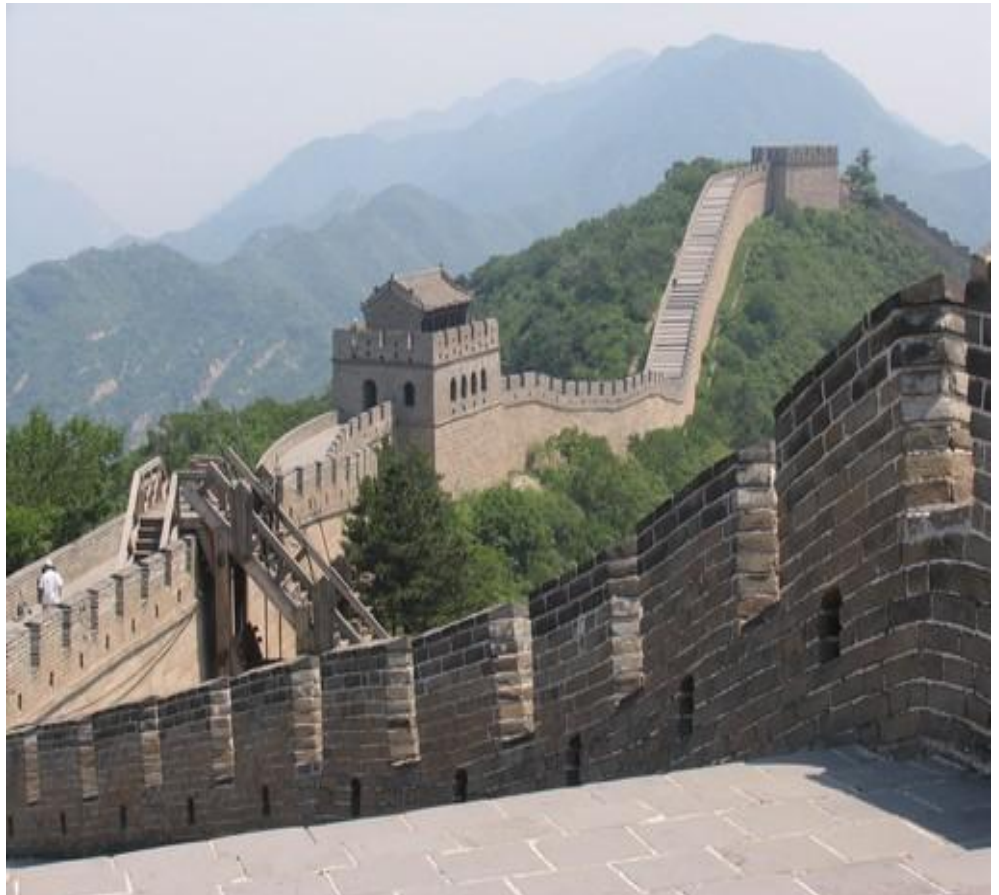
Muralla China 9

Por Yves de La Goublaye de Ménorval R. 8