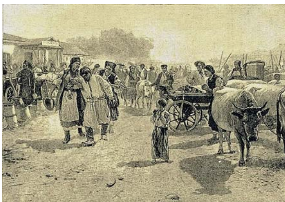
Ярмарок в Малоросії. Гравюра М. К. Пимоненка

На це повітова управа підготувала довідку: “Главная причина необходимости такого продолжительного срока Велико-Хуторской ярмарки – потребность окрестного поселения, занятого исключительно хлебопашеством, – иметь возможность заменять в свободное от полевых работ время т. е. в праздники негодный к употреблению рабочий скот скотом молодым и годным. Самое время этой ярмарки (Март месяц – начало полевых работ), характер ее торговли только