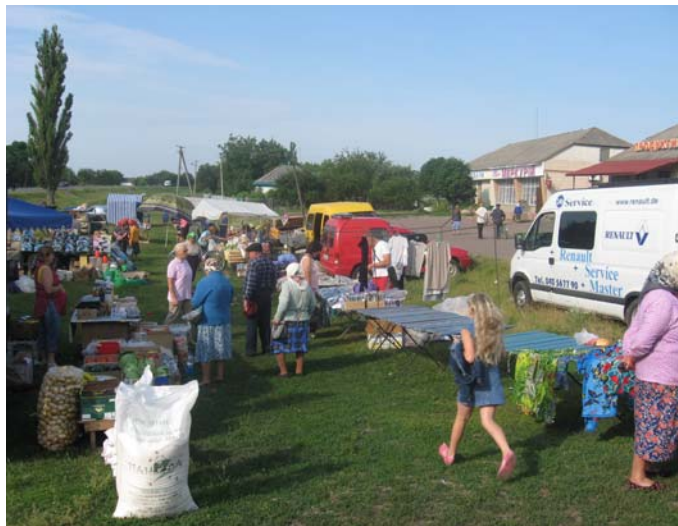
В. Хутір, сільський базар (2009 р.). Колись на цьому місці вирували п'ять ярмарків