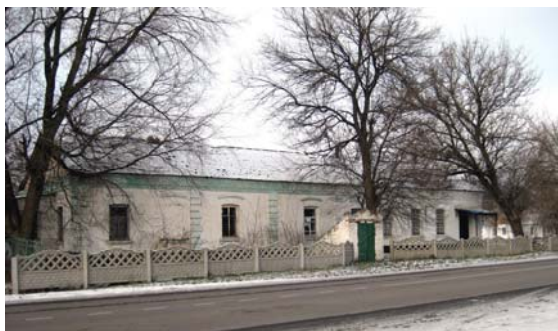
Приміщення колишньої земської лікарні у В. Хуторі. Фото 2010 р.

лікарських амбулаторій та 8 лікарень у яких було 177 ліжко-місць. Крім того, у Золотоноші діяли поліклініка, рентген-кабінет, туберкульозний диспансер, вендиспансер, склад ліків та 3 аптеки. Як свідчить статистика, з 1.10.1923 по 1.10.1924 року лікарями і лікпомічниками було надано амбулаторну допомогу 238 855 жителям Золотоніської округи, і 71 757 осіб отримали таку допомогу в закладах Робмеду (робітничої медицини). Стаціо-нарна допомога була надана 2644 особам, акушерська – 1712-ти. На жаль, про характер цієї допомоги нічого не відомо. Але якщо порівняти наведені дані з показниками 1914 року, то можна побачити, що у перші роки існування радянської влади рівень охоплення населення медичною допомогою суттєво знизився, оскільки навантаження на одного медпрацівника зросло більш ніж удвічі. Напевне, знизилася і якісь надання медичних послуг, бо у 1923–1924 роках медикам знову довелося боротися з такими епідемічними хворобами, як сифіліс, тиф, коклюш, дизентерія,