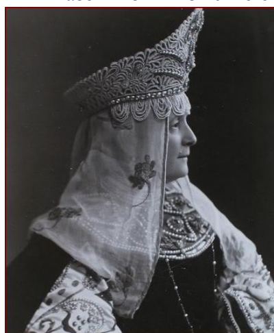
Княгиня Надія Барятинська у костюмованому наряді

За даними статистичного бюро Полтавської губернії, на 1885 рік у Золотоніському повіті Барятинським належало 11 179 десятин землі й 1500 десятин – у сусідньому Пирятинському. На цій землі селяни вирощували велику кількість хліба, який економія Барятинських вивозила за межі Полтавщини, а також переробляла на місці. Наприклад, тільки на винокурному заводі в Дуніновці щороку переганяли близько 40 тисяч пудів хліба, збуваючи в державну казну до 1 млн 700 градусів чистого спирту. Пізніше на залізничній станції Драбово Барятинські збудували паровий млин з круподернею, який давав на рік близько 50 тисяч пудів борошна і до 10 тисяч пудів круп. Нарешті, для потреб економії в ній запрацював цегельний завод, на якому щороку виготовляли до 500 тисяч штук добротної цегли.