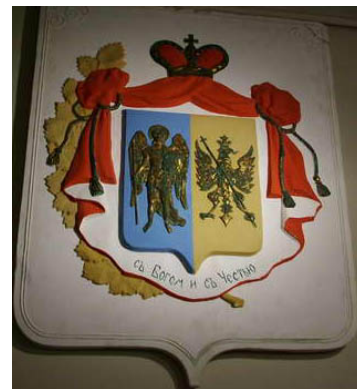
Родовий герб Барятинських

Про зв'язки князівського роду Барятинських з Драбівщиною добре відомо хоча б тому, що це прізвище відбилосся у назві одного з населених пунктів нашого краю – пристанційного селища Драбово-Барятинське. Відомо також, що у другій половині XIX – на початку XX століть у містечку Драбів Золотоніського повіту була велика економія княгині Барятинської, до якої належали льонотіпальна і паперово-обгорткова фабрики, винокурня, паровий млин, кінний і цегельний заводи тощо. Після революції 1917 року все це, на жаль, було зруйноване і розграбоване. Але мешканці Драбова та навколишніх сіл ще й досі знаходять на своїх обійстях цеглу з маркуванням “К. Б.” (княгиня Барятинська), яка нагадує про колишню заможність і впливовість представників цього роду. Та мало хто знає про те, звідки походив цей рід і як склалася доля його нащадків, зокрема тих, які колись володіли тут землями нашого краю (див. додаток 21). Саме про це і йтиметься далі.