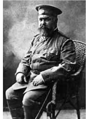
Земський діяч початку XX ст.