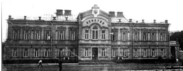
Приміщення Золотоніського земства на початку ХХ ст.

Значною мірою це стосується й історії Золотоніського земства, яке охоплювало більшу частину теперішніх Золотоніського, Чернобаївського та Драбівського районів, а також лівобережну частину Канівського району Черкащини. За територією