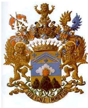
Герб дворянського роду Капністів

Блискучу кар'єру зробив і Д.П. Капніст, який народився 5 червня 1879 року. В 1903 році, по закінченні юридичного факультету С.-Петербурзького університету, він поступив на службу до міністерства юстиції, а в 1907–1908 роках був товаришем прокурора Тамбовського окружного суду. Мав чин титулярного радника. У 1912 році Д.П. Капніст був обраний депутатом IV Державної думи, де входив до фракції так званих “октябристів”, а згодом став лідером цієї фракції. 1 березня 1917 року Тимчасовим комітетом Держдуми він був призначений комісаром над міністерством внутрішніх справ, а з 8 березня – головою Особливої комісії з ліквідації Головного управління у справах друку (комісар Тимчасового уряду у справах друку) 47 .