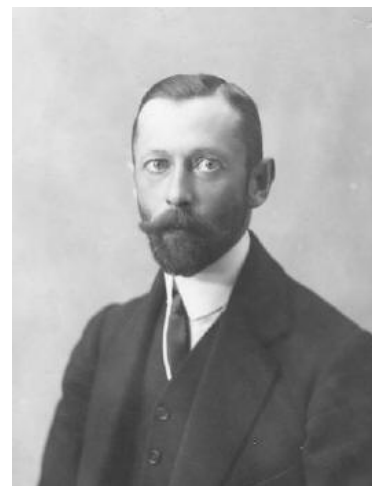
Д.П. Капніст, останній предводитель Золотоніського дворянства

У 1910 році предводителем повітового дворянства був надвірний радник Микола Олександрович Лесеневич , який до цього у 1904–1909 роках служив земським начальником 5-ї дільниці (В. Хутірська, Безпальчівська, Драбівська волості) 45 . А після нього впродовж майже 7 років цю посаду обіймав граф Дмитро Павлович Капніст 46 , онук відомого декабриста Олексія Васильовича Капніста. Один з його синів — Павло Капніст (1842–1904) – керував канцелярією міністерства юстиції царського уряду, з 1877 року був прокурором Московської судової палати. У 1880–1895 роках служив опікуном Московського учбового округу, був сенатором.