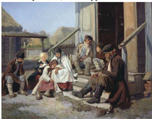
М. Загорський. Біля земської лікарні, 1886 р.

будівництва лікарні була оцінена у 12 тисяч руб. Тому решту необхідної суми надало Полтавське губернське земство у вигляді позики. Вже у 1906 році драбівська лікарня розпочала прийом хворих, а наступного року у її стінах стаціонарну медичну допомогу отримало 259 осіб, які загалом провели там 2987 днів. Повне добове утримання і лікування одного хворого обходилося у 22,5 копійки, з яких 16,25 складали витрати на харчування. Важливо, що як лікарська, так і фельдшерська допомога хворим надавалися безкоштовно, так само, як і видача їм ліків. Хоча у 1900 році в Золотоніському повіті було запроваджено 5-копійчаний збір за медичні поради, які супроводжувалися видачею ліків. Але це не заважало більшості хворих отримувати кваліфіковану медичну допомогу, надання якої забезпечувала ціла плеяда земських лікарів та фельдшерів. Ось як виглядав персональний склад медичної частини Золотоніського повіту станом на 1900-й рік: