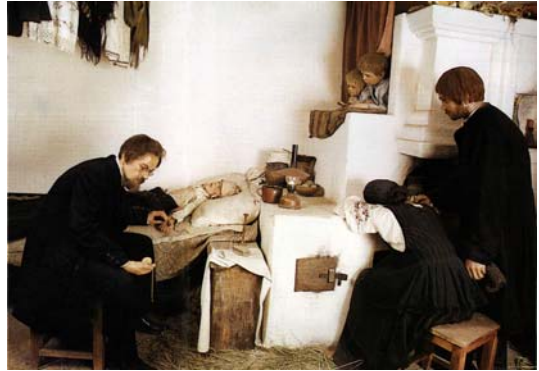
Земський лікар у селянській хаті.

Отож, спираючись на матеріали Золотоніського повітового земського зібрання та земської управи, спробуємо прослідкувати як у Золотоніському повіті проходило становлення земської медицини, наскільки вона була ефективною та доступною для простого народу, зокрема, жителів містечка Великий Хутір. При цьому зауважимо, що у другій половині XIX ст. Великий Хутір був доволі значним