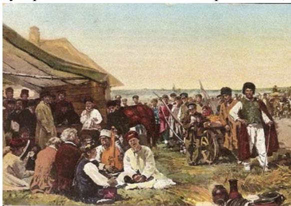
С.К. Маковський. Ярмарок в Малоросії

За даними Полтавського губернського земства, 1882 року в 338 населених пунктах Полтавської губернії існували 1030 ярмарків і їх кількість зростала з кожним роком. У 1895 році тут налічувалося вже 1185 ярмарків, які діяли у 374 населених пунктах. Найбільшими з них були чотири роменські торжища та Іллінський ярмарок у Полтаві, де велася оптова торгівля, зокрема предметами фабрично-заводської промисловості. Важливі ярмарки відбувалися і в Кременчуці, куди по Дніпру звозили крам з Білорусі, Чернігівщини, Київщини. Потрібно сказати, що за обсягами ярмаркового товарообігу Золотоніський повіт посідав четверте місце в Полтавській губернії після Константиноградського, Кобеляцького та Прилуцького повітів. У