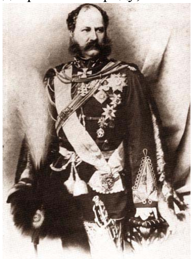
Фельдмаршал О. Барятинський, (1815-1879)

До цього можна додати, що А.І. Барятинський належав до відомого дворянського роду, який веде свій початок ще від князя Михайла Чернігівського –