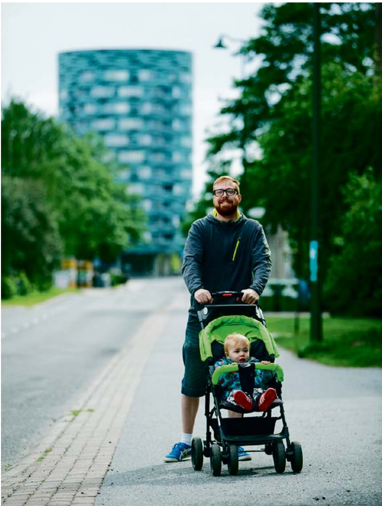
Turun ylioppilaskylä on yli neljäkymmenen vuoden aikana tarjonnut kodin tuhansille opiskelijoille. Monista vähemmän mairittelevista nimityksistä huolimatta Yo-kylän asunnot ovat säilyttäneet suosionsa. Hyvä sijainti, lyhyet välimatkat ja kohtuuhintaiset vuokrat houkuttavat yhä uusia opiskelijasukupolvja.