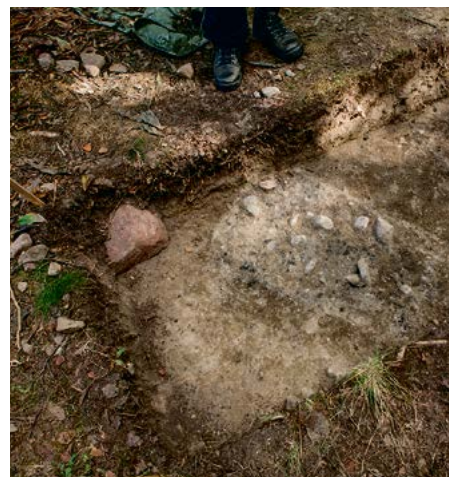
Kirkkomaahan arkuissa haudattujen vainajien paikat näkyvät maassa painanteina vielä tänäkin päivänä. Tähän mennessä arkeologit ovat tutkineet vasta kaksi hautaa arviolta kolmestasadasta haudasta.