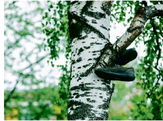
Vaikka pääosa Yo-kylän asukkaista on nuoria aikuisia, elämäntilanteet vaihtelevat melkoisesti. Osa nuorista on vasta irtautumassa lapsuudenkodistaan, toiset sen sijaan ovat jo aloittamassa omaa perhe-elämäänsä.

— Itsemurhayksiö oli kyllä nimen- seroinen. Se oli pieni koppi, jossa ainoa mediani kirjojen lisäksi oli radiomankka. Muistan yhä elävästi, miten valvoin öisin sängyssäni ja kuuntelin Yölinjaa. Juhlittuun tai muuten vaan valvotun yön jälkeen