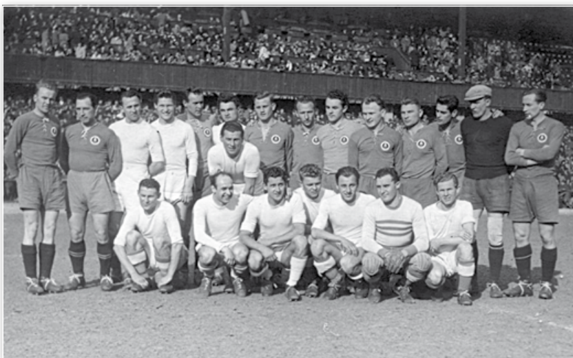
• Ferencváros Budapešť – ŠK Bratislava (1946) / Ferencváros Budapest – ŠK Bratislava (1946)