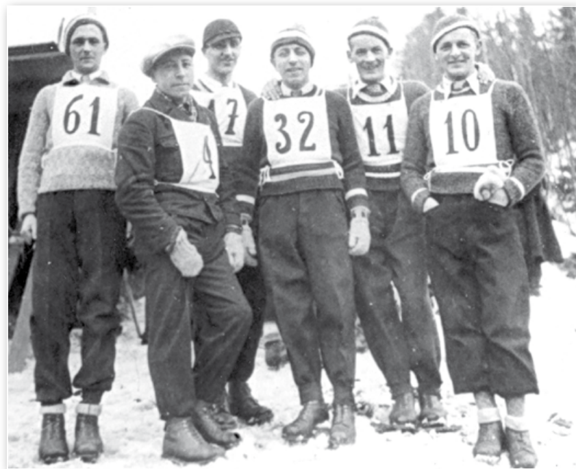
• Družstvo ružomerských skokanov na lyžiach / Ruzomberok ski jump team