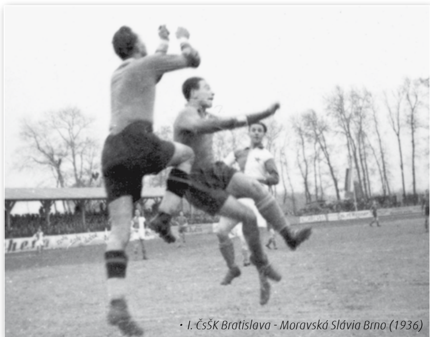
• I. ČsŠK Bratislava - Moravská Slávia Brno (1936)