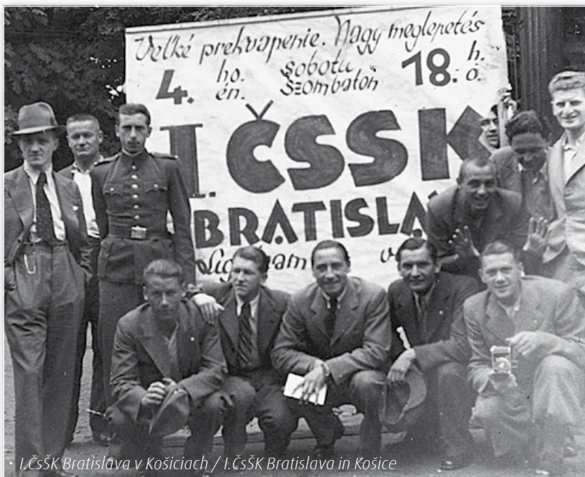
• I. ČSSK Bratislava v Košiciach / I. ČSSK Bratislava in Košice