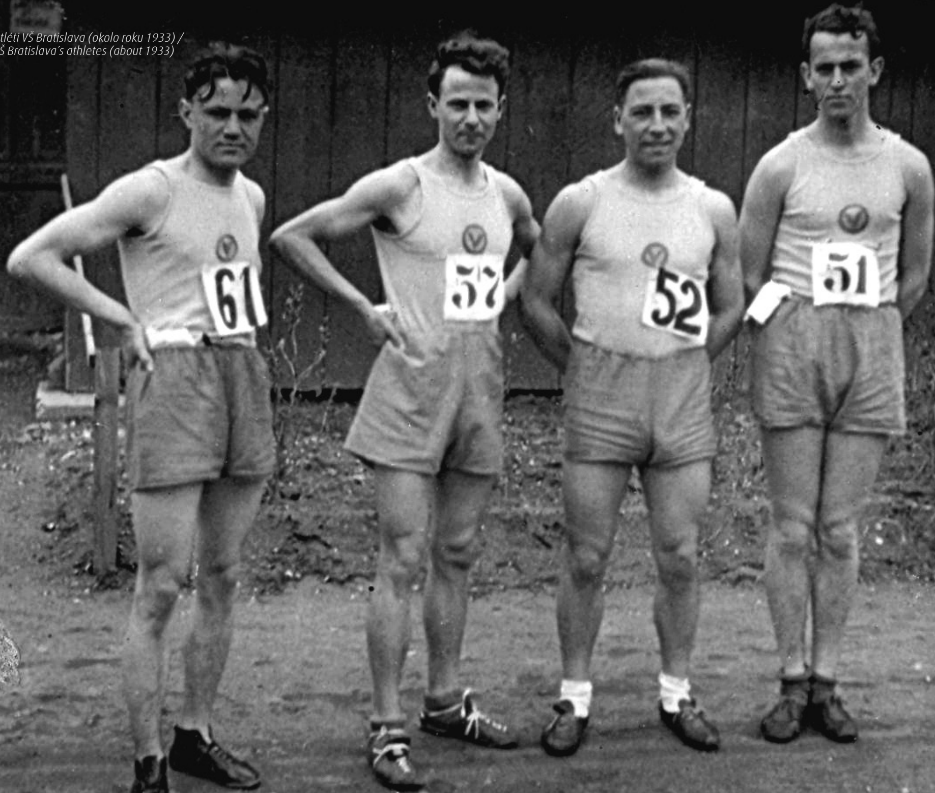
• Atléti VŠ Bratislava (okolo roku 1933) / VŠ Bratislava's athletes (about 1933)