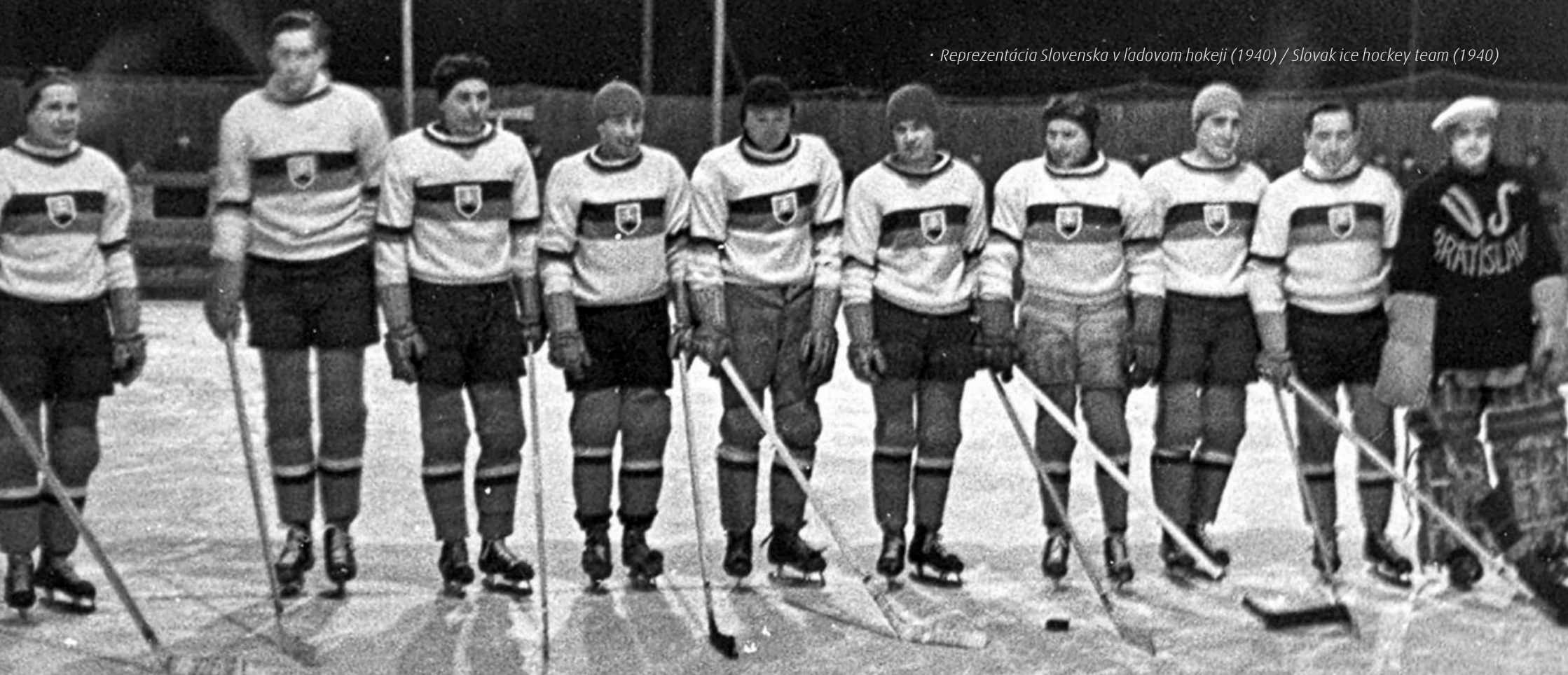
• Reprezentácia Slovenska v ľadovom hokeji (1940) / Slovak ice hockey team (1940)