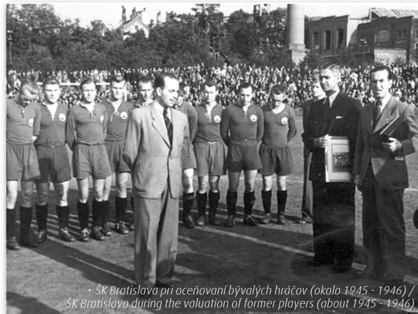
• ŠK Bratislava pri oceňovaní bývalých hráčov (okolo 1945 - 1946) / ŠK Bratislava during the valuation of former players (about 1945 - 1946)