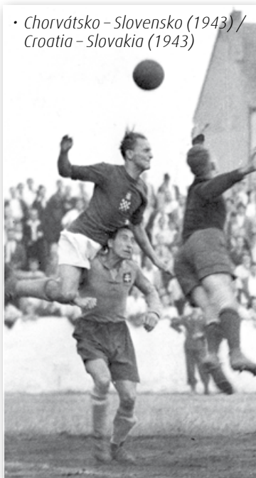
• Chorvátsko - Slovensko (1943) / Croatia - Slovakia (1943)