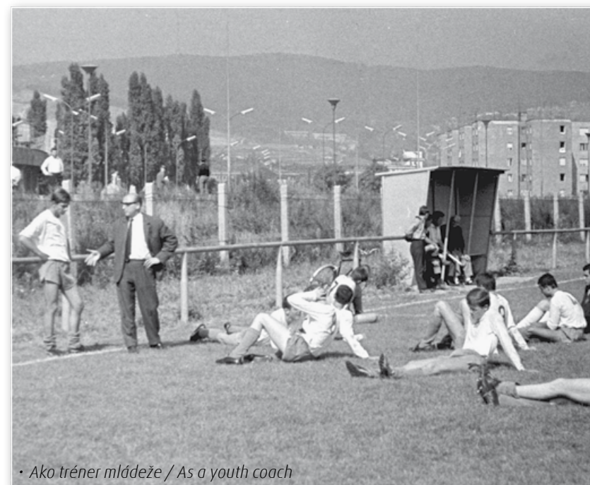
• Ako tréner mládeže / As a youth coach