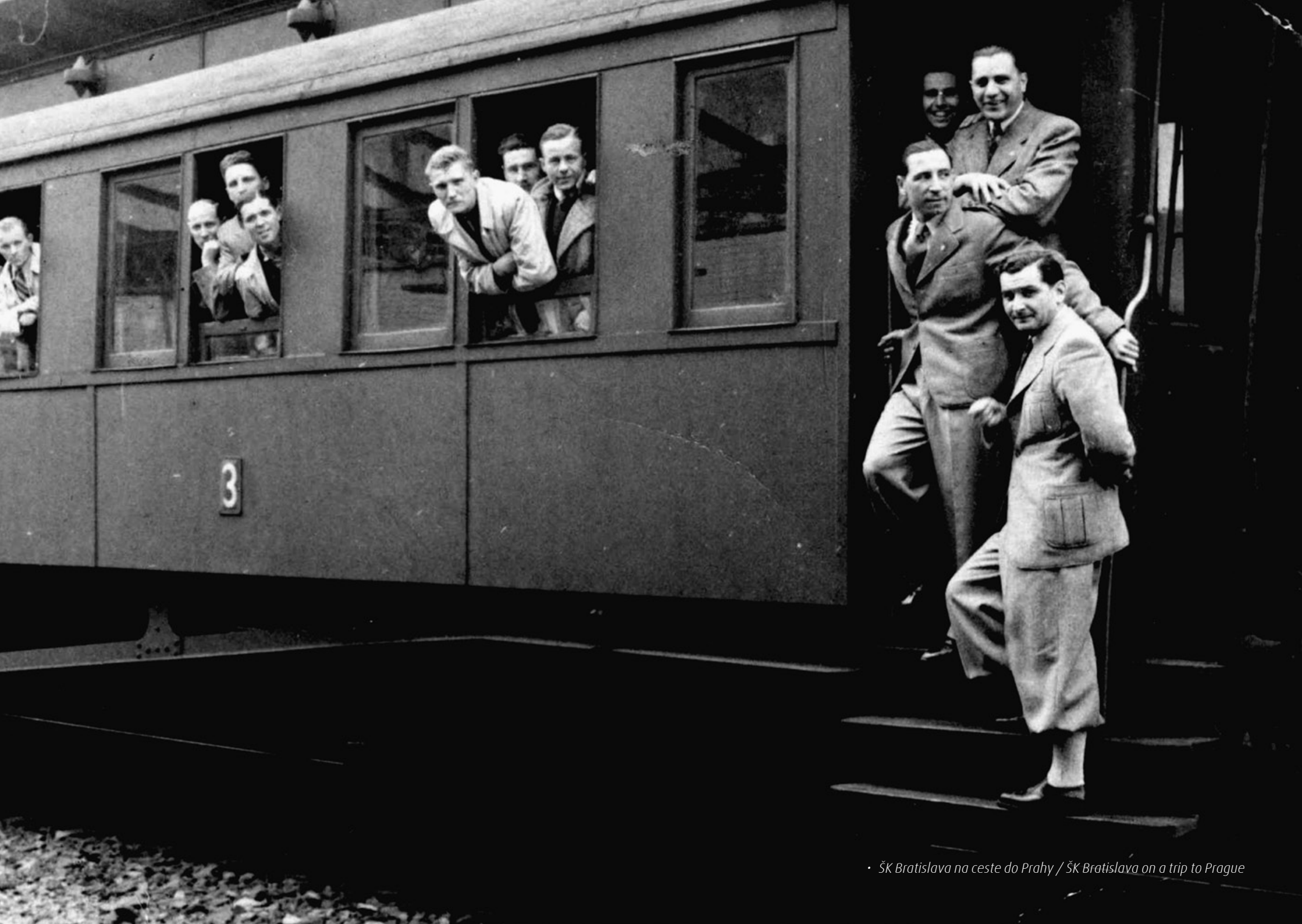
• ŠK Bratislava na ceste do Prahy / ŠK Bratislava on a trip to Prague