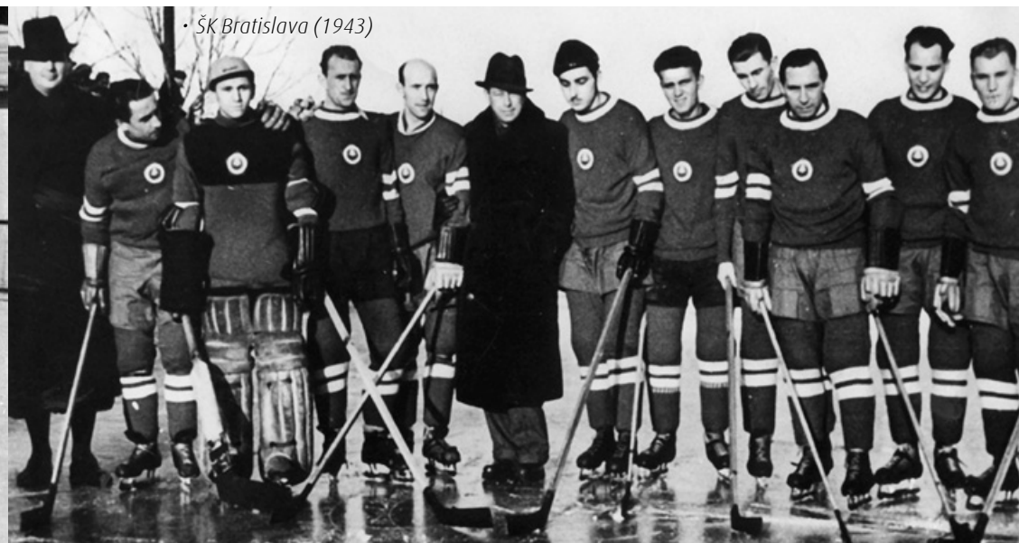
• ŠK Bratislava (1943)