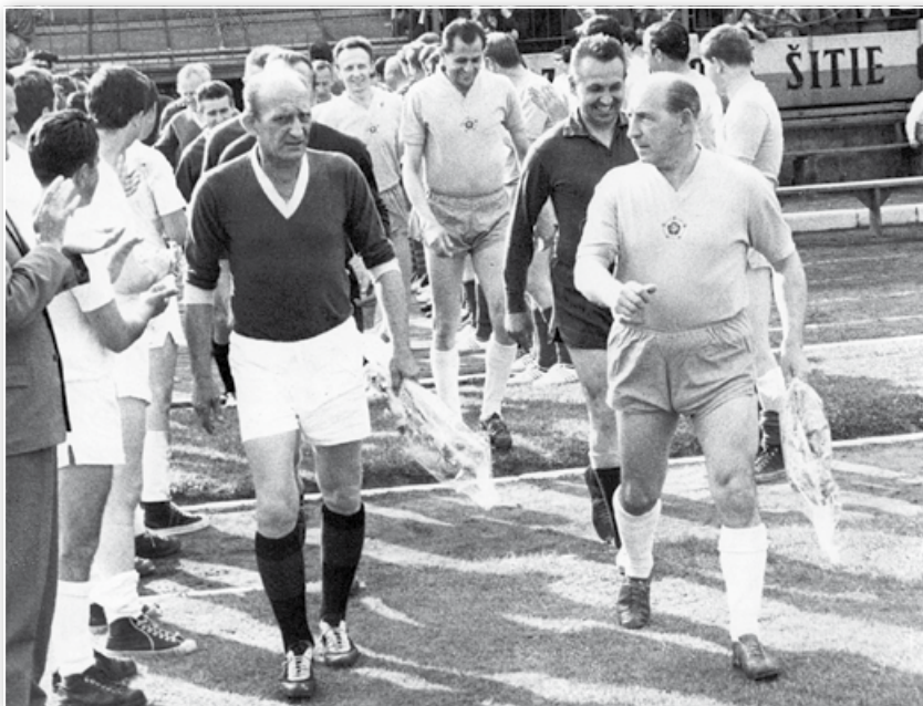
• Old boys Sparta Praha - Slovan Bratislava (okolo roku 1975) / Old boys Sparta Praha - Slovan Bratislava (about 1975)