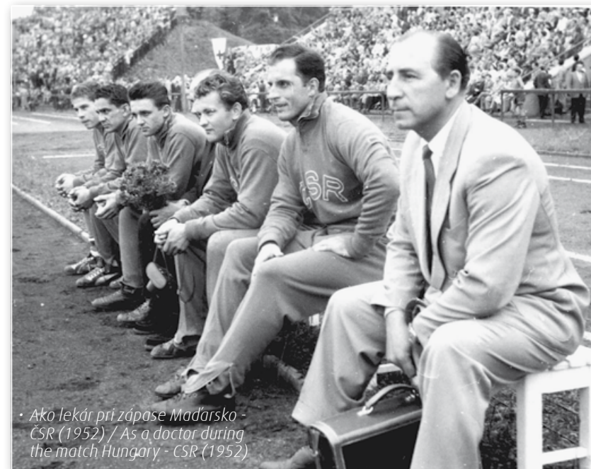
• Ako lekár pri zápase Maďarsko - ČSR (1952) / As a doctor during the match Hungary - CSR (1952)