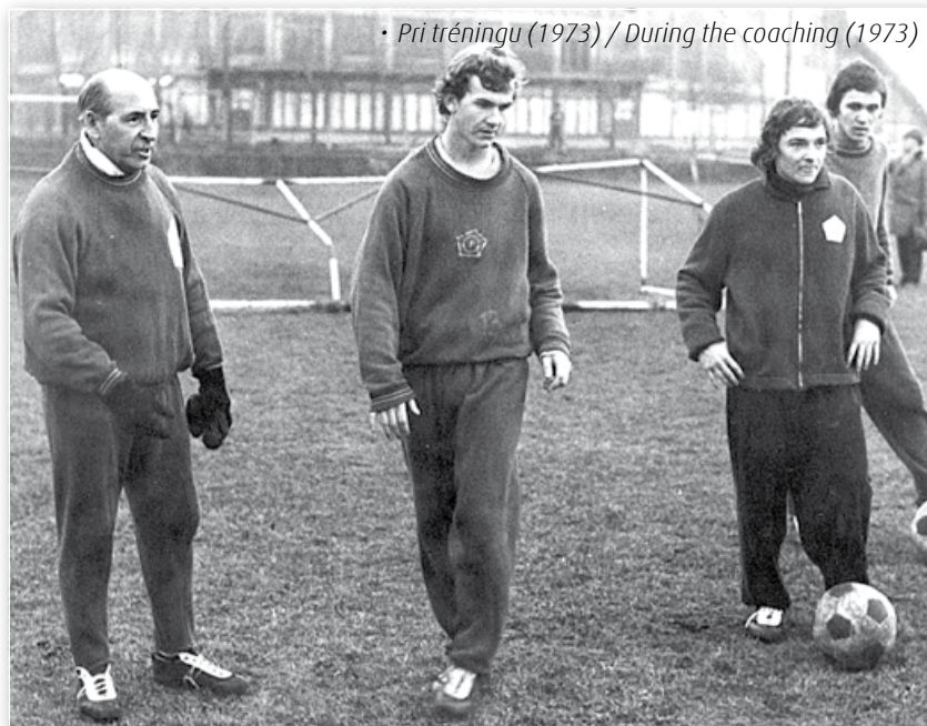
• Pri tréningu (1973) / During the coaching (1973)