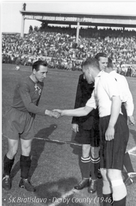
• ŠK Bratislava - Derby County (1946)