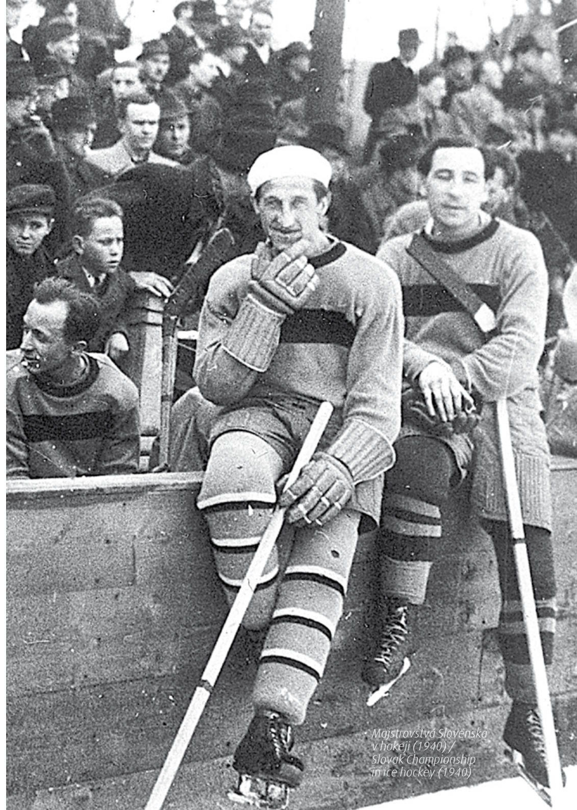
Majstrovstvá Slovenska v hokeji (1940) / Slovak Championship in ice hockey (1940)