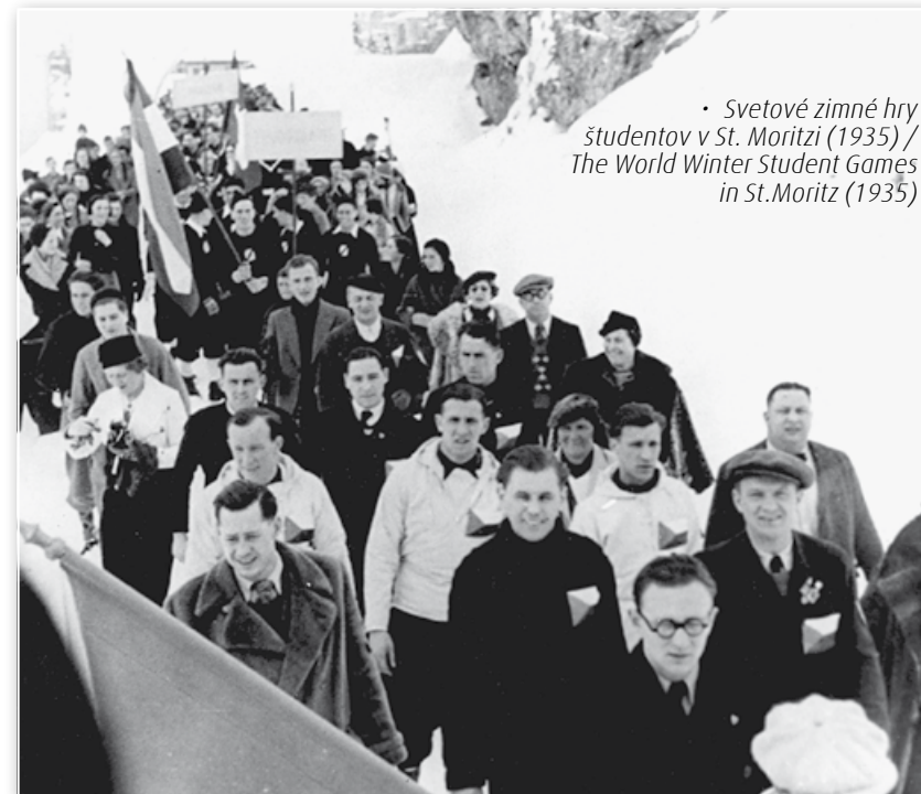
• Svetové zimné hry študentov v St. Moritzi (1935) / The World Winter Student Games in St. Moritz (1935)