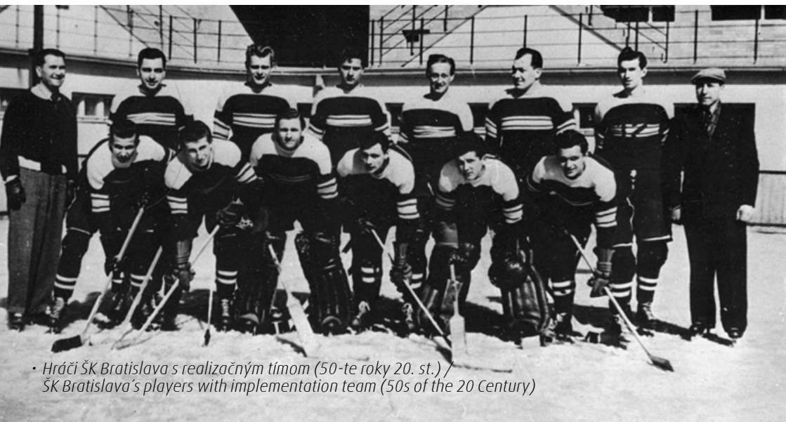
• Hráči ŠK Bratislava s realizačným tímom (50-te roky 20. st.) / ŠK Bratislava's players with implementation team (50s of the 20 Century)