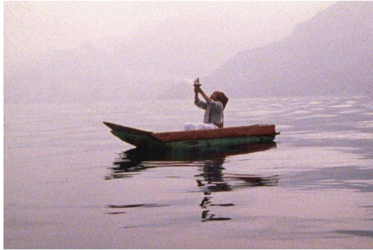
The year zero

Als die neun Zyklen sich entfalteten, wurde dem Volk das Land und die Freiheit genommen. Krankheit und Unterdrückung herrschten.