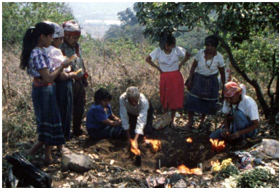
The year zero

„Diejenigen, die Bescheid wissen sind die eingeborenen Ältesten, die mit der Bewahrung der Traditionen betraut sind.“