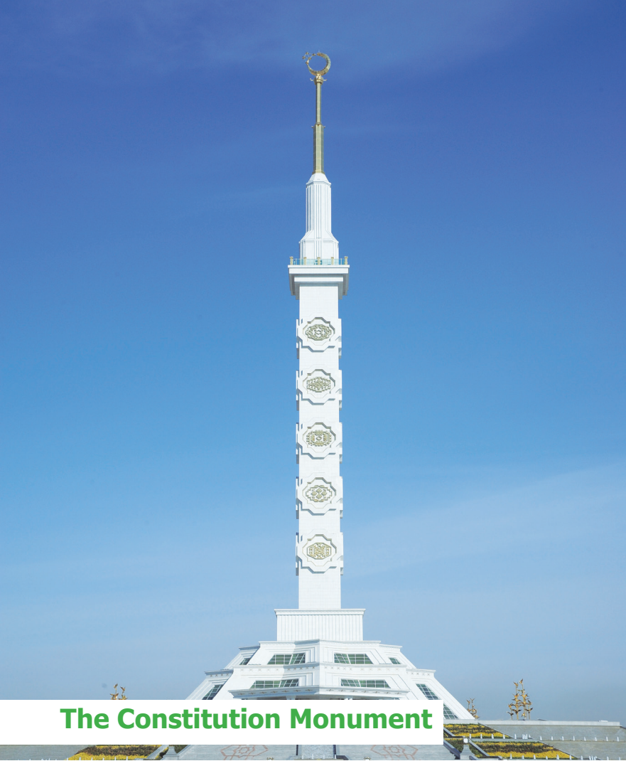
The Constitution Monument