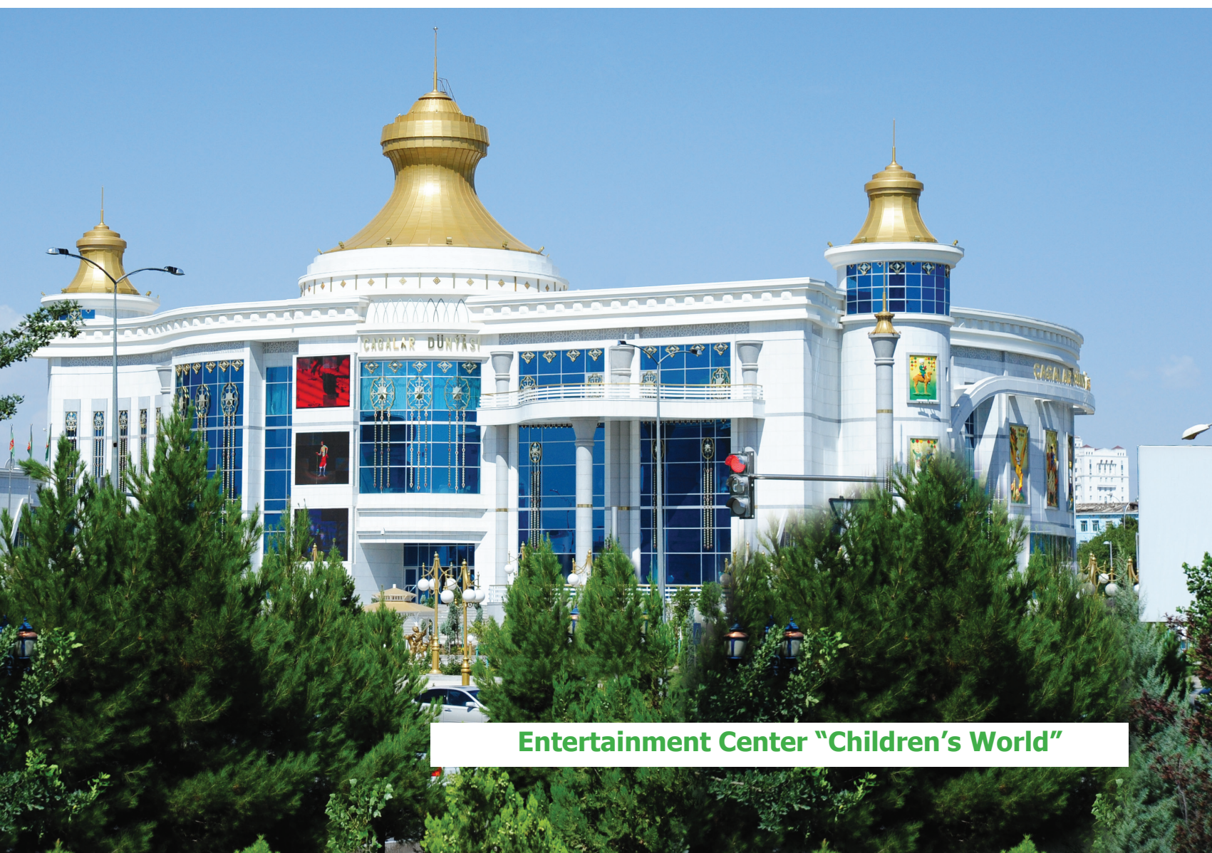
Entertainment Center "Children's World"