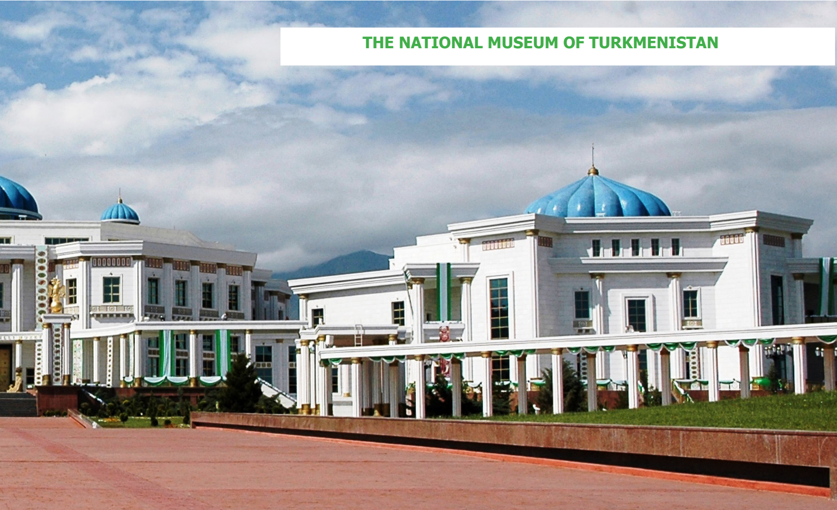
THE NATIONAL MUSEUM OF TURKMENISTAN