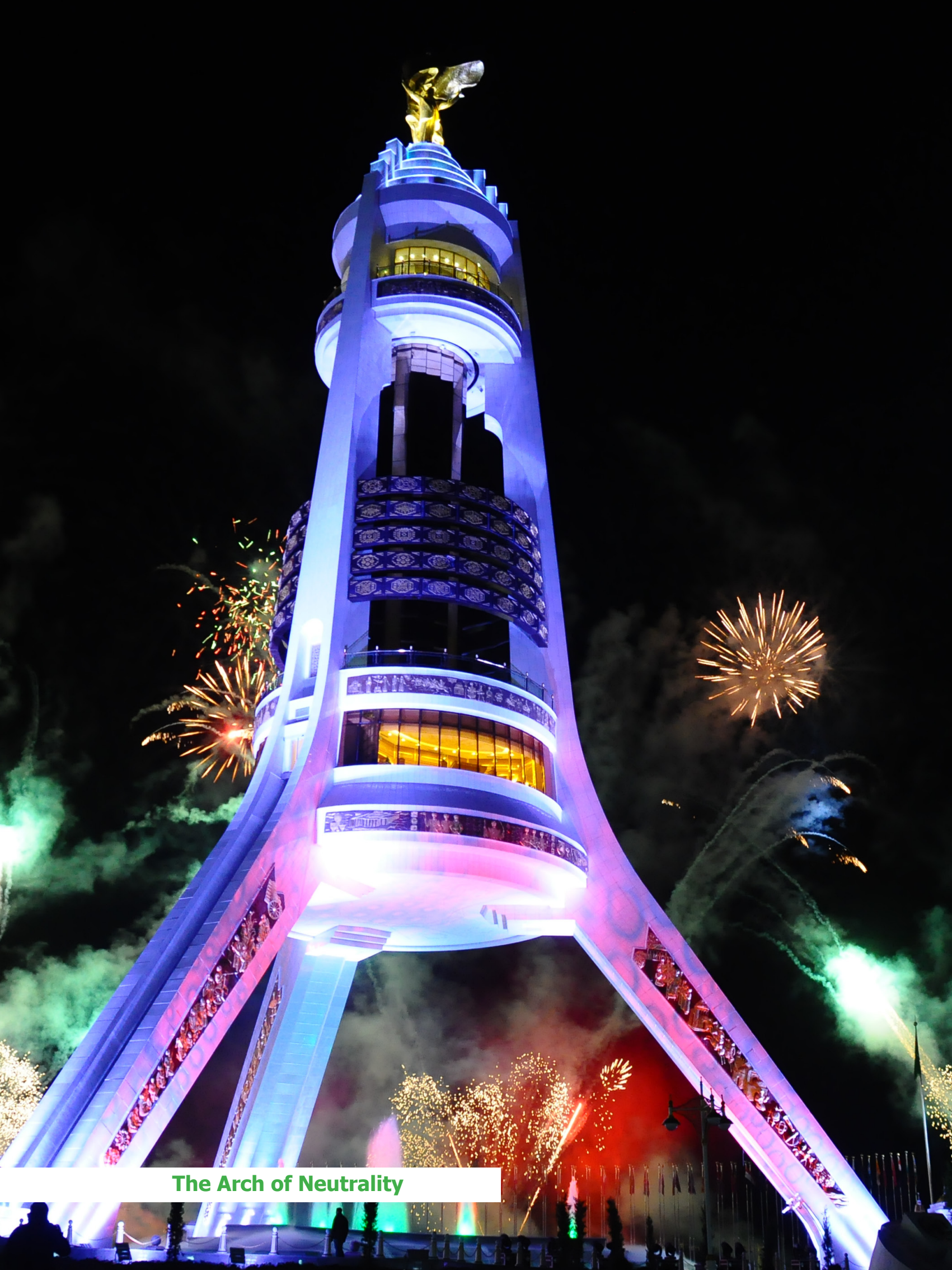
The Arch of Neutrality