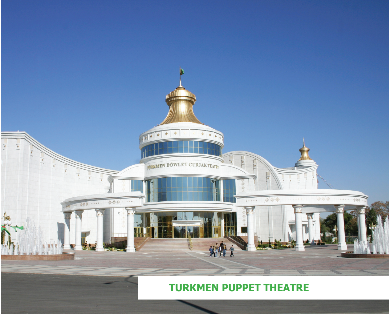
TURKMEN PUPPET THEATRE