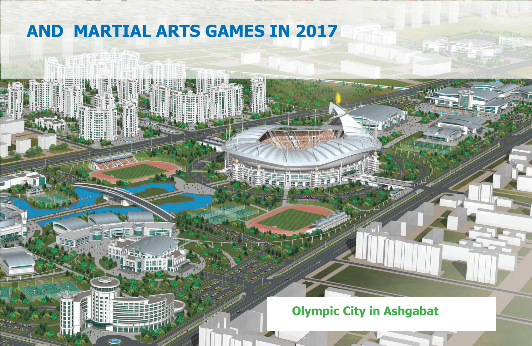
Olympic City in Ashgabat