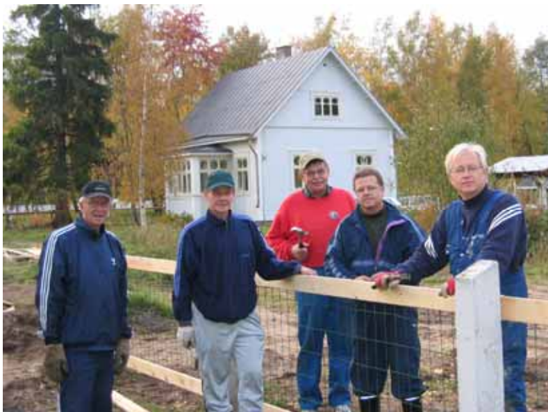
Syöpäyhdistyksen aidasta on jo suurin osa valmiina.

Hietasaareen liittyi myös Pohjois-Suomen Syöpäyhdistyksen virkistystalon Villa Toivon aidan rakentaminen. Syöpäyhdistys oli saanut haltuunsa vanhan rappeutuneen huvilan. LC Avaimen veljet tekivät mahtavan, vuosikausia kestäneen työn kunnostamalla täydellisesti huvilan ja sen piharakennuksen. Avain pyysi meiltä apua aidan rakentamiseen ison tontin ympärille ja Pokkitörmä lupasi hoitaa homman. Jykevät betoniset aitatolpat saimme purettavalta huvilalta Pyykösjärven Huvilatieltä. Vaikka tolppien kuopat kaivettiin koneella, oli painavien tolppien saaminen pystyyn ja suoraan linjaan raskas ja vaativa työ. Verkkoaita tukilautoineen tuli valmiiksi ja maalatuksi vuonna 2007.