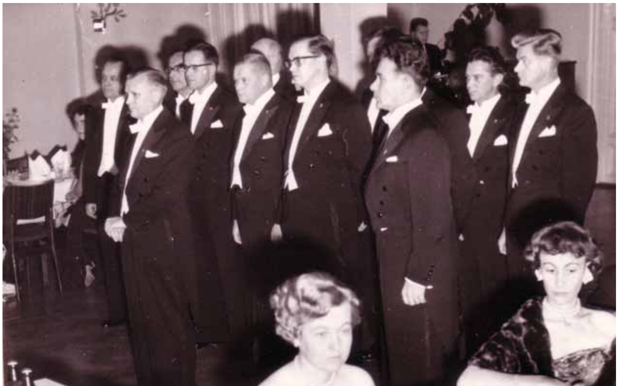
Perustajaveljet perustamisjuhlassa 1958.