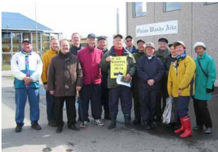
Hautakorventiellä hymyillään onnistuneen kirppiksen jälkeen ja aurinkokin alkoi paistaa.

Viimeinen kirpputori keskustassa pidettiin vuonna 2000.