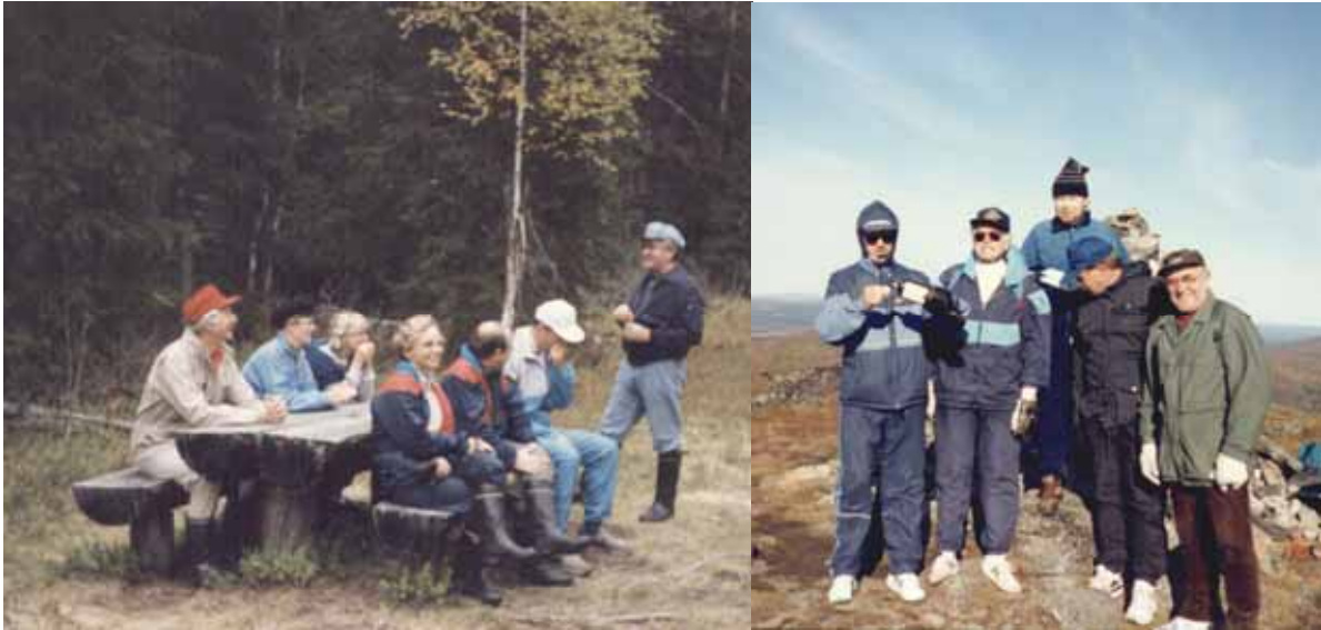
Tauon paikka Oulangalla.