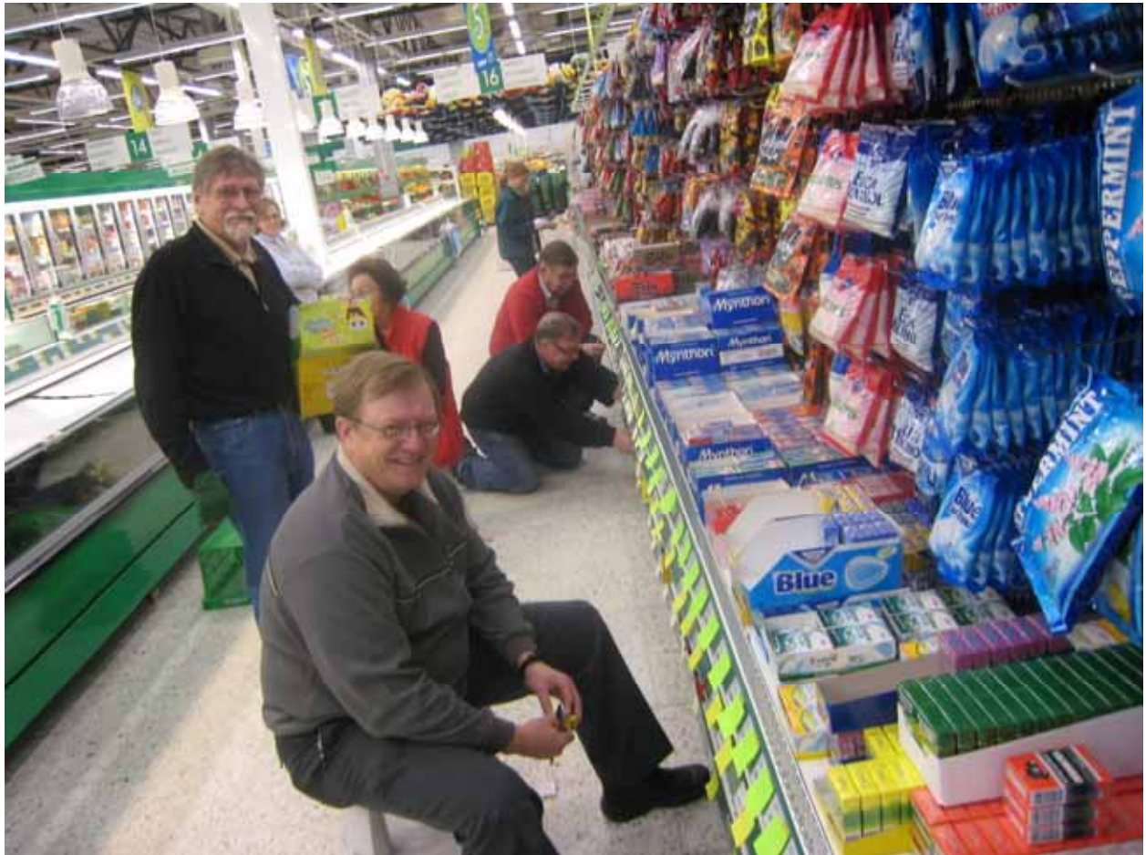
Karamellihyllyssä riitti laskemista Linnanmaan S-marketissa.

Tällä vuosituhanella tärkeimmäksi muodoksi varainhankinnassa ovat tulleet inventaariot Prisman marketeissa. Liikkeissä tarvitaan vielä nykyaikanakin ainakin kerran vuodessa käsin suoritettu hyllyissä olevan tavaran laskeminen, jotta saadaan liikkeen tavaravaraston kirjanpitoarvo selville. Tässä laskemisessa olemme päässeet yhteistyöhön Avain klubin kanssa. Vuoden vaihteessa ja joskus myös kesäkuun lopussa kokoamme porukan veljistä ja ladyistä tähän työhön. Työ tehdään tavallisesti illalla kuuden jälkeen tai aamulla kuudesta alkaen. Useimmiten tarvitaan useampi käynti, sillä kaikenlaista tavaraa on nykyisissä tavarataloissa valtavat määrät. Laskeminen ei ole raskasta, mutta tarkkaa työtä ja viisi tuntia kerrallaan on ihan tarpeeksi. Palkka maksetaan klubille tehtyjen tuntien mukaan. Se on tavarataloille edullista, kun mukaan ei tarvitse laskea sosiaalikuluja ja toisaalta me leijonat olemme osoittautuneet luotettaviksi laskijoiksi. Ongelmaksi