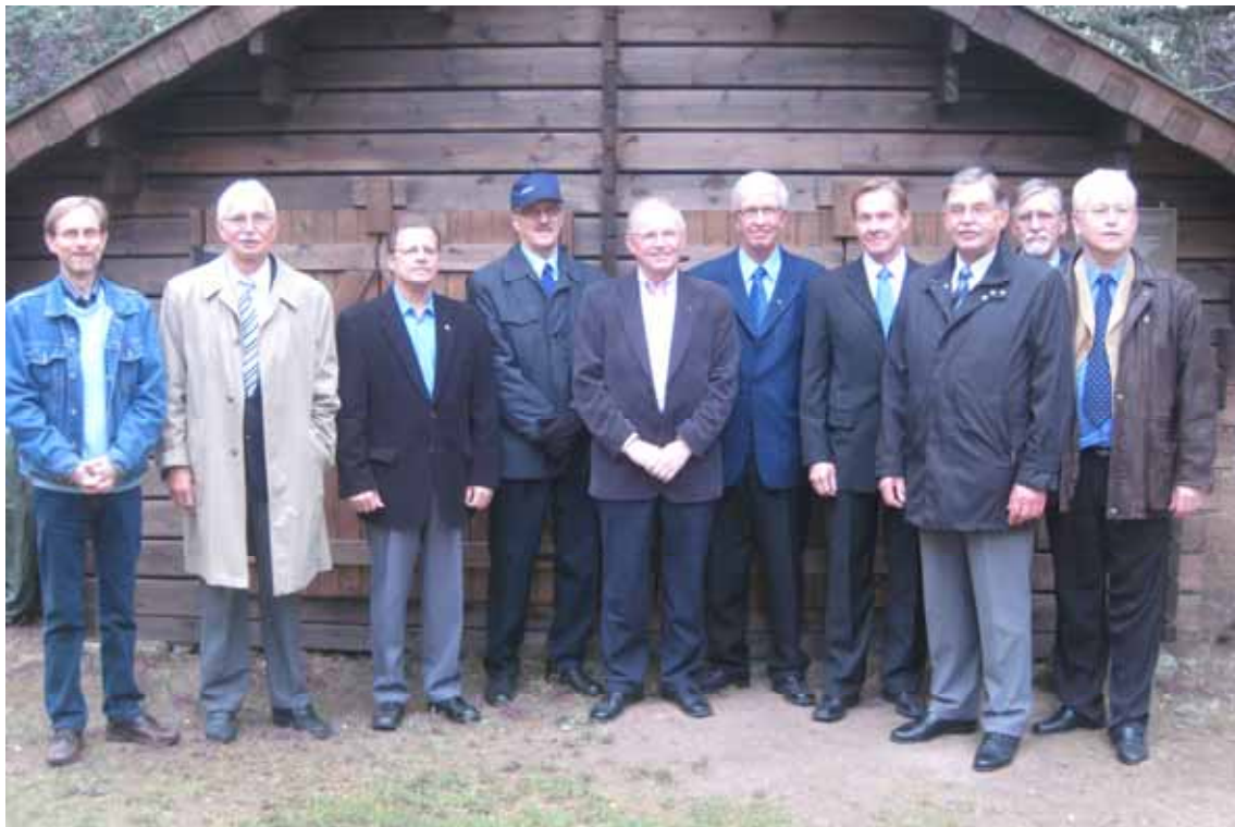
Puuvajan rakentamisessa mukana olleet veljet syksyllä 2008.